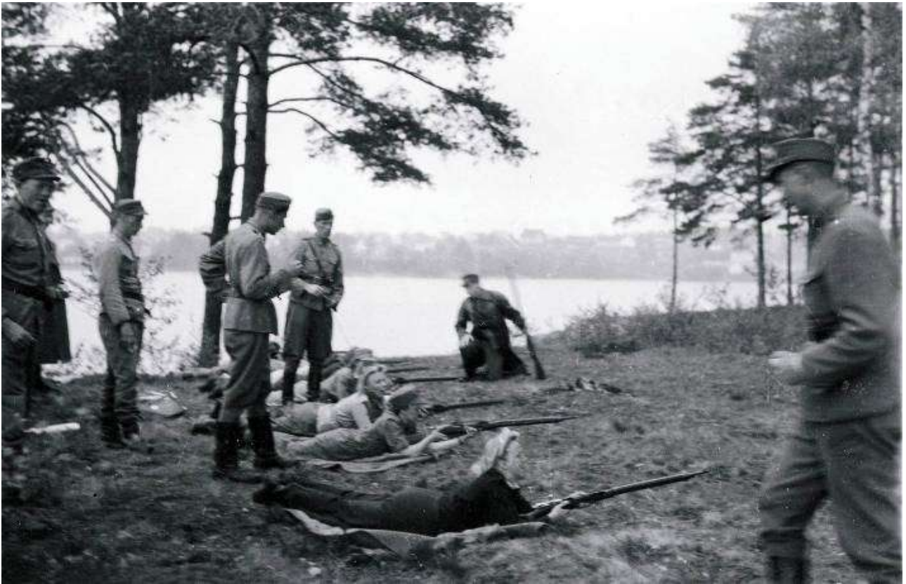
Valonheitinlotat saavat asekoulutusta Tampereen lähellä sijaitsevalla Lielahden kansakoululla kesällä 1944.