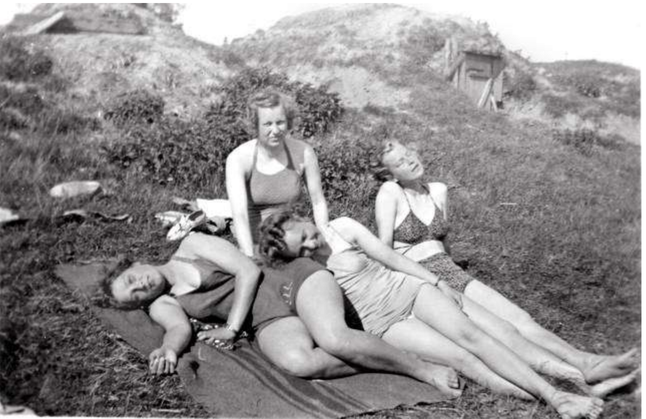
Lottien pigmenttikerho Aunuksenlinnassa kesällä 1942.