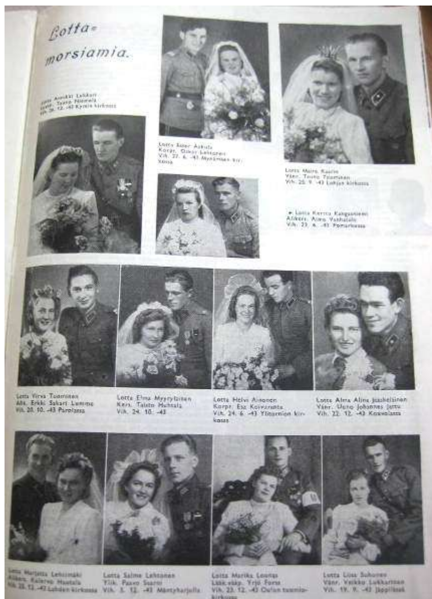
Lottamorsiamia-palsta Lotta Svärd -lehdessä 5–6/1944