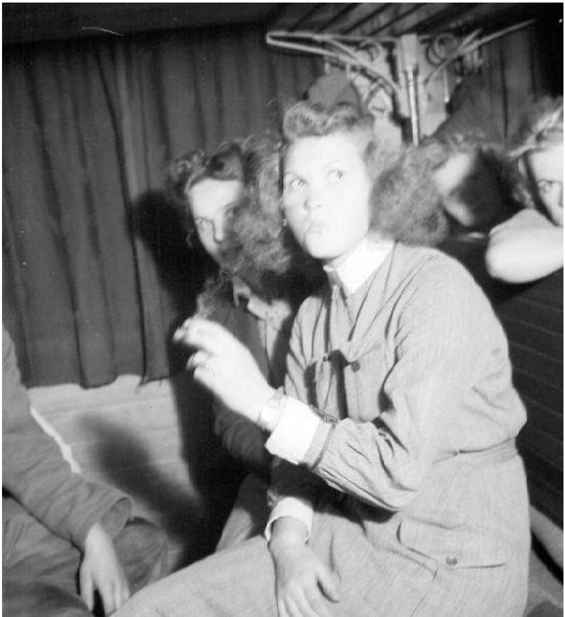
Kuriton lotta junassa tupakalla.