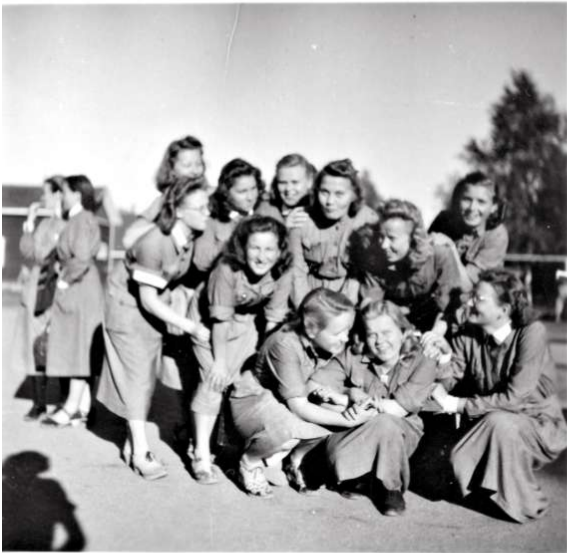
Nuoria lääkintälottakurssilaisia ja yhteisöllisyyden iloa jatkosodan alussa kesällä 1941.