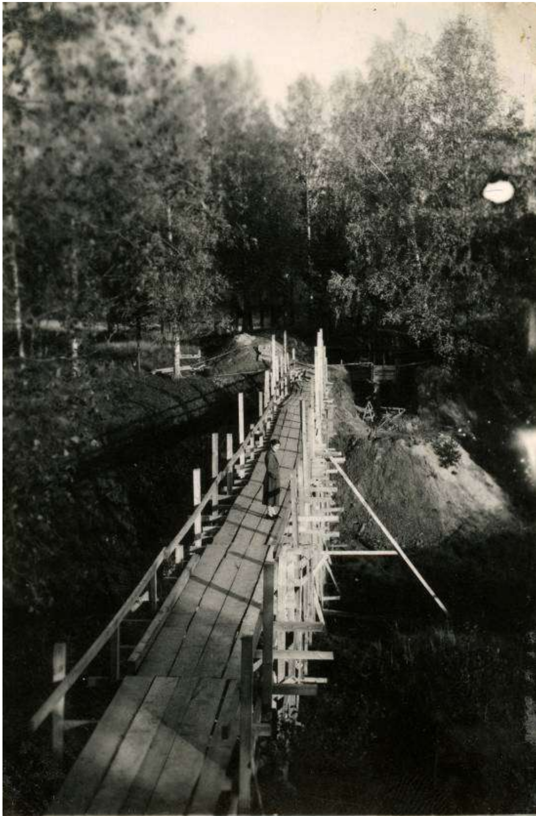
Silta yli Vammeljoen ikimuistoiseen, vuosisatoja vanhaan lehtikuusimetsään Raivolassa Kannaksella. Kuvassa on B/39. kenttäsaaralan lotta asemasodan aikana. Myöhemmin sodan jälkeen lotta palasi metsään hakemaan kuusentaimia istutettavaksi kotipihalle.