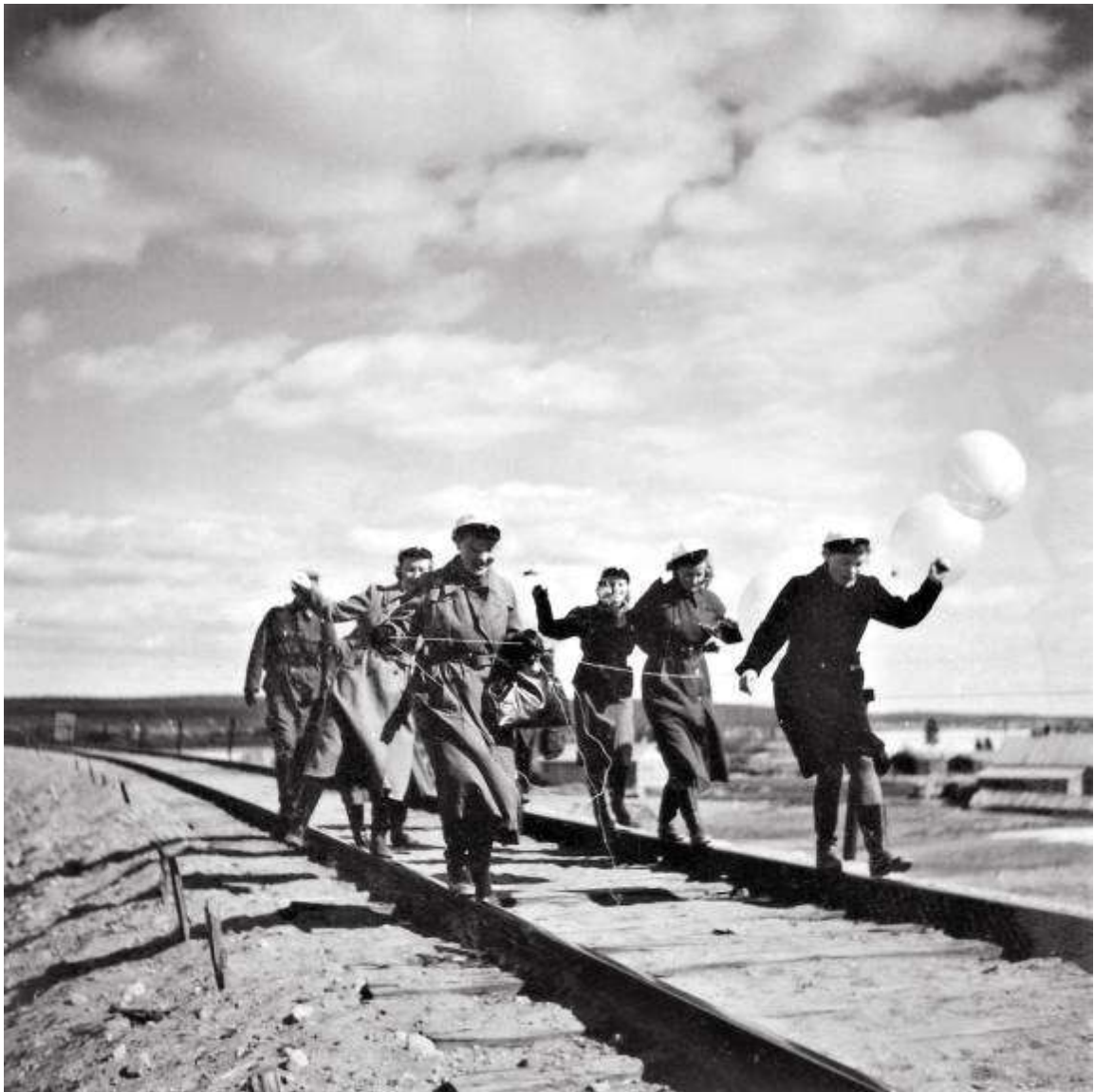
Lottia ja sotilaita vappua juhlistamassa Rovaniemen Suutarinkorvan sillalla 1943.