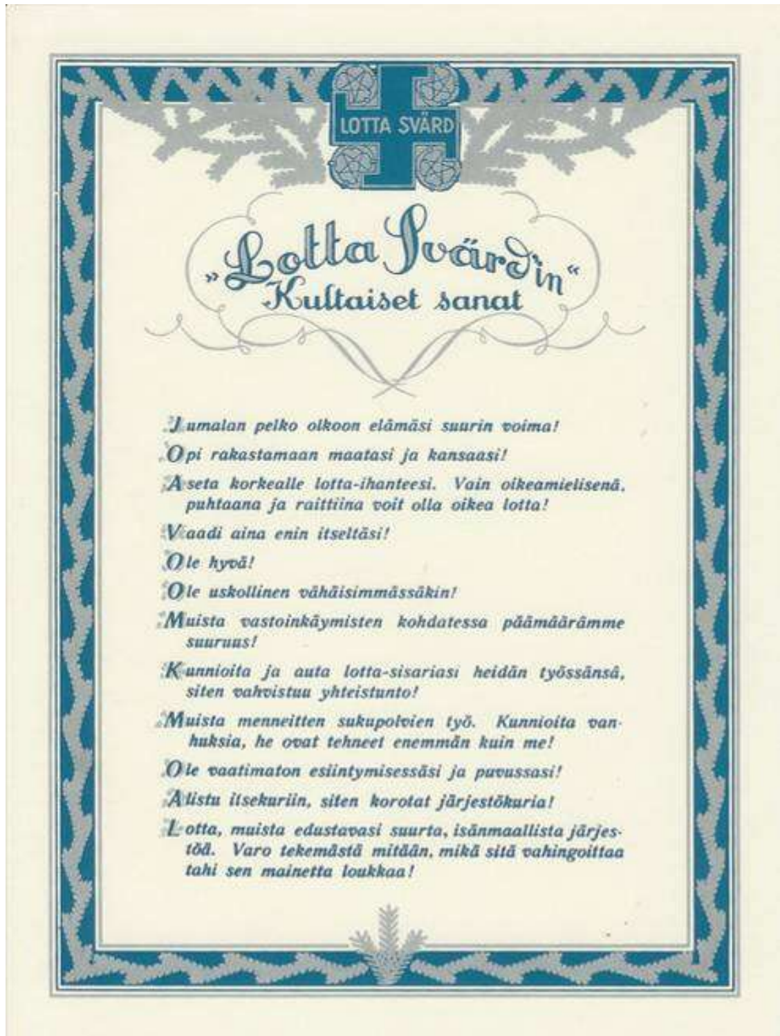
Lotta Svärd-järjestön Kultaiset sanat