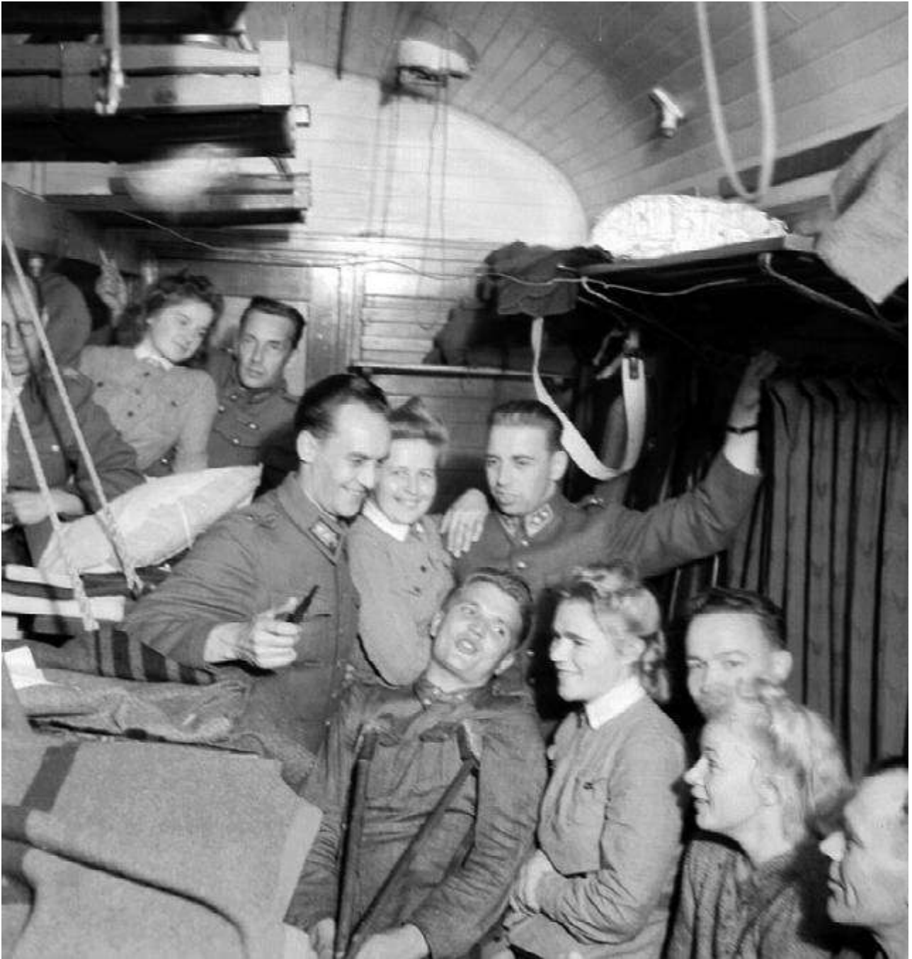
Lottia ja upseereja junassa.