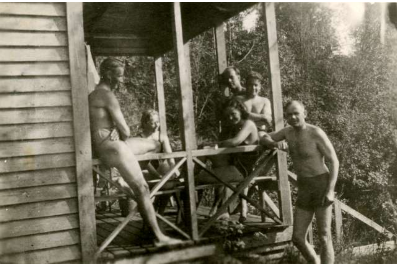
B/39. kenttäsairaalan väkeä saunomassa Uudenkirkon Vanhasahalla Kannaksella asemasodan aikana.