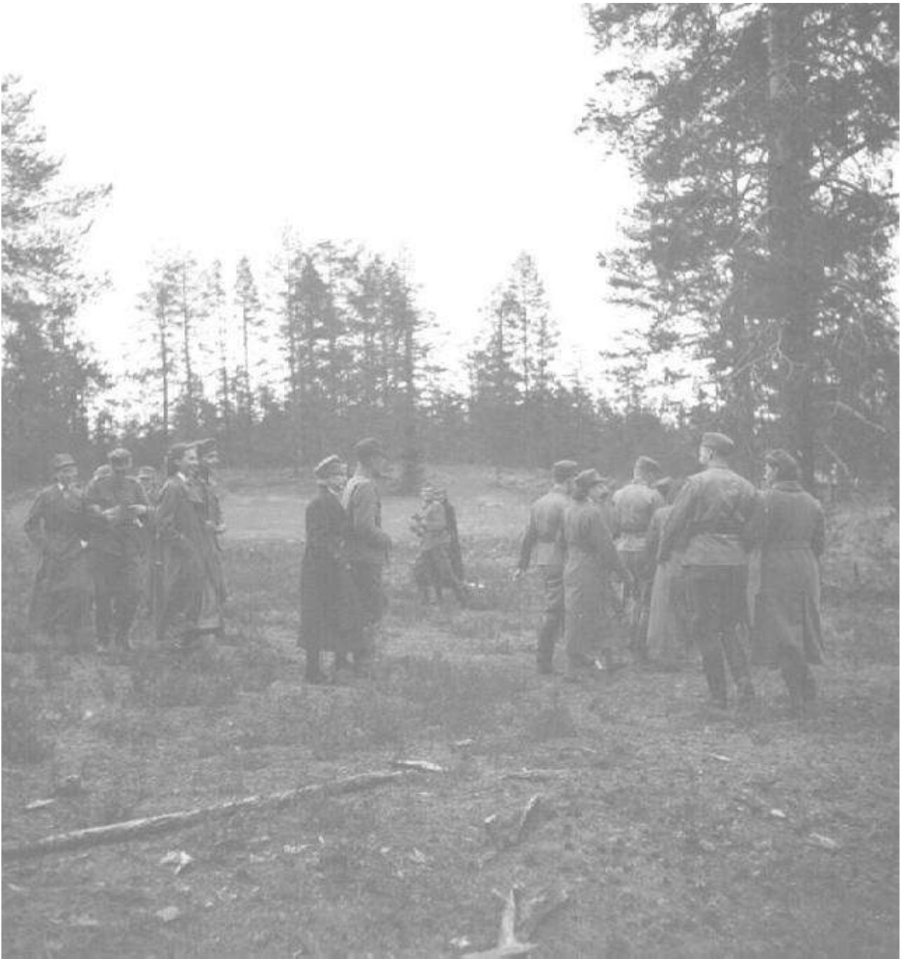
Lottia ja sotilaita rintamatansseissa.