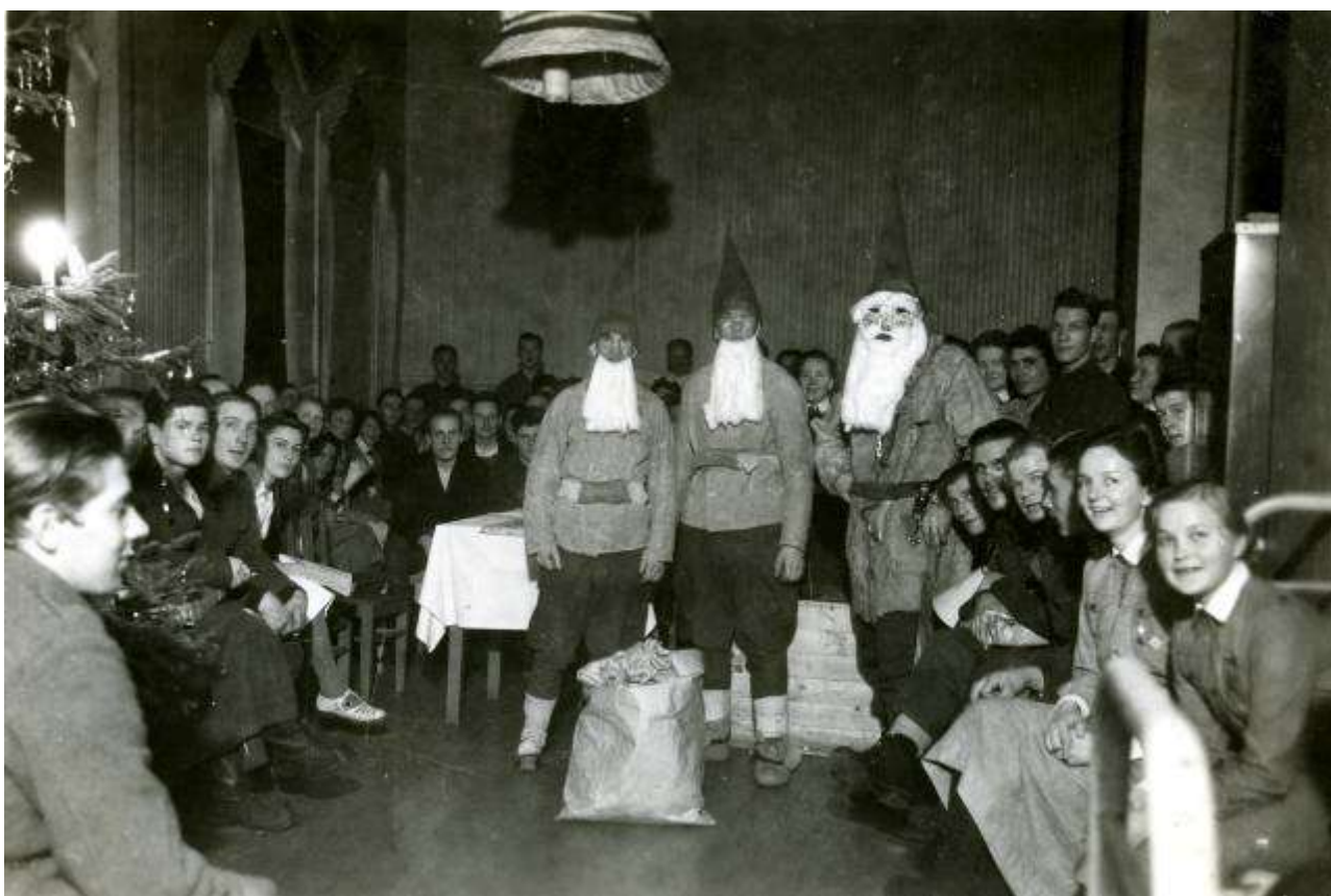
B/39. kenttäsairaalan joulu Uudenkirkon Vanhasahalla Kannaksella 1942.

erään Veeran luokkatoverin, jonkin aikaa sitten kaatuneen pojan nimen. (Mt., 98.)