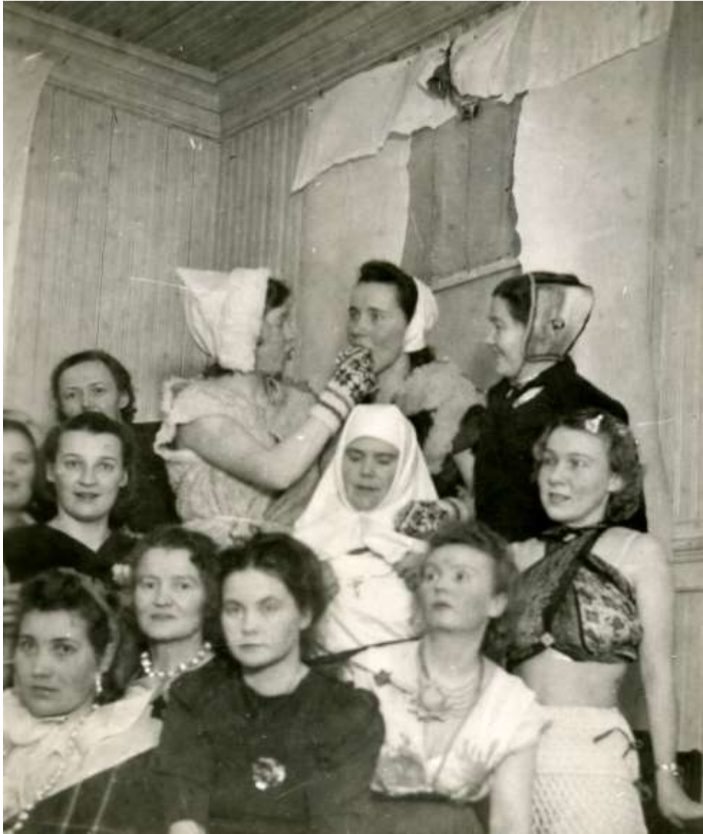
B/39. Kenttäsairaalan lottien naamiaset Kannaksella asemasodan aikana.