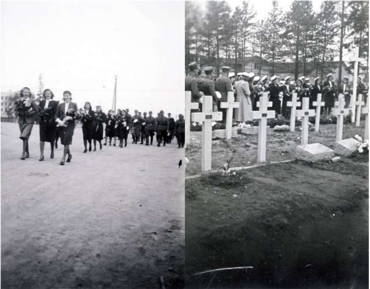
Gaudeamus igitur, juvenes dum sumus Asemasodan kevään 1942 ylioppilaita Rovaniemellä. Moni luokkatoveri oli jo kaatunut.