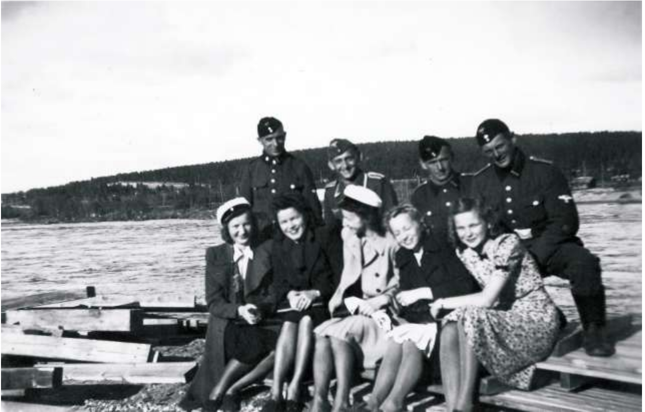
Siviilipukuisia lottia ja saksalaisia sotilaita Pohjanhovin rannassa Rovaniemellä jatkosodan kesällä 1942.