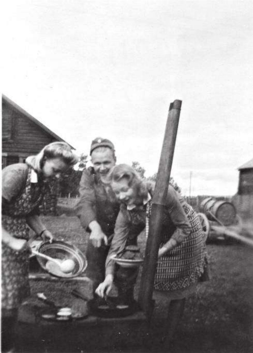
"Se oli kaikkein suurin ilo, kun niitä lättyjä paistettiin." Lottia ja sotilas räiskäleen paistossa Aunuksenlinnassa kesällä 1942.