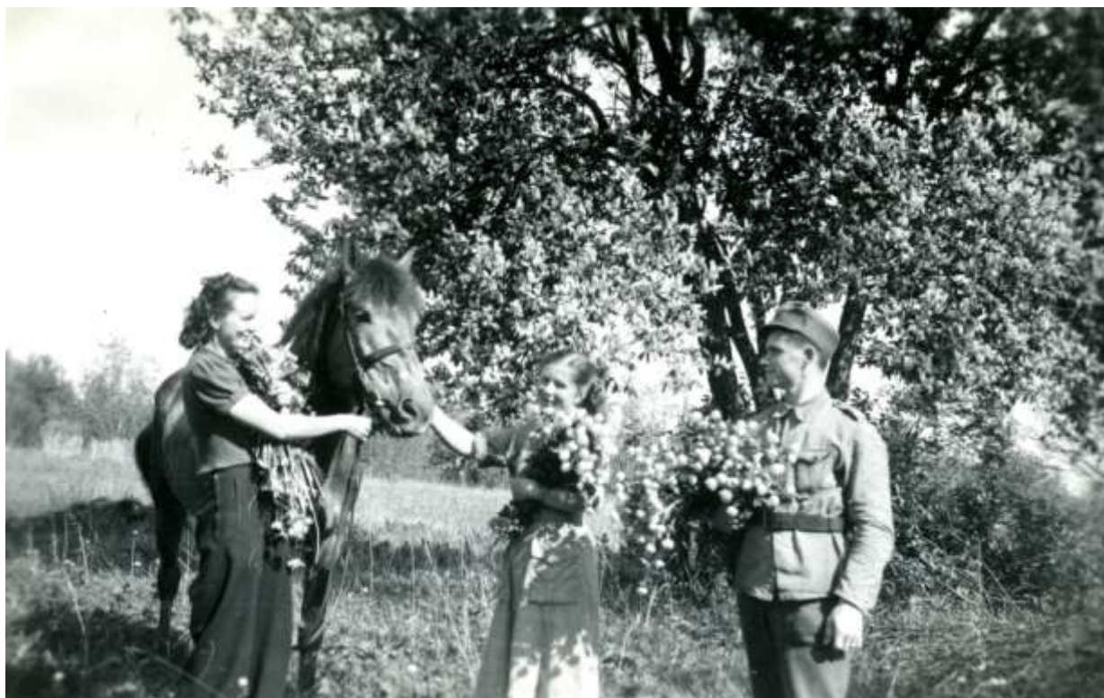
Lottia ja sotilas Raivolassa asemasodan aikana. Hevosta pitelevä siviiliasuinen lotta muisteli yhä kaiholla Kannaksen ”kulleromeriniittyjä”, joissa sai kahlata polvia myöten.