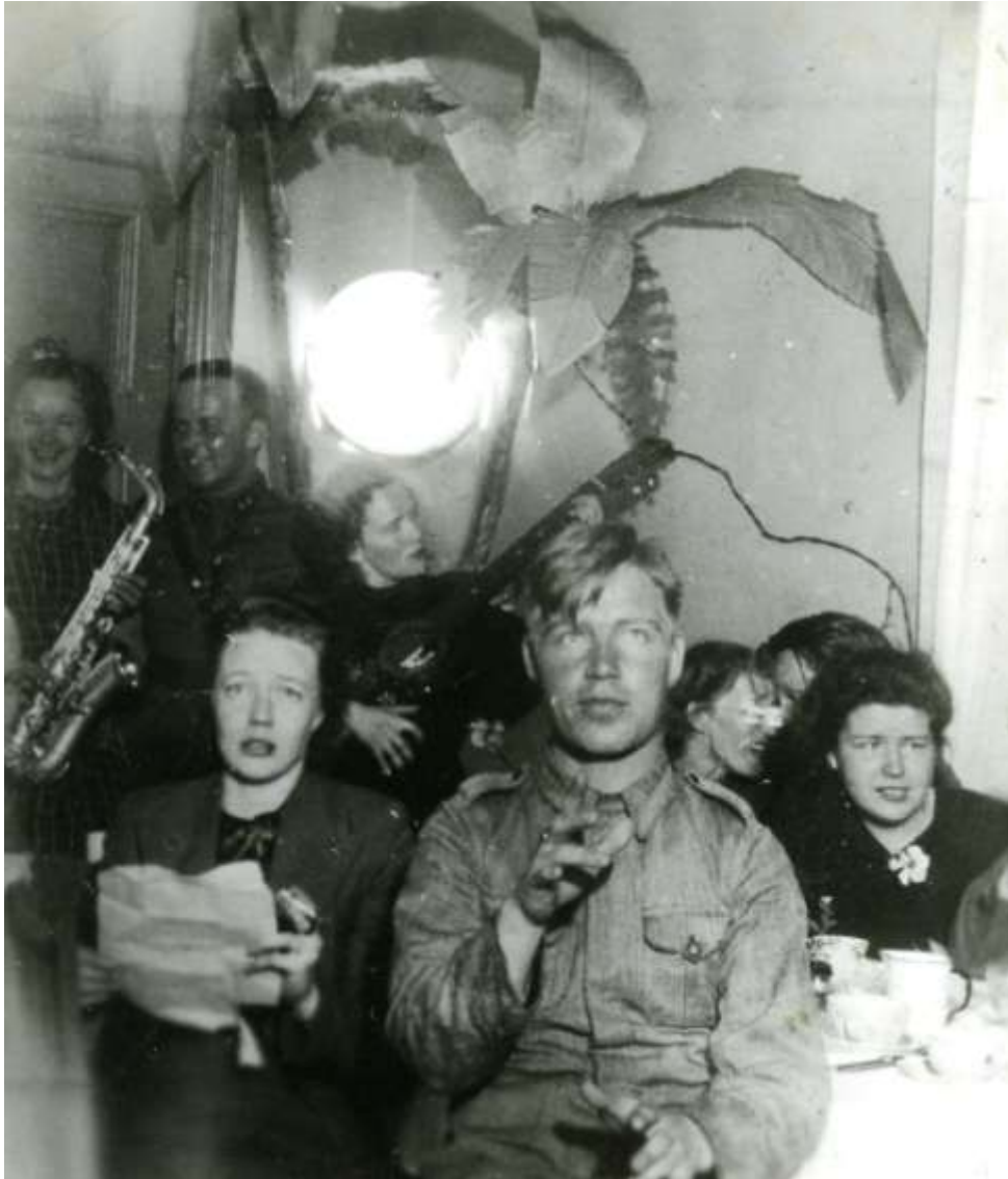
B/39. Kenttäsairaalan revyy ”Villa Pervitin” esiintyy asemasodan aikana Kannaksella.