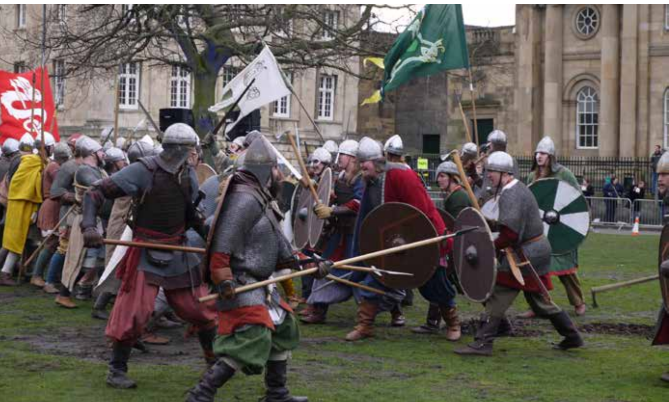
Viikinkitaistelu, York.

yliopiston matkailutoimijoiden kanssa. Matkalaiset kiinnittävät huomiota siihen, että italialaiset arvostavat ruokaa ja erityisesti ruuan paikallisuutta aivan eri tavoin kuin suomalaiset. Ruuan tarjoama makunautinto nähdään hyvinvoinnin tuojana, joten laadukas, paikallinen ruoka riittää hyvinvointimatkailutuotteeksi. Näin ollen ruoka ja paikalliset tuotteet ovat luonnollinen osa matkailutuotteita ja jopa niiden pääsisältö. Paikallisuus ja aitous nousivat muutenkin voimakkaasti esille maatilamatkailukohteissa. Aitouden varmistaa lainsäädäntö, joka hyväksyy maatilamatkailukohteiksi vain maataloudesta päätulonsa saavat tilat.