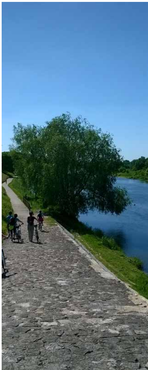
Pyöräilyä Loiren laaksossa, Ranska.

Pariisiin ja Loiren laaksoon suuntautuneen matkan tavoitteena oli oppia hyviä käytänteitä pyöräilymatkailun kehittämisestä ja verkostoitumisesta. Tavoitteena oli myös saada ideoita pyöräilymatkailutuotteista ja -palveluista sekä saada hyviä esimerkkejä opetuksen tueksi. Finpron järjestämään matkaohjelmaan kuului aluksi kaksi päivää Pariisissa, jossa ohjelmaan sisältyi pyöräilymatkailua ja pyöräilyä yleisesti kehittävien yhdistysten (Maison du Vélo, France Vélo Tourisme ja French Federation of Cycle Touring) esityksiä sekä opastettu pyöräily-sightseeing Pariisin keskustassa. Matkan jälkipuolisko vietettiin Loiren laaksossa, kaupungeissa nimeltä Blois ja Tours sekä niiden ympäristössä. Loiren laaksossa kuultiin pyöräilymatkailijoita palvelevan logistiikkayrityksen Bagafrancen, pyöräilymatkatoimisto Rando Vélon ja Loiren laakson linnojen ympärille muodostetun pyöräilymatkailukonseptin Pays des Châteaux à Vélon esittelyt. Loiren laaksossa myös testattiin kahta konseptin mukaista maaseudun pyöräilytuotetta linnavierailuineen. Matkalla havaituista hyvistä käytänteistä voi erityisesti mainita pyöräilymatkailun alueellisen ja kansallisen verkostoitumisen. Monet yhdistykset ja organisaatiot edistävät yhtenäistä pyöräilyreittiverkostoa, jonka opastus on yhtenäinen ja joka kokoaa yhteen pyöräilymatkailua tukevat palvelut ja nähtävyydet.