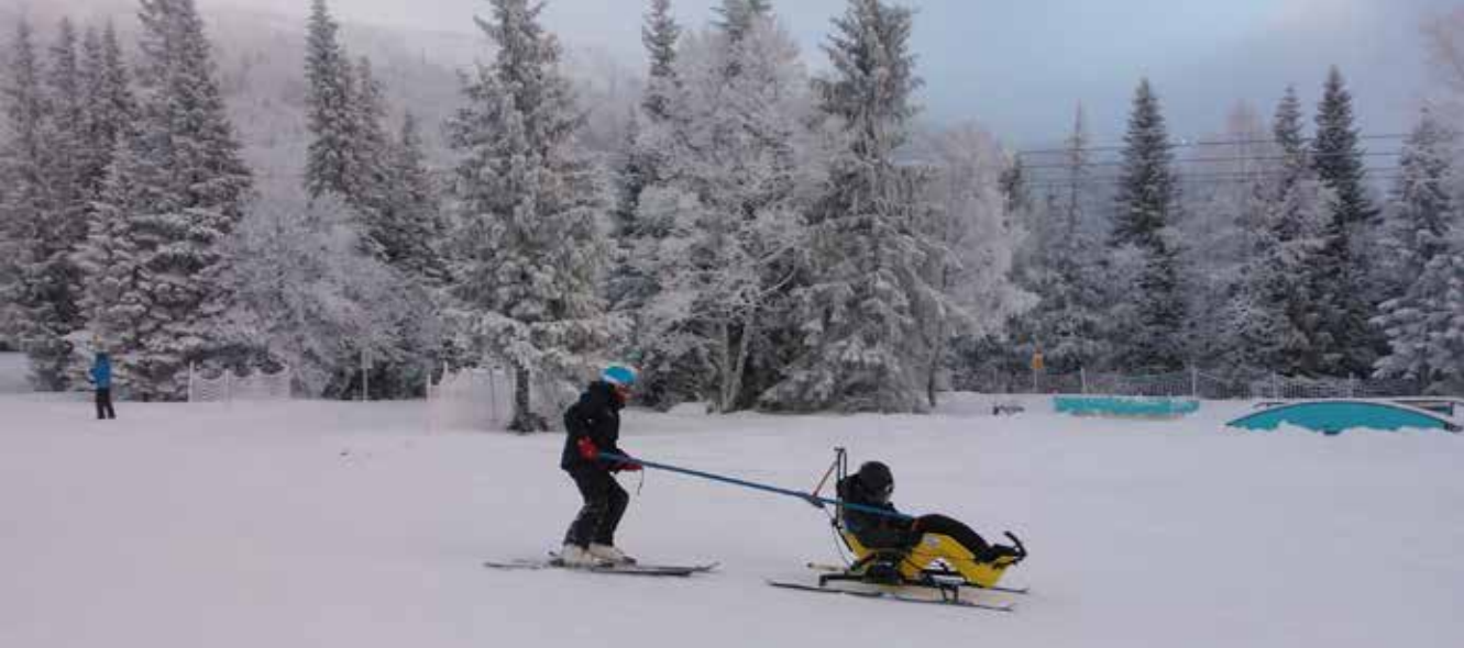
Totalskidskolan, Åre.

tuoda myös Lappiin. Erityisesti esteettömyys ja esteettömien matkailupalveluiden kehittäminen herätti matkalaisten keskuudessa kiinnostusta ja innostusta.