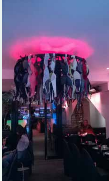
Sisustuselementti kahvilassa, Pariisi.