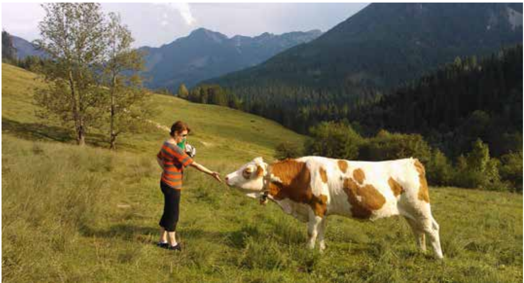
Vaellusreitistöt, Itävalta.

Viiden päivän mittainen matka suuntautui Itävaltaan, Wieneriin ja Gross Glocknerin alppitien maisemiin sekä pohjoisitalialaiseen Burnicon kylään. Matkan tavoitteena oli tutustua erilaisiin reitistöihin ja reitistöjen ympärille rakennettuihin matkailutuotteisiin liittyviin hyviin käytänteisiin. Matkan aikana tutustuttiin Wienin matkailuinfoon, testattiin kaupunkipyöräilysafaria Wienin keskustassa ja lähistöllä, tutustuttiin Kalkalpenin luonnonpuiston maastoon, Gross Glocknerin alppitien ympärille rakennettuihin matkailupalveluihin sekä vierailtiin paikallisessa yliopistossa. Wienissä toteutettu pyöräily safari oli erityisesti matkailijoiden mieleen, lukuun ottamatta safariin liittyviä turvallisuuspuutteita. Samoin Gross Glocknerin alppitiellä havaittiin reittien konseptointiin ja tuotteistamiseen liittyviä hyviä käytänteitä, vaikka sumuinen sää estikin reitin hienoista maisemista nauttimisen. Kalkalpenin luonnonpuistossa matkailijoiden huomiota kiinnitti paikallisuuden näkyminen ja hyödyntäminen vaellusreittien varsilla.