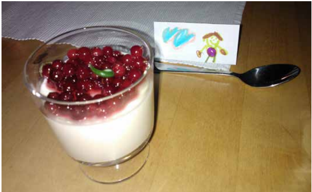
Illallinen paikallisessa kodissa, Åre.

vän terveitä matkustaakseen, heillä on varaa matkustaa ja he haluavat hemmottelua ja kunnon kohennusta. Myös mielen virkistys on tärkeä asia. Luonto on jo sinänsä hyvinvoinnin lähde, sillä lyhytkin jakso metsässä esimerkiksi alentaa tutkitusti verenpainetta (Tyrväinen ym., 2014). Suomessa luonto, metsät ja järvet ovat hiljaisia ja puhtaita. Se tosiasia, että täällä uidaan ja kalastetaan vedessä, jota voisi juoda, unohtuu usein. Samoin unohtuu se matkailupotentiaali, joka tähän suomalaiseen elämäntapaan sisältyy. Suomalaiset ovat niin tottuneita luontoon, että sillä rahastaminen ei tunnu luontevalta. Monet metropolien asukkaat ovat kuitenkin hyvinkin valmiita maksamaan oikeudesta kävellä metsäpolulla. Pelkkä metsäkävely ei välttämättä ole kovin myyvä, mutta tuotteistamalla se esimerkiksi "keuhkojen syväpuhdistukseksi metsässä" saadaan huomattavasti houkuttelevampi matkailutuote. Hyvinvointimatkailun mahdollisuus onkin siinä, että suuria investointeja ei välttämättä tarvita, vaan hyviä ideoita ja mielikuvitusta. (Lehtonen, 2014.)