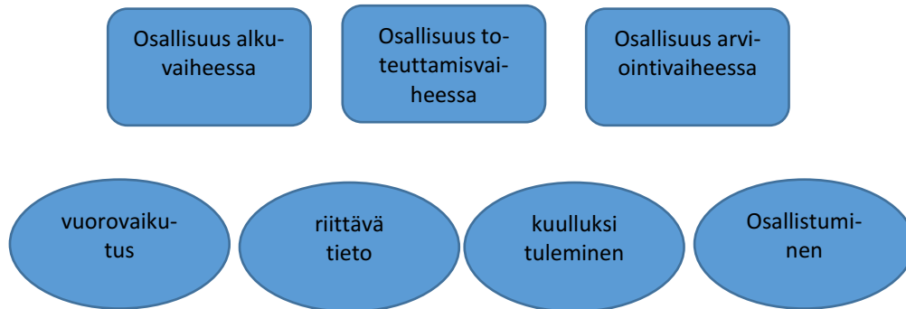
Kuvio 2. Hahmotelma osallisuuden muodoista asiakasprosessin eri vaiheissa.

Tutustuessani ja vähitellen syventyessäni enemmän haastatteluihin ja niiden sisältöön, koin alkuperäisen teemoittelun jokseenkin merkityksettömäksi. Aineistoa tutkiessani huomasin, ettei kyseinen teemoittelu tuntunutkaan parhaalta mahdolliselta, ja aloin pohtia asiaa uudelleen. Aineistoa lukiessani esille nousi tiettyjä teemoja, joita oli vaikea erotella alkuperäisten teemojen, asiakasprosessin eri vaiheiden alle. Esimerkiksi kuvion 2. hahmotelmassa selkiytyi, että teemat tulevat nimenomaan aineiston kautta ja ne sisältyvät kaikkiin asiakasprosessin vaiheisiin. Lopulta päädyin teemoittamaan aineiston kokonaan uudelleen. Teemoiksi muotoutuivat asiakasprosessi kokonaisuudessaan, perhetyö lapsen arjessa, lapsen ja työntekijän välinen vuorovaikutus sekä lapsen kuulluksi tuleminen. Teemat tulivat suoraan aineistosta; Ne tuntuivat luontevilta teemoilta aineistoon syventyessäni ja aineistoa käsitellessäni, koska näitä teemoja lapset tuottivat puheissaan.