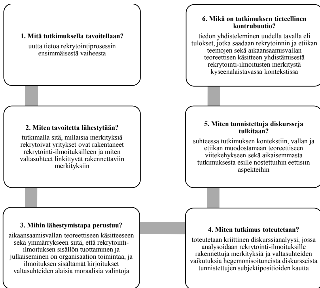
Kuvio 1. Tutkimuksen tavoitteet ja aiheen raja- jaus

Suomen lain lisäksi suomalaista rekrytointi-ilmoittelua ohjaa merkittävä määrä muita tekijöitä, joita voivat olla esimerkiksi erilaisten alakohtaisten ja kulttuuristen käytäntöjen kontekstit. Kuitenkin puhuttaessa etiikasta, vallasta ja diskurssien sisäisistä valtasuhteista, on edellä esittämäni yhdenvertaisuuslain olemassaolon tiedostaminen tutkimukseni kontekstina tärkeää. Tämä siksi, että tutkimuksessa hyödyntämäni valtasuhteita tarkastelevat näkökulmat saavat uusia merkityksiä rekrytointi-ilmoittelua ympäröivässä lain kontekstissa. Kokonaisuuden selkeyttämiseksi tämän tutkimuksen tavoitteet ja aiheen raja- jaus on havainnollistettu kuviossa 1.