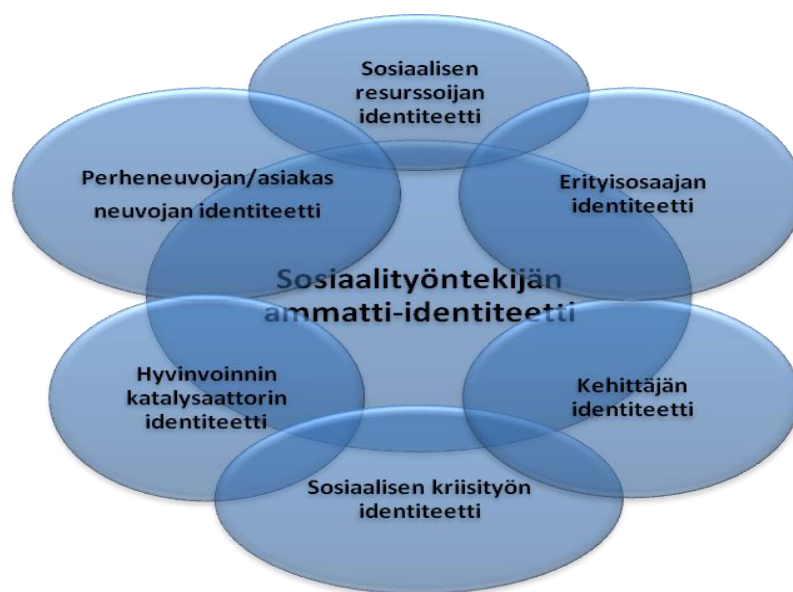
KUVIO 4. Sosiaalitoimistojen sosiaalityöntekijöiden ammatti-identiteetti (Vaininen 2011, 245).

Kuviossa 4. esitetään Vainisen (2011, 245) tutkimustuloksien mukainen sosiaalityön uudenlaisten toimintaympäristöjen edellytysten mukaisesti muuttunut tapa kokea sosiaalityöntekijyys eli sosiaalityöntekijän ammatti-identiteetti. Kuviossa ilmenee tulosta siitä, miten ammatillis-ideologinen ja toimintarakenteellinen muutos on muokannut sosiaalitoimistojen sosiaalityöntekijöiden kokemusta itsestään sosiaalityön ammattilaisina moniammatillisissa suhteissa. Sosiaalityöntekijät orientoituvat asiakastilanteisiin perheneuvojan tai asiakasneuvojan, hyvinvoinnin katalysaattorin, sosiaalisen kriisityön, sosiaalisen resurssioijan, erityisosaajan tai kehittäjän ammatti-identiteetin mukaisesti.