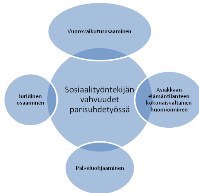
Kuvio 7. Sosiaalityöntekijän vahvuudet parisuhdetyöntekijänä

Tutkielmani kiinnostuksen kohteena olivat myös sosiaalityöntekijöiden kokemukset omista vahvuuksistaan parisuhdetyöntekijöinä. Tutkimusaineistosta nousseet vahvuudet sosiaalityöntekijän tekemässä parisuhdetyössä on kuvattu kuviossa 7.