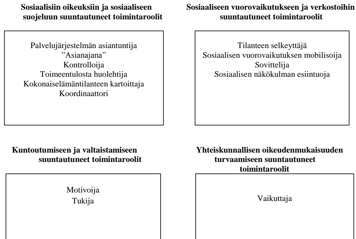
Kuvio 1. Sosiaalitoimiston sosiaalityöntekijöiden toimintaroolit asiakastyössä (Vaininen 2011, 114).

Sosiaalityön sosiaalisiin oikeuksiin ja sosiaaliseen suojeluun suuntautuneet toimintaroolit keskittyvät asiakkaiden sosiaalisista oikeuksista huolehtimiseen. Sosiaalityöntekijän tehtävänä on yhdessä asiakkaan kanssa kartoittaa asiakkaan elämäntilanne ja huolehtia siitä, että asiakas osaa hakea tilanteen vaatimat palvelut ja etuudet, joilla elämäntilanne saadaan korjattua. Sosiaalityöntekijän velvollisuus on aikaisemman puolesta tekemisen sijasta opastaa asiakasta omaan toimijuuteen. Sosiaalisten oikeuksien ja sosiaalisen suojelun toimintarooliin kuuluu myös sosiaalityöntekijän selontekovelvollisuus erilaisten lausuntojen ja selvitysten antajana sekä asiakkaansa asianajana eri palveluita haettaessa. (Raunio 2000, 43; Juhila 2008, 23-25; Raunio 2009, 103.) Sosiaalisten oikeuksien puolustajan toimintarooliin liittyy myös kiinteästi sosiaalityön kontrollin ulottuvuus, jolloin asiakkaan tilanne saattaa vaatia oikeuksiin perustuvaa suojelua. Lastensuojelussa joudutaan useimmiten kasvokkain tilanteiden kanssa, jossa vanhemman itsemääräämisoikeutta suhteessa lapseen joudutaan rajoittamaan lapsen edun nimissä (Raunio 2009, 107.)