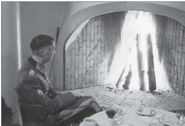
Kuva 6. Kenraalieversti E. Dietl takkatulen ääressä

Dietl osallistui Rovaniemen elämään ja kohosi legendaariseen asemaan. Saraste (2002) kuvailee hänen olemustaan: