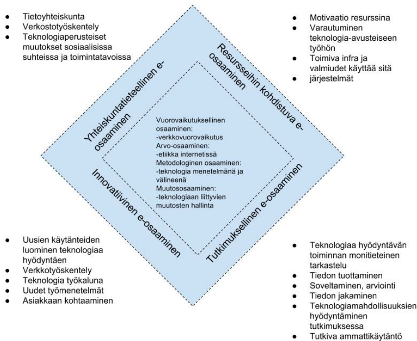
Kuvio 3. e-Osaaminen sosiaalityössä (Kilpeläinen & Sankala 2010, 285)

Yhteenvedonä tämän alaluvun lopuksi todettakoon, että tässä tutkimuksessa pyritään nimenomaisesti jäsentämään sosiaalityön asiantuntijuutta sosiaalityön tavoitteiden, uuden yhteiskunnallisen kontekstin sekä sosiaalisen ja teknologisen yhdistämisen näkökulmasta. Tutkimuksen tehtävä on tarkastella asiantuntijuutta avoimena ilmiönä, mutta sosiaalityön tavoitteisiin ja teknologisen toimintaympäristön ilmiöihin nivoutuvana. Sosiaalityön asiantuntijuuden hahmottaminen perinteisenä, offline, verkottoman ympäristön sisällä tapahtuvana ilmiönä ei ota huomioon niitä sosiaalisia olosuhteita ja konteksteja, joissa ihminen elää nyt. Sosiaalityön täytyy kyetä reflektoimaan perinteisen asiantuntijuuden riittävyttä, mutta myös online, verkkopohjaisen ulottuvuuden tarjoamia mahdollisuuksia unohtamatta sosiaalityön eettisiä periaatteita.