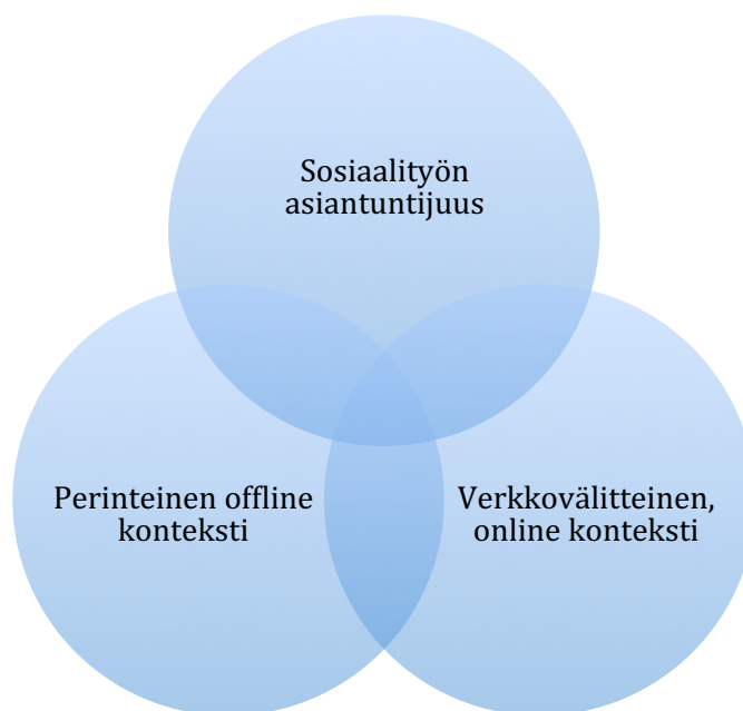
Kuvio 4. Sosiaalityön asiantuntijuus tutkimusilmionä

Kuviossa 4. havainnollistetaan konkreettisesti tutkimuksen asetelmaa. Siinä keskeiseksi tehtäväksi muodostuu sosiaalityön asiantuntijuuden ja osaamisen tarkastelu ja siitä tuotetut erot todellisuuden offline- ja online -konteksteissa. Erojen tarkastelu tuottaa analyyttisen välineen, eli vastakkaiset suhteet, joilla pyritään purkamaan ja uudelleen rakentamaan sosiaalityön asiantuntijuutta. Tutkimuksen perustehtävä on rekonstruoida malli, jossa kuvion kolme teemaa yhdistyvät.