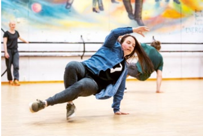
Tanssia ja sirkusta.