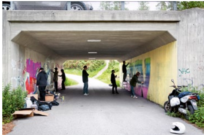
Graffitimaalausta alikulkutunnellissa.