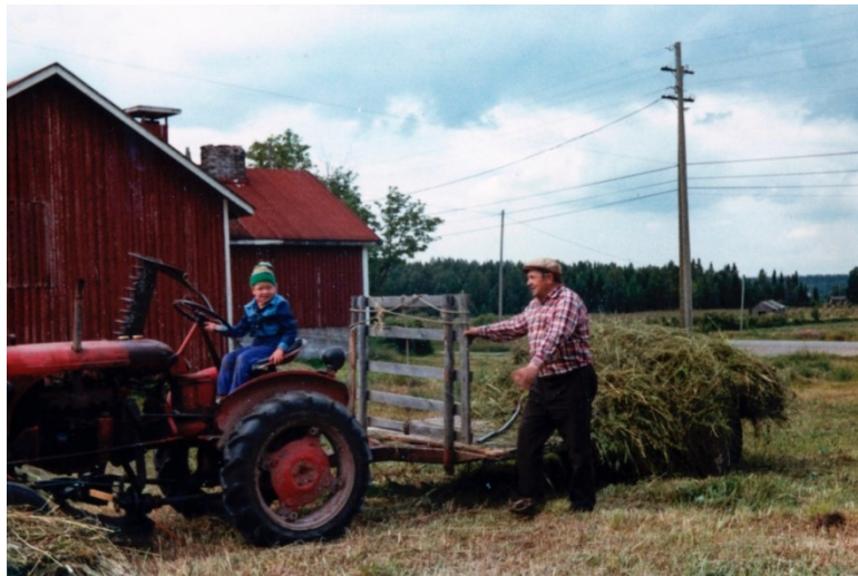
Kuva 17. Toivasen talon pihapiiristä.