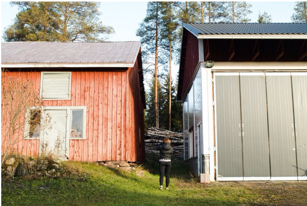
Kuva 2. Rakennuksia eri vuosikymmeniltä Siirtolan pihapiirissä.

Ylipaakkolantiellä ajan kerroksellisuus on vahvasti läsnä monella eri tavalla (ks. kuva 2). Itse rakennukset ovat konkreettisia jälkiä menneisyydestä ja voimme lukea niistä sekä per-