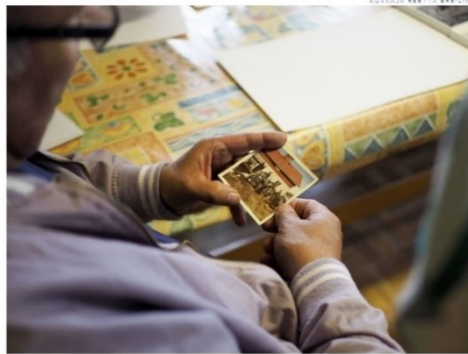
Yhteisötaideprojekti antoi vanhoille kville uutta merkitystä.