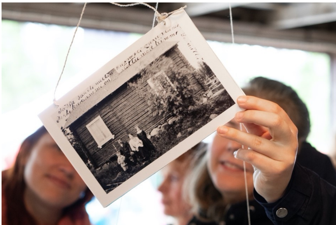
Kuva 33. Näyttelyvieraita osallistavien kaksipuoleisten teosten äärellä.