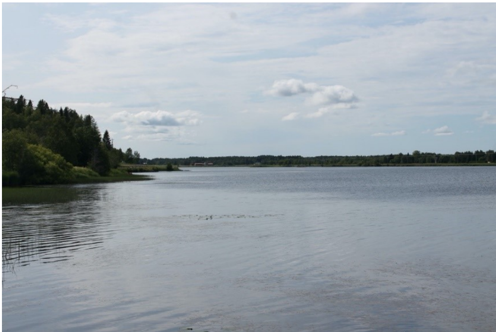
Kuva 7. Jokinäkymän muutosta. Kuva: Aarno Ollitervo, 2019, Hannus.