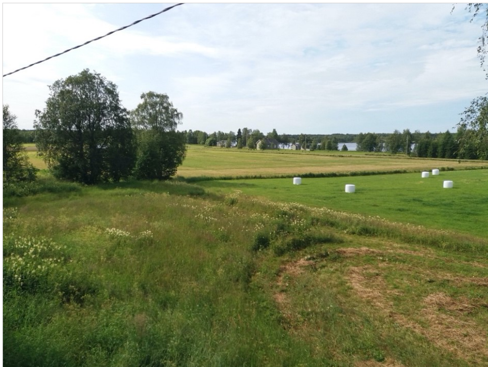
Kuva 24. Maisema Hastin tilalta. 2019.