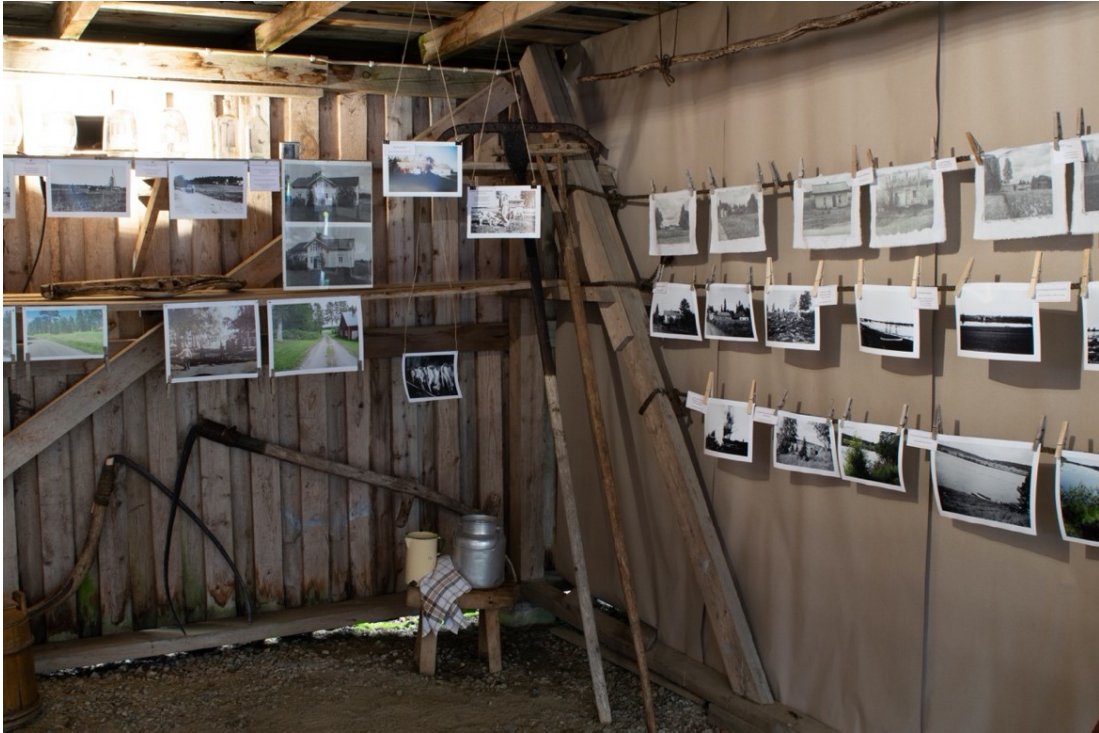
Kuva 32. Näyttelyssä eri tekniikoin toteutetut teokset ja vanhat käyttöesineet muodostivat monitasoisen kokonaisuuden.

Näyttelyn kautta voitiin tuoda Ylipaakkolasta esiin asioita, joista koko seutu saattoi olla ylpeä. Osallistujat kokivat yhdessä toteutetun näyttelyn johdosta ylpeyttä Ylipaakkolantiestä, sillä sen koettiin antavan muillekin hyvän kuvan alueesta. Itselle tärkeät paikat ja asiat -teemaa olikin näyttelyssä monin tavoin läsnä. Johtopäätöstemme mukaan ilman näyttelyä osallistujien ylpeys omasta paikastaan olisi voinut jäädä näkymättömiin.