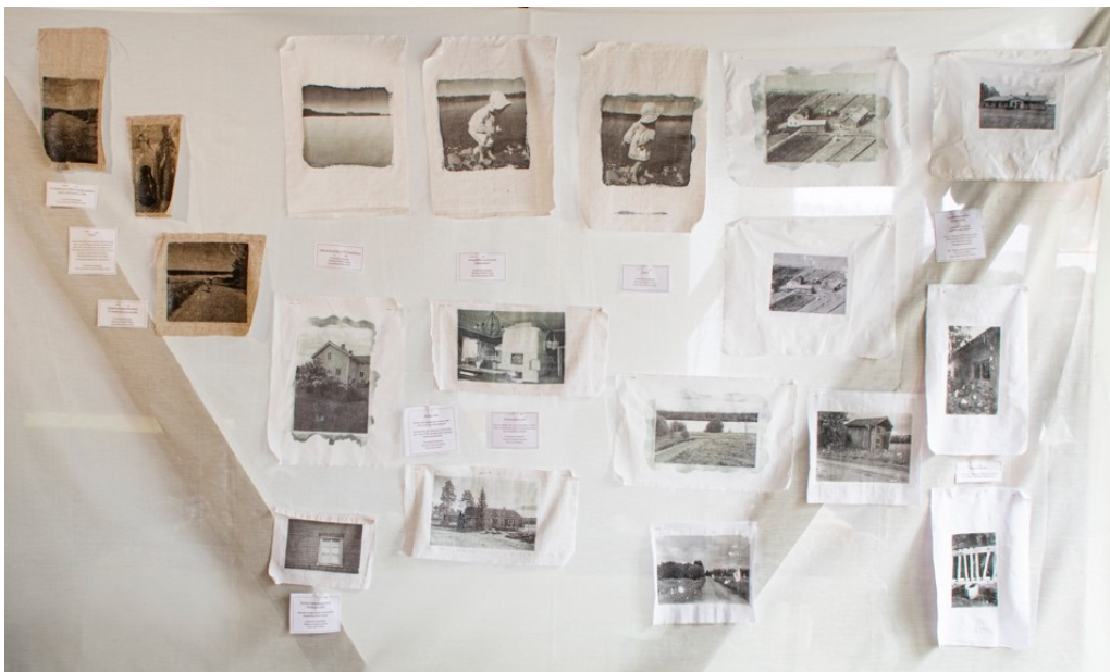
Kuva 30. Kuvansiirtoja useilta osallistujilta. Kuvansiirron kautta uusien ja vanhojen kuvien välinen visuaalinen ero pieneni. Kuvansiirrot houkuttelivat näyttelyvieraita tarkastelemaan eri vuosikymmeninä kuvattuja valokuvia läheltä