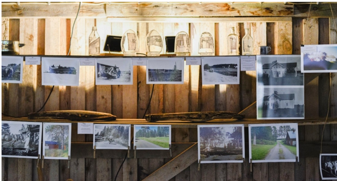
Kuva 19. Yhteisötaideprojektin myötä vähemmän kuvatut arjen hetket tuotiin yhteen ja niistä koostui suuri joukko.

Ulkuniemi tarkasteli tutkimuksessaan perhevalokuvaa pohtivan tilateoksensa ja sen katsojan kohdatessa muodostunutta dialogia. Tutkimuksessa ilmeni perhevalokuvaan liittyviä käsityksiä, kuten että valokuvaan voi tallentaa tärkeitä hetkiä ja valokuvat pysäyttävät ajan. Kuvat tekevät myös muutoksen ja arjen näkyväksi. Tilateoksen katsojien mukaan arjen merkitys tulisi huomata, eikä tallentaa kuvaan vain elämän huippuhetkiä. (Ulkuniemi, 2005, s. 4.) Ulkuniemen mukaan perhevalokuvissa onkin tyypillistä, että kuvien aiheet korostavat vapaa-aikaa ja juhlatilanteita, kun taas arkityöt ja työelämän kuvaus ovat näkymättömämpiä (Ulkuniemi, 2005, s. 151–152). Teimme samankaltaisia huomioita myös Kylän kuva -yhteisötaideprojektin toiminnassa. Osallistujat tekivät toiminnassa havaintoja siitä, kuinka arjen hetkiä on kuvattu heidän mielestään liian vähän. Toisaalta, kun yhteisötaideprojektin myötä nämä ‘harvinaiset’ kuvat tuotiin yhteen, oli niitä lopulta paljon. Näyttelyssäkin oli esillä reilusti yli sata kuvaa, joista noin puolet olivat albumikuvia juurikin näistä arkisista hetkistä ja pihapiireistä (ks. kuva 19). Nämä valokuvat arkisista hetkistä saivat myös näyttelyvierailta kiitosta, sillä vieraskirjaan oli jätetty kommentti: ”Mahtavaa nähdä vanhoja kuvia tiloilta!”