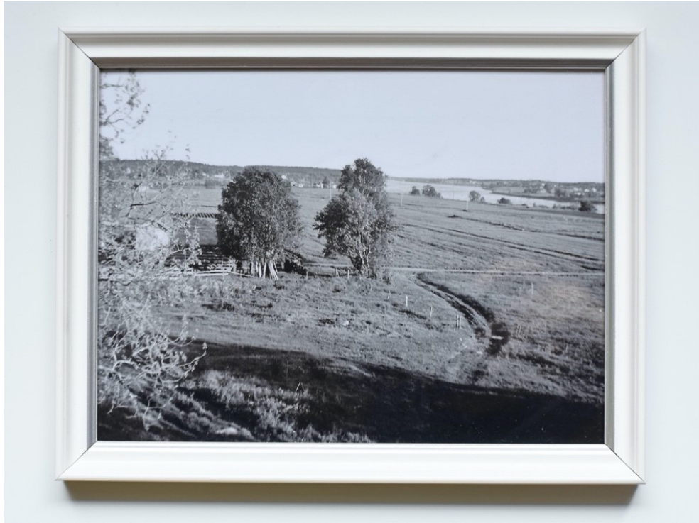
Kuva 23. Maisema Hastin tilalta. 1960.