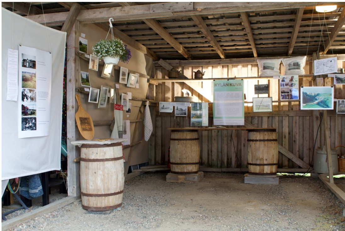
Kuva 31. Näyttelyssä eri tekniikoin toteutetut teokset ja vanhat käyttöesineet muodostivat monitasoisen kokonaisuuden.