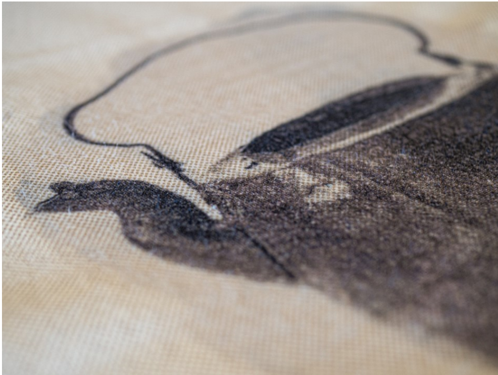
Kuva 11. Ämmän kahvipannu. Sinikka Kiurujoen toteuttama kuvansiirto kuvaamastaan kahvipannusta esiliinaan.