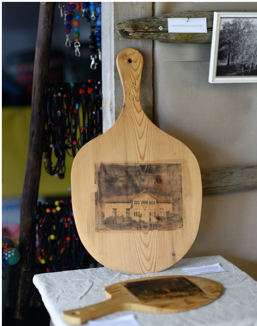
Kuva 26. Kaisa Lahden toteuttama kuvansiirto Lauri Pesolan tekemään leipälapioon. Leipälapiota on käytetty kuvassa olevassa Lahden talossa rieskan paistossa. Albumikuvat saavat kuvansiirron kautta uusia mer-

Uudelleen valokuvauksen lisäksi kuvansiirrot olivat keskeinen taidetoiminnan tekniikka. Lisäksi muutamat osallistujat valokuvasivat Ylipaakkolantien alueeseen, maatalouteen ja arkeen liittyviä vanhoja esineitä tai toivat niitä kuvattaviksi. Osa näistä kuvatuista esineistä siirrettiin kuvansiirtona esimerkiksi kankaalle. Toteutimme kuvansiirtoja lopulta kahdella eri menetelmällä (ks. liite 4). Kuvansiirroissa korostui käsillä tekeminen ja toiminallisuus, sekä erilaiset materiaalit, joille kuvia siirrettiin. Materiaalit toivat kuville uusia merkityksiä, kuten esimerkiksi Kaisa Lahden (ks. kuva 26) ja Helena Keskitalon (ks. kuvat 27 ja 28) teoksissa.