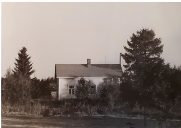
Kuva 18. Lahden talo. 1997.