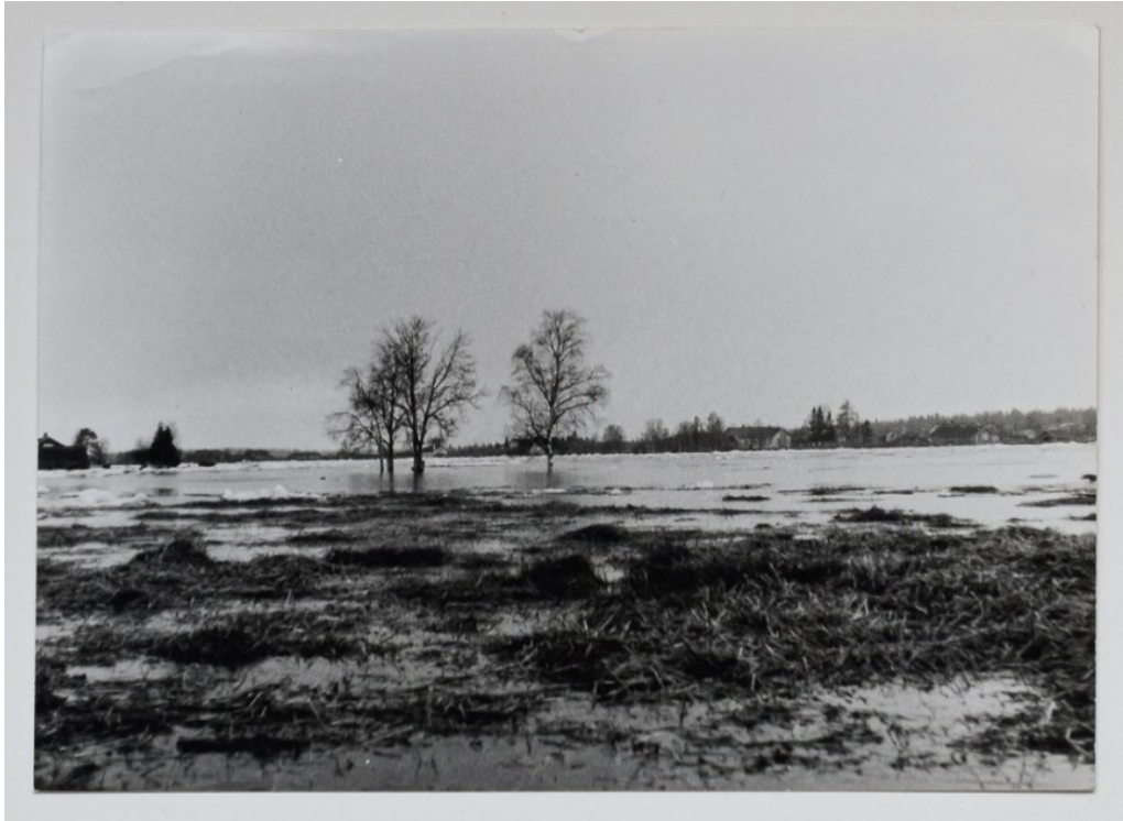
Kuva 6. Jokinäkymän muutosta. Kuva: Aarno Ollitervo, 1974, Hannus