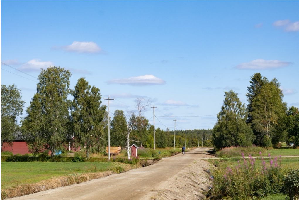
Kuva 1. Näkymä Ylipaakkolantieltä.