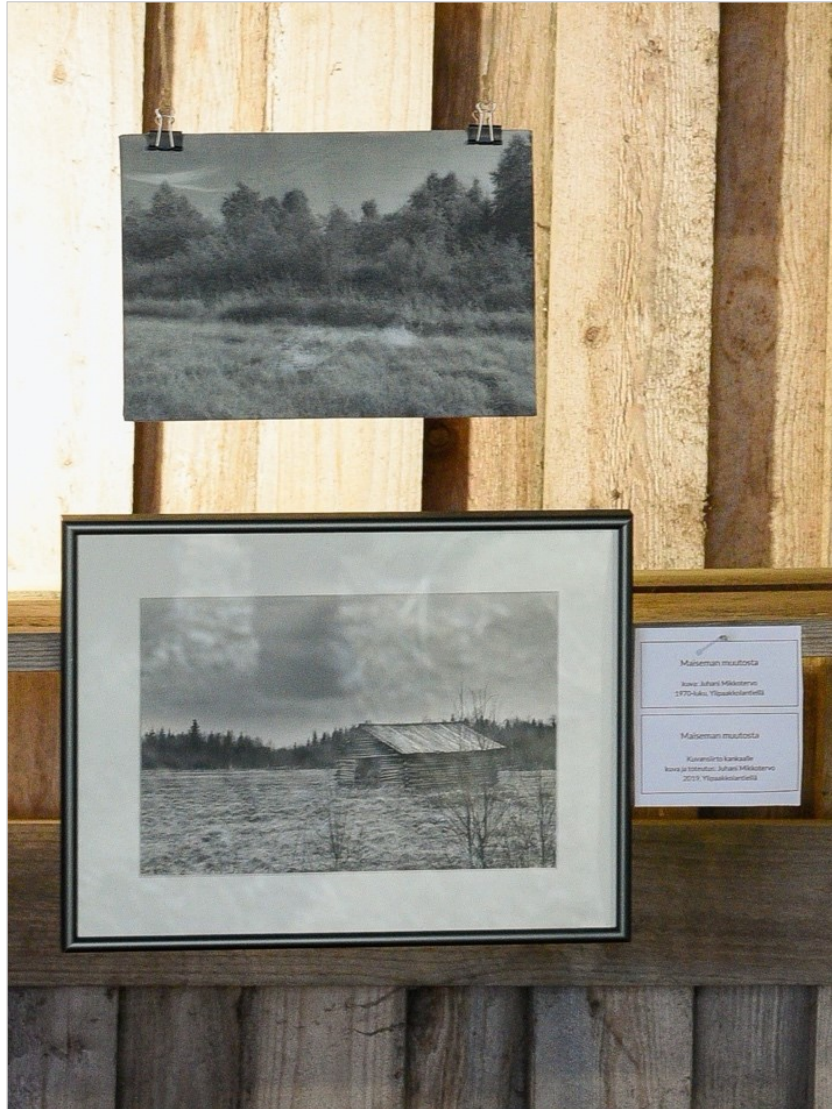
Kuva 21. Maiseman muutosta. Sama näkymä Ylipaakkolantiellä vuosina 1970 (alhaalla) ja 2019 (ylhäällä).

Valokuvaa katsoessa voi syntyä nostalginen halun palata menneisyyteen, jota ei kuitenkaan enää sellaisenaan voida saavuttaa (Mäkiranta, 2008, s. 153.)