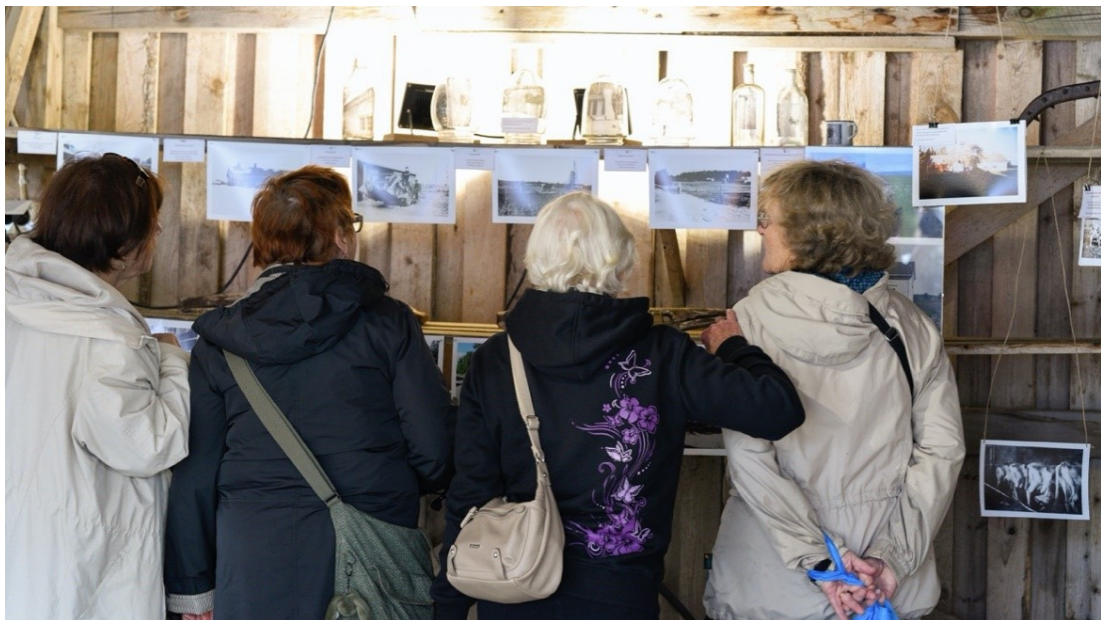
Kuva 36. Näyttely herätti keskustelua ja houkutteli muistelemaan.