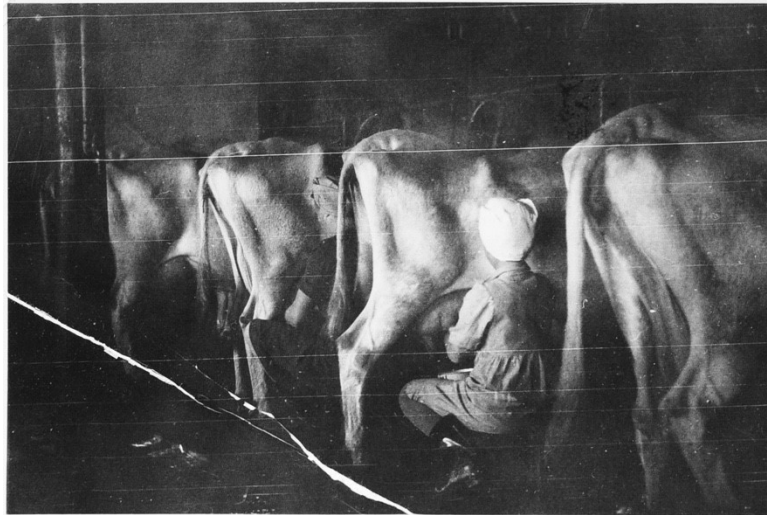
Kuva 16. 1950-luvulla käsilypsyä. Pesolan tila.