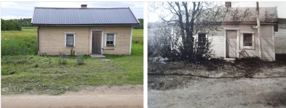
Kuva 25. Alatalon sauna. 2019 (vas.) 1950-luvulla (oik.)

Toiminnassa valokuvaa käytettiin välineenä uuden luomisessa (ks. taulukko 2). Uutta luotiin valokuvaamisen ja kuvansiirtojen kautta ja niistä syntyneet teokset asetettiin esille näyttelyssä. Valokuvaamisen menetelmäksi valitsimme uudelleenvalokuvauksen (re-photography), jossa rinnastetaan uusia ja vanhoja valokuvia. Menetelmässä käytetään vanhaa kuvaa uuden kuvan ‘muottina’ ja pyritään toisintamaan kuvakulma ja sommitelma, jolloin voidaan tarkastella ja tuoda näkyväksi kuvatun kohteen muutoksia tai muuttumattomuutta (ks. kuva 25). Tätä menetelmää on käytetty myös esimerkiksi Suomen valokuvataiteen museon Vuosaari eilen ja tänään -valokuvatyöpajassa. Kahtena eri päivänä toteutetussa valokuvatyöpajassa Vuosaaren historia ja nykypäivä rinnastettiin ennen-jälkeen -valokuvaparien kautta. Työpaja oli osa laajempaa, vuosina 2016–2018 toteutettua Vuosaari – toisin sanoen -hanketta. Hankkeessa toteutettiin muun muassa osallistavia taidetyöpajoja ja kaupunki- ja kylätapahtumia. Hanke sai jatkoa vuosille 2019-2021 nimellä Vuosaari 21 . (Suomen valokuvataiteen museo.)