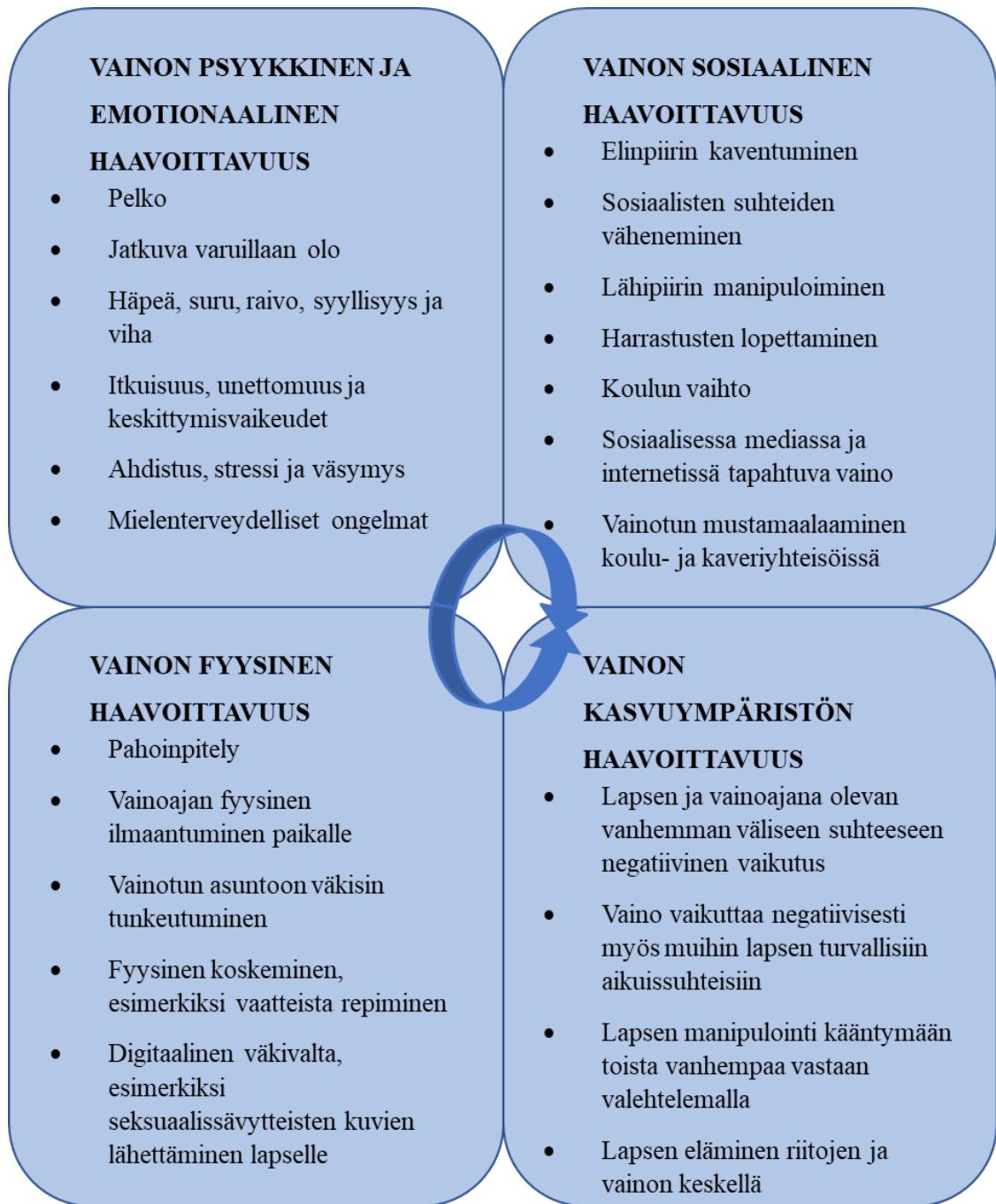
Kuvio 5. Vainon haavoittavia osa-alueita lapsuudessa.

Tutkimusaineistosta esiin nousseet (kuvio 5) vainon haavoittavuuden eri muodot ja lapsen elämän eri osa-alueet vaikuttavat toinen toisiinsa. Vainon haavoittavuuden eri osa-alueet voivat painottua vainoamisen aikana eri tavoin. Vainon psyykkisellä ja emotionaalilla, sosiaalisella sekä fyysisellä haavoittavuudella on vaikutusta kasvuympäristön haavoittavuuteen.