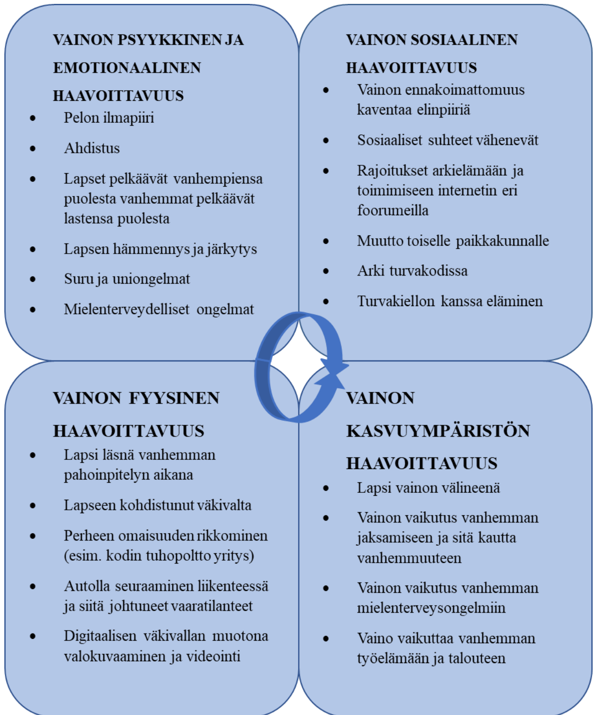
Kuvio 6. Vainon haavoittavia osa-alueita lapsen lapsen vanhemman kautta.

Vainon haavoittavuus ilmenee samankaltaisena lapsen elämässä, oli lapsi sitten suoraan vainon kohteena tai välillisesti vanhemman kautta (kuvio 6). Myös tässä kategoriassa vainon psyykkisellä ja emotionaalilla, sosiaalisella sekä fyysisellä haavoittavuudella oli