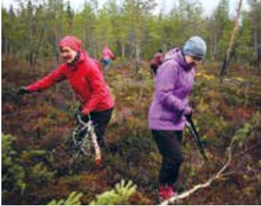
Jaloiksi valittiin vaaleimmat koivun rungot. Tummempien sävyjen aikaansaamiseksi käytettiin myös puista pudonneita, jo osin maatuneita lehtiä.