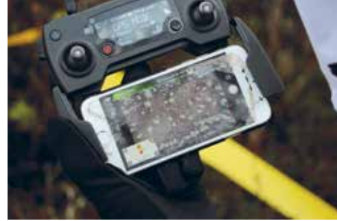
Dronella tarkistettiin, että riistanauhalla piirretty muoto vastaa tavoiteltua.