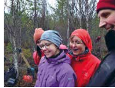
Maan tasalta oli vaikea hahmottaa, mitä olimme saaneet aikaiseksi. Ihastus olikin suurta, kun drone saatiin lopuksi ilmaan ja teos paljastui tekijöilleen.