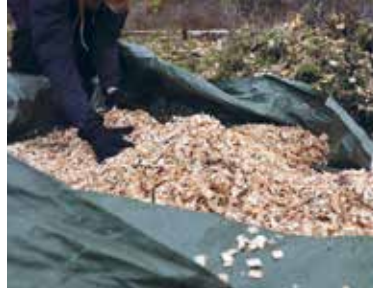
Työpajan osallistujat kuljettivat suolle kaadettuja rankoja hakettimelle, jolla tehtiin eri sävyistä materiaalia maataiteen eri kohtiin, tummempaa sekahaketta ja havutonta täysin vaaleaa haketta. Kuva: Nina Luostarinen, 2021.