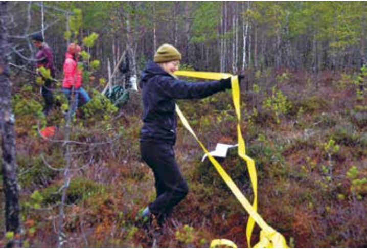
Liron hahmo piirrettiin riistanauhalla suohon luonnoksen pohjalta.