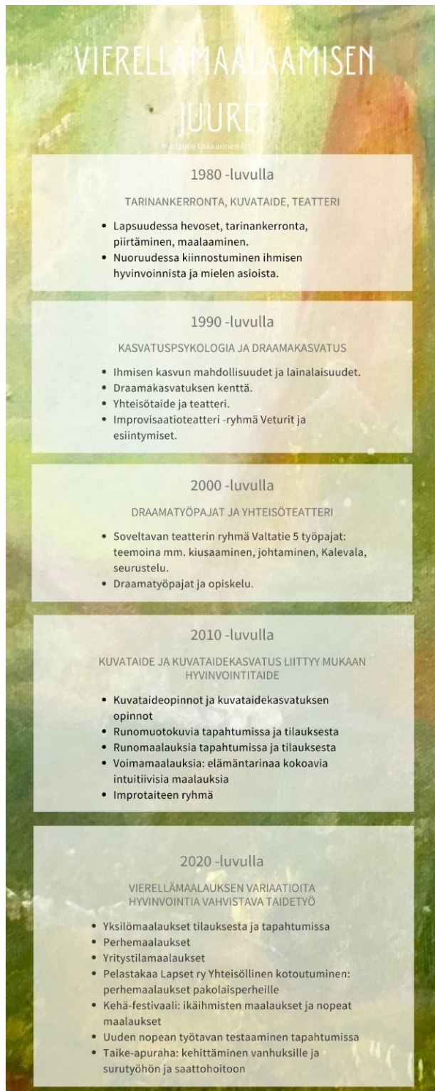
Kuvio 3. Kehittämistyöni juuret.

sisimmän vahvistumiseen taideperustaisessa työskentelyssä. Tämän rinnalla olen kehittänyt aktiivisesti vierellämaalaamisen variaatioita ja tapoja.