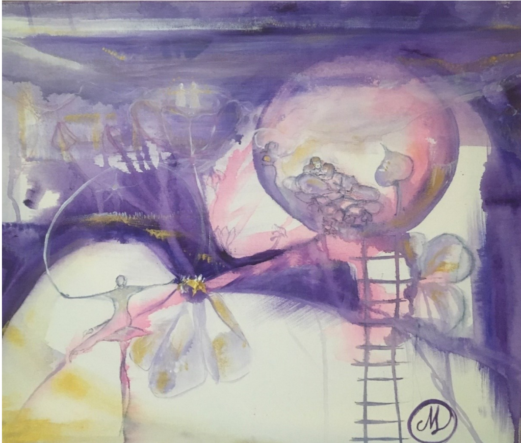
Kuva 7. Vierellämaalaus kiireistä työtä tekeväälle hoitoalan ihmiselle.

Kiireen tunteessa katse asettuu levollisena istuvan naisen olemukseen. Hän pitää kiireen kukkasta kädessään. Hän määrää elämänsä rytmiä, luottaa ettei kiire haittaa, hän voi silti tehdä hoitotyönsä levollisesti. Välillä hän ottaa itselleen aikaa ja kiipeää tikapuita lepopaikkaansa, niiden asioiden äärelle, joista hän latautuu. Kuvapinnalla kulkeva katse aktivoi työkalun ja hän käyttää sitä. (Tutkijapäiväkirja. Lukkarinen, 2022)