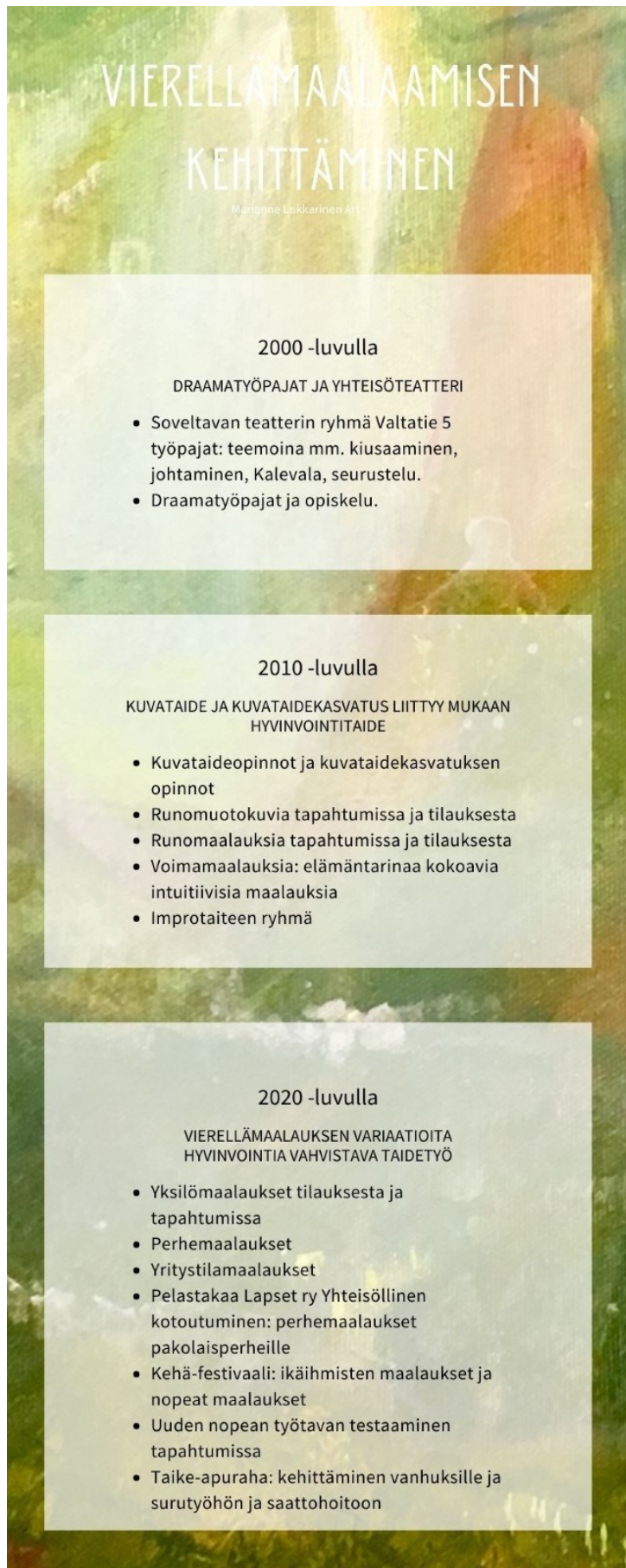
Kuvio 5. Vierellämaalaamisen kehittämistyön aineistoa.