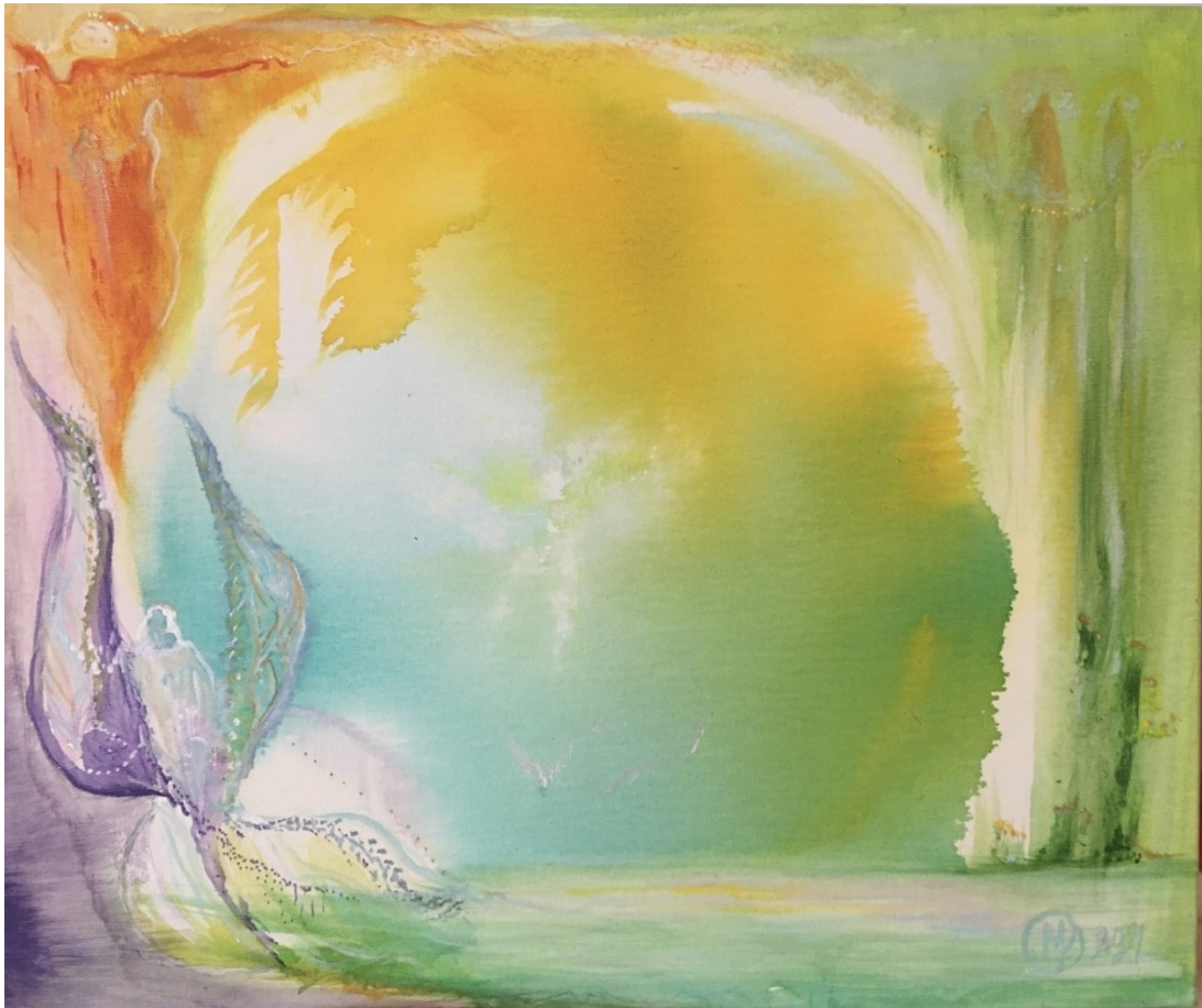
Kuva 8. Leikillisyyden ja ilon virtaamisen teeman äärellä syntynyt vierellämaalaus.

Yhdessäluomisen työkalu liittyy yhteiseen merkityksen antoon. Työkalujen maalaaminen ja symbolinen merkitseminen kuvapintaan vaatii selkeää kommunikointia maalattavan kanssa ja ei-tietävästä tilasta lähtevää kuuntelemista ja tunnustelua, jotta voimme jakaa yhteisen ymmärryksen maalaamisen ja työkalujen käyttämisen mahdollisuudesta. Taitelijan roolini kautta näytän leikin, improvisaation, intuitiivisen tekemisen ja kuvan synnyttämisen mahdollisuudet. Näytän myös sen, miten inhimillinen luova ihminen voi ja saa olla. Saan tehdä ensin ruman kuvan, jonka saatan harmoniseksi, koska minulla on taideväline käytössäni. Näytän taidekasvattajana, miten maalaamisen merkityksenanto syntyy ja miten sen symboliikkaa liitetään omaan kasvuun, luovuuteen ja sen merkityksiin. Näytän, miten taiteilijana synnyttämäni kuvalliset työkalut otetaan käyttöön arjessa taulun