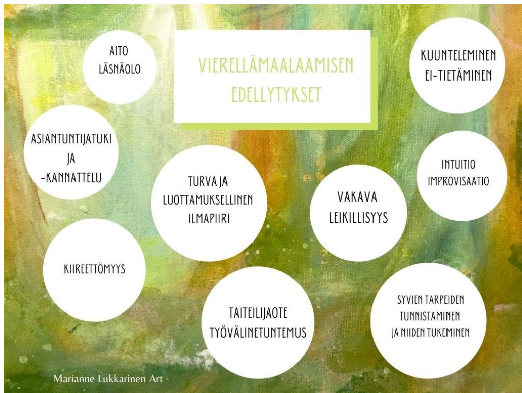
Kuvio 9. Vierellämalaamisen edellytykset.

Vierellämalaamisen edellytyksiä kokoava visualisointi kuviossa 9. kuvaa ne elementit, joita ilman maalaustilanne ei voi toteutua tarkoituksenmukaisena. Edellytykset nojaavat arvoihin, perustuvat kokemukseen sekä teoreettiseen perustaan maalaustapahtuman ilmiöistä.