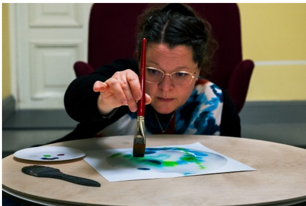
Kuva 11. Marianne.

Tuntuu niin kuin olisin istunut tovin toisten tutkijoiden kanssa hiljaisella leirinuotiolla kuunnellen lukeminani sanoina, mitä he ovat tehneet, miten he ovat työnsä tehneet. Toisella nuotion reunalla istuivat maalattavat ja toiset maalarit ja taiteen kanssa tekijät, joiden tekemistä olen hahmottanut. Nuotion ympärillä on tämä maailma, nämä yhteisöt, tämä yhteiskunta, se mikä meitä ympäröi. Se kaikki kutsuu meitä kohtaamaan, avaamaan yhteyttä ihmisten välille. Yhdellä nuotiopaikalla vielä hiljaisena sinä lukija. Toivon, että kuulen myös sinun mietteesi. Olisin halunnut jäädä kuuntelemaan nuotion ääreen vielä lisää, mutta aika ja tila on rajallista. Taiteella, leikillä ja luovuudella on sääntönsä ja rajansa, niin kuin tutkielmallakin. Tulee hetki, kun on aika lopettaa. Jotta voi taas jatkaa. Signeeraan tämän työn nyt tähän ja totean: tämä on minun tarinani. Vierellämaalamisen tarina. Kiitos kun kuljit tämän matkan kanssani.