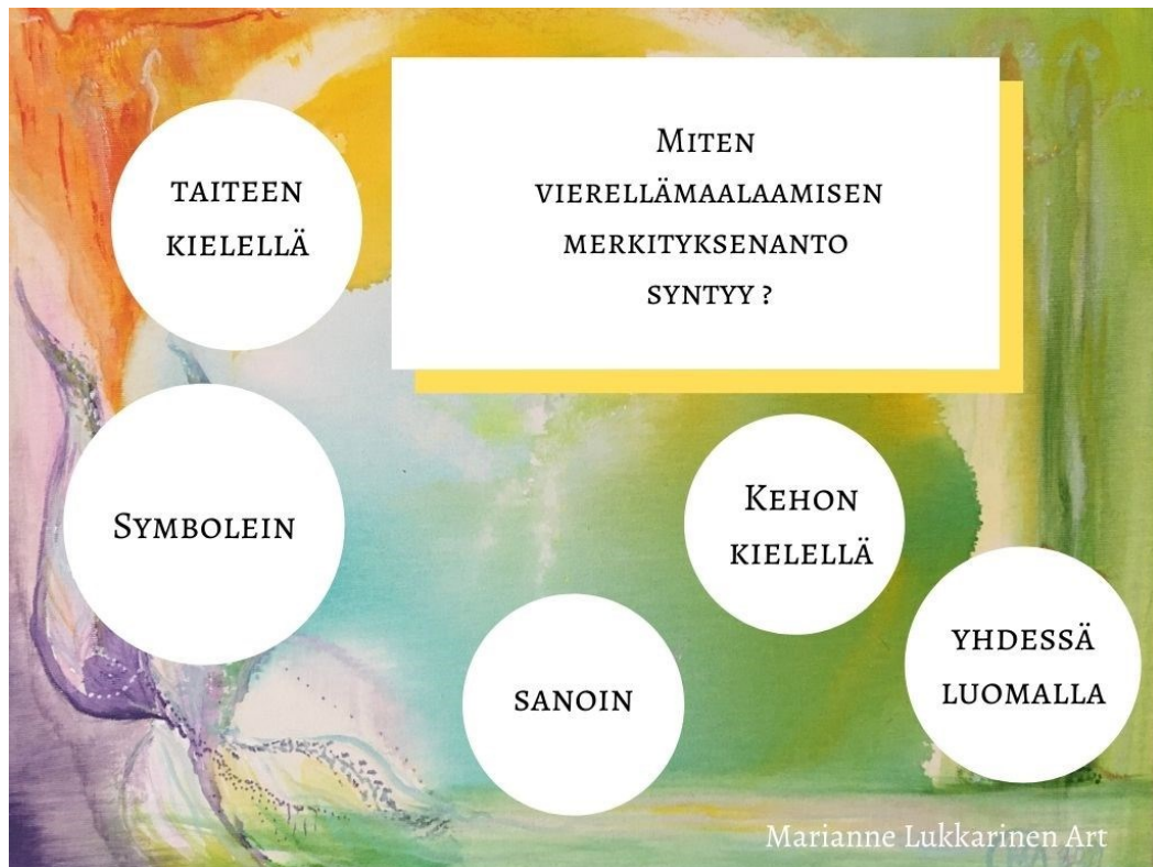
Kuvio 10. Merkityksenannon synty.

Vierellämaalaamisen tutkielman lopuksi tarkastelen merkityksenannon elementit. Katso kuvio 10. Merkityksenanto on se tapahtuma, jonka kautta vierellämaalaamisen henkilökohtainen kokemus syntyy sellaiseksi kuin se on. Kokemuksesta tulee oma ja se liittyy koettuihin tunteisiin. Merkityksenannolla taiteilija/taidekasvattaja pyrkii toiminnallaan herättämään maalattavassa/kohdattavassa ihmisessä niitä tunteita, joiden kautta hän voi muistaa itseään voimaannuttavia ja vahvistavia asioita. Se, millä hyväksynnän, turvallisuuden ja kuulluksi tulemisen tunnetta vahvistetaan, on kaikki edellä kuvaamani työvälineistö ja menetelmän elementit. Nämä tunteet ovat eräänlainen kanava merkityksenannon kiinnittymiselle ihmisen sisimpään.