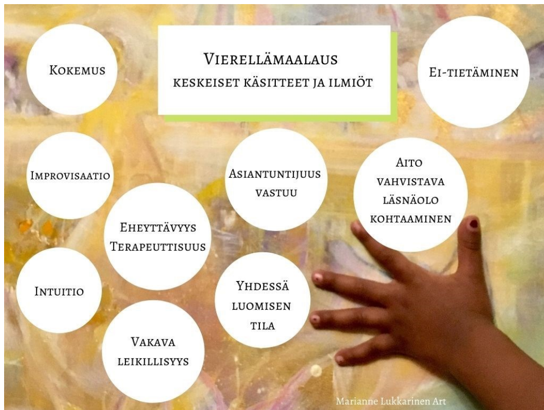
Kuvio 4. Vierellämaalaamisen keskeiset käsitteet ja ilmiöt.

Tässä luvussa luon teoreettinen tarkastelun vierellämaalaamisen ilmiöihin, jotka olen koonnut kuvioon 4. Etenen tarkastelemalla ensin hyvinvointia vahvistavan taidetyön kenttää ja omalle työskentelylle samankaltaista toimintaa sekä koko alan tärkeitä tutkimuksia.