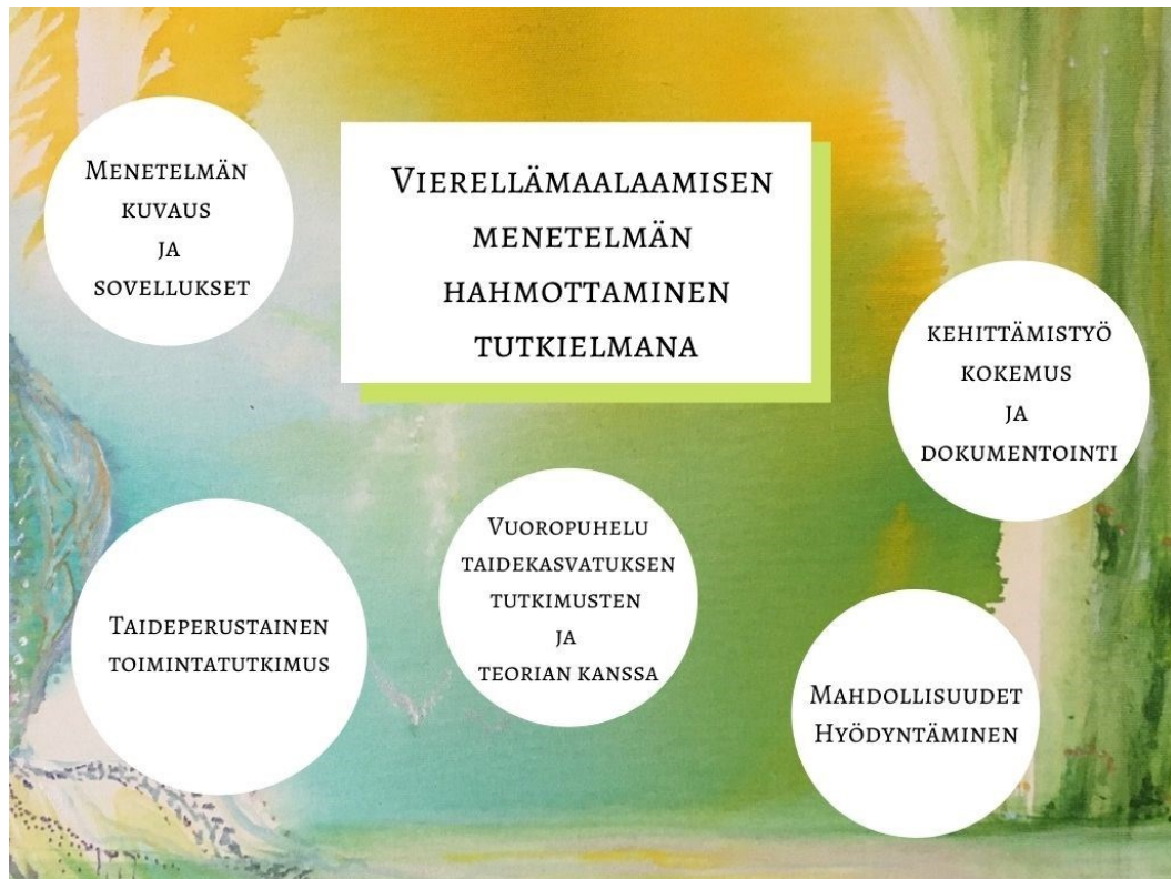
Kuvio 2. Vierellämaalaamisen opinnäytteen elementit

Tutkielma etenee vierellämaalauksen määrittämisen ja tutkimusasetelman kautta sen taustateoriaan keskeisten käsitteiden ja ilmiöiden kautta. Maalausprosessin tarkempi kuvaus on tämän hetken kehittämistyön tulos ja se täydentyy vierellämaalaamisen työkaluominaisuuksien tarkastelulla sekä työn edellytysten mahdollisuuksien hahmottamisella. Havainnollistan tekstiä kuvioin, kuvin sekä tutkijapäiväkirjamerkinnein ja asiakaspalauttein. Kaikissa kuvioissa taustalla on ihmisten vierellä maalaamiani teoksia. Pyrin olemaan kokemusperäiselle aineistolleni kriittinen tutkimuksen validointia arvioivassa luvussa sekä tutkimuseettisiä kysymyksiä tarkastellessa. (mm. Hiltunen, 2009, s.80–81.; Kallio-Tavin, 2013; Känkänen, 2013; Jansson & Rantala, 2013)