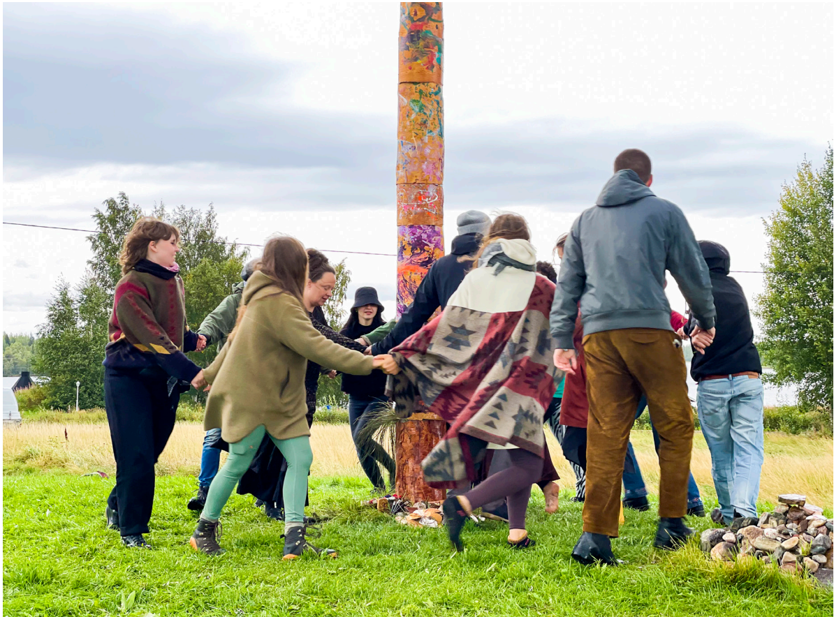
Esiäidit -performanssi käynnissä.

"Pohjoisen taiteilijat liikkuvat ketterästi taideperustaisen toiminnan, tapahtumatuotannon, luontosuhteen ja perinteen elävöittämisen sekä henkisyyttä ilmentävän taiteen piirissä"