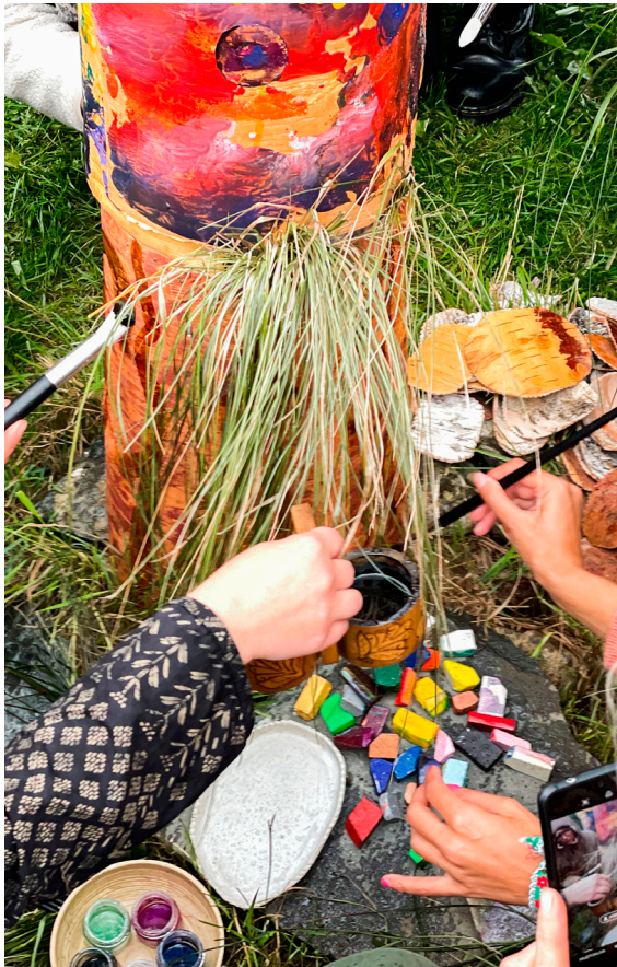
Tervajuurien maalaamista toteemin alapaneeliin performanssin rauhisemmassa vaiheessa.

”Taiteen ketteryys syntyi paikan ilmapiiriin eläytymällä sekä siitä kumpuavien perinteeseen sitoutuvien aiheiden soveltamisella taiteelliseen työskentelyyn.”