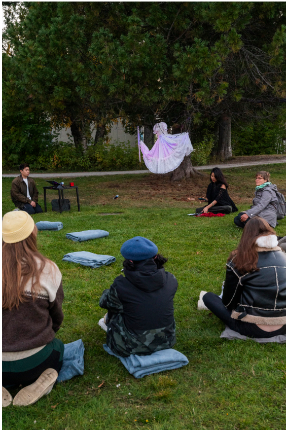
Hetki Saavu ja Lähde -performanssista. Kuva: Inka Holck, 2022.

”Teimme kokeiluja aiheen ja paikan sitomiseksi yhteen. Paikan välitön, aistinen kokeminen pysäyttää hetkeen. Tunteiden käsittely liittää nyt-hetken oman elämän virtaan.”