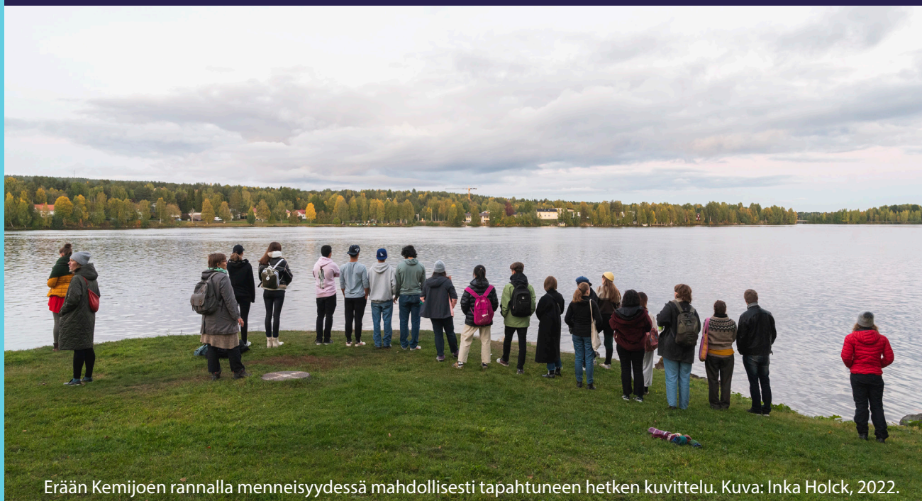
Erään Kemijoen rannalla menneisyydessä mahdollisesti tapahtuneen hetken kuvittelu.

Kemijoen rannalla, aivan ydinkeskustan läheisyydessä sijaitseva Sairaalanniemi on rovaniemeläisille tärkeä paikka. Sen tulevaisuutta on vuosina 2016-2022 hahmoteltu paljon keskustelua ja intohimoja herättäneessä kaavoitusprosessissa. Millaisen näkökulman paikkaan toivat Lapin yliopiston taideopiskelijat, joille Rovaniemi paikkakuntana ja Sairaalanniemi paikkana oli uusi ja todennäköisesti ohimenevä tuttavuus elämän virrassa? Arcta Fast -hanketaiteilijana ohjasin nopean, monitaiteisen ja paikkasidonnaisen Saavu ja lähde, Arriving and Leaving -teoksen valmistamisen Sairaalanniemelle Rovaniemellä järjestettyjen Kotiseutupäivien yhteyteen.