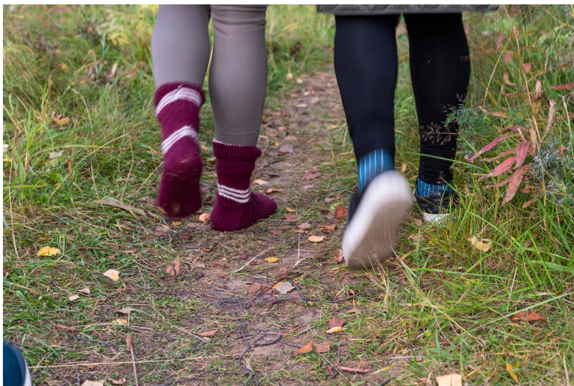
Yleisöä tutustumassa maastoon jalkapohjillaan. Kuva: Inka Holck, 202.2

leilla ja Piste Kollektiivin tapahtumissa, joissa olen osallistunut niihin tuottavana, kuratoivana ja taiteilijaosapuolena.