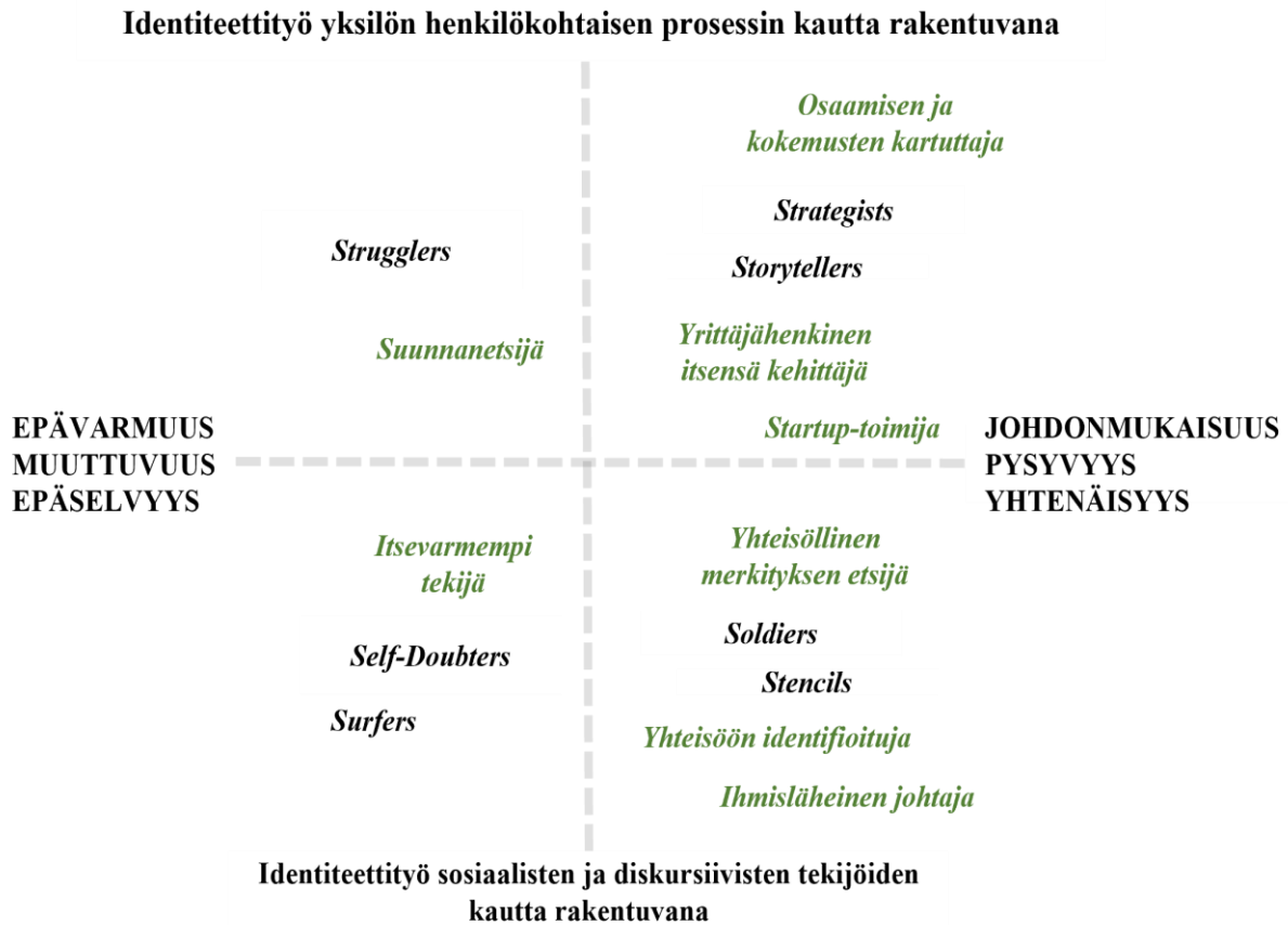
Taulukko 3: Alvesson (2010) Yksilön identiteetin rakentumisen nelikenttämatriisi.

identiteettityön tekeminen enemmän yksilön henkilökohtaisesti rakentuva prosessi vai rakentuuko identiteetti vahvemmin erilaisten sosiaalisten ja diskursiivisten tekijöiden kautta. Sen lisäksi matriisin kautta voidaan tarkastella sitä, onko identiteetti epävarma, muuttuva ja epäselvä vai enemmän johdonmukainen, pysyvä ja yhtenäinen. Alla oleva matriisi kuvaa tutkimustuloksissani esiintyneitä es-toimijoiden identiteettejä, joita on peilattu Alvessonin (2010) nelikenttämatriisiin ja hänen esittämiin identiteettikuvauksiin.