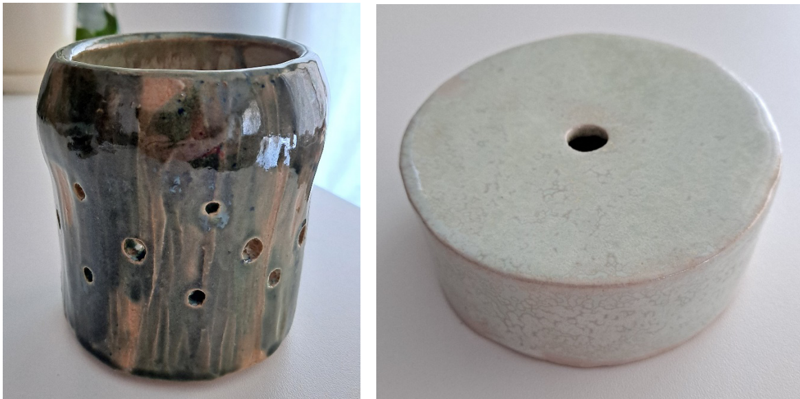
Kuva 2. Kahden harjoitustyöpajalaisen valmistamat kynttiläastia ja seinäkello (ilman koneistoa). Järjestin lasitusmahdollisuuden halukkaalle erikseen myöhemmin.