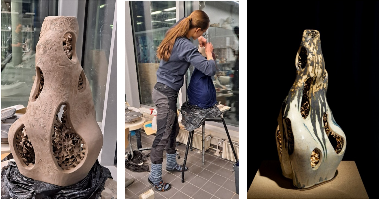
Kuva 1. Taiteellisen osion kolmas veistos Jännitysnäytelmä valmistusprosessissaan ja valmiina

Kolmen samantyyllisen veistoksen lisäksi toteutin vielä seinälle ripustettavan veistoksen, joka niin ikään muistutti muotokieleltään jäkälää tai levää.