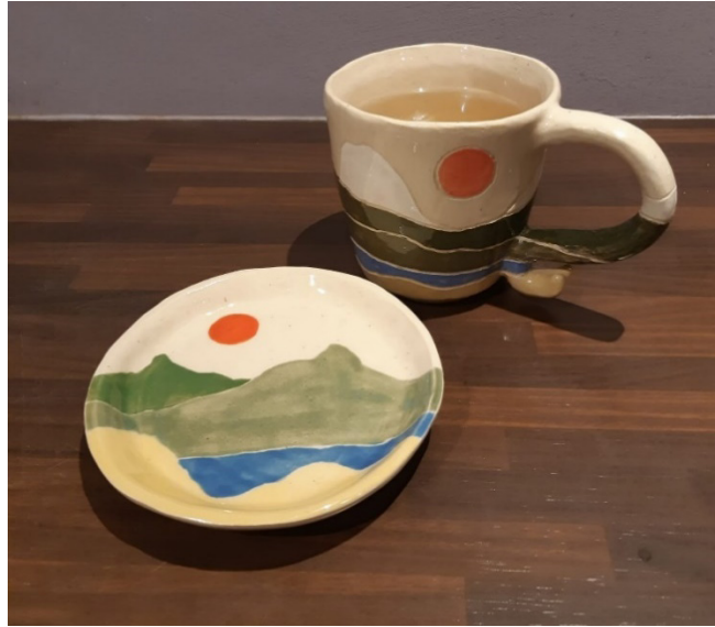
Kuva 4. A:n valmistama kannu ennen raakapolttoa sekä teekuppi ja lautanen valmiina. Lisäksi hän teki lintuveistoksen.