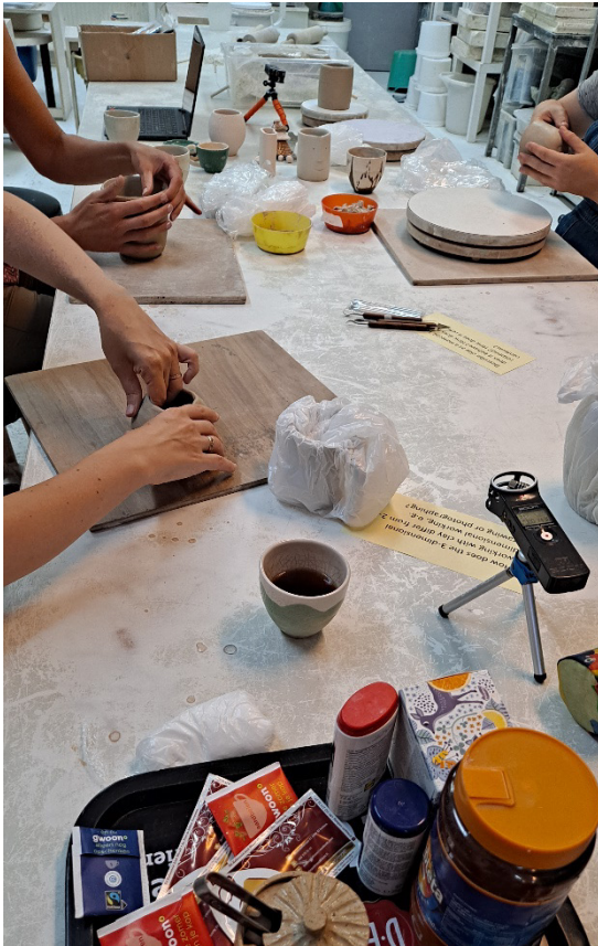
Kuva 1. Työskentelimme lähekkäin yhteisen suuren pöydän äärellä ja joimme kahvia ja teetä.

Savityöskentely on kurssikontekstissa aina myös sosiaalinen tapahtuma. Yhteisöllistä keramiikkaharrastusta käsitelleessä tutkimuksessa ystävystyminen ja sosiaalisten suhteiden luominen muiden harrastajien kanssa koettiin helpoksi (Genoe & Liechty, 2017, s. 98). Kuten pohdin luvussa 3 Kemskeen (2009, s. 341) viitaten, voi jaettu taktiilinen kokemus luoda yhteyksiä ihmisten välille. Alankomaissa keramiikkakurssin osallistujat eivät tunteneet toisiaan ennestään, mutta keskustelivat luontevasti jo ensimmäisellä kerralla, kertoen itsestään jopa merkittäviä terveyteen ja henkilökohtaiseen elämään liittyviä asioita. Läpi koko kurssin löytyi myös yhteisiä naurun aiheita. Uusiin ihmisiin tutustumista ei kuitenkaan erikseen mainittu erityisenä syynä harrastuksen aloittamiseen. Suomessa pidetyn harjoitustyöpajan osallistujat asettuivat pöytäryhmiin jo ennestään tuntemiensa osal-