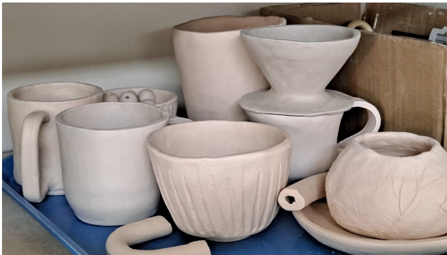
Kuva 5. Raakapollettuna neljä B:n valmistamaa astiaa, kahvisuodatin ja mobilen osia. Kaksi B:n kupeista ja kahvisuodatin ovat muualla tehtyjä. Lisäksi kuvassa on raakapollettuna kolme C:n kurssilla valmistamaa astiaa.

Taiteellisen osion aikana valmistamiani teoksia olen kuvaillut tarkemmin liitteessä 4 ja metodilukuni alaluvussa 4.2.3. Keramiikkakurssilaisille tein esimerkkikappaleiksi muun muassa raaputuskoristellun pienen kahvikupin ja -lautasen, ihmisen päätä esittävän pienen ruukun sekä kaksi erilaista tuulikelloa, joista vain toisen poltin keramiikaksi asti. Keramiikkakurssin aikana käsissäni muotoutui vielä kaksi erilaista mukia, joilla oli kasvot. Tein myös saippua-alustoja ja koristevadin, joissa yhdistin kahta eriväristä savea. Suhtauduin tekemiini esineisiin paitsi esimerkkeinä, myös mahdollisuutena kokeilla erilaisia tekniikoita ja ideoita.