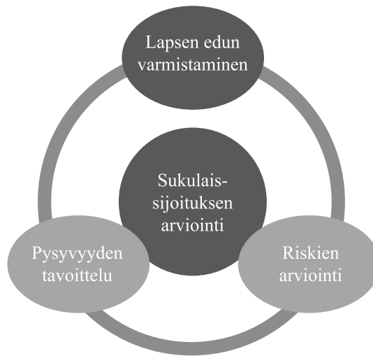
Kuvio 2. Sosiaalityöntekijöiden arviointityön keskeiset periaatteet

Sijaishuollosta päätettäessä ja lapsen tilannetta arvioidessa sosiaalityöntekijät tarkastelevat sijoitukseen liittyviä mahdollisia riskitekijöitä ja sijoituksen pysyvyyteen liittyviä näkökulmia. Pysyvyyden ja riskitekijöiden arviointi on tutkimusaineiston valossa paikoin suhteellista. Esimerkiksi suvun aikuisten ristiriitaiset suhteet voivat haastaa lapsen hyvinvointia ja sijoituksen pysyvyyttä, mutta sosiaalityöntekijät ovat valmiita työskentelemään niiden myönteisen kehittymisen suhteen, jotta lapsi pääsee sukulaissijoitukseen. Sosiaalityöntekijät kuvaavat aineistossa myös sellaisia riskejä, jossa lapsen hyvinvointi vaarantuu vakavasti eikä sijoitusta sukulaisperheeseen sen vuoksi voida tehdä.