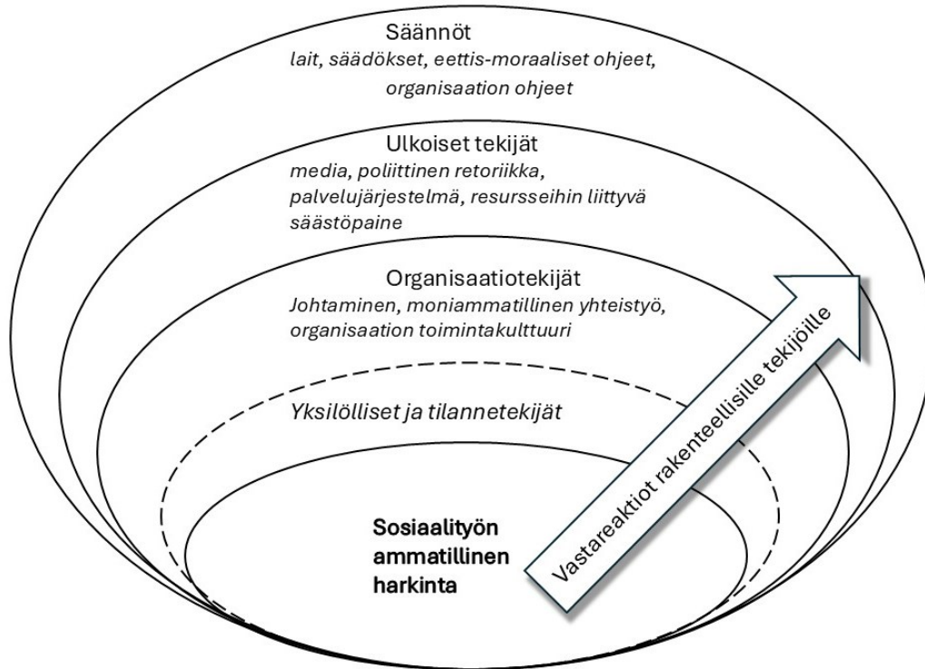
Kuva 2: Harkintavallan kannalta merkitykselliset tekijät

Teemoittelun jälkeen kokosimme ja kirjoitimme analyysin kautta muodostuneet pääteemat ja alateemat tulosluvuksi. Aineistoa läpi käydessämme meille muodostui mielikuva harkinnan kannalta merkityksellisistä tekijöistä ikään kuin kehinä, jotka ovat lähempänä ja etäämpänä yksittäisen sosiaalityöntekijän henkilökohtaisesta harkinnan tilasta. Kehät on kuvattu kuvassa 2 . Katkoviivalla on merkitty kehä, joka jää tämän tutkimuksen tarkastelun ulkopuolelle, mutta kuuluu olennaisesti ammatillisen harkinnan kokonaisuuteen. Kuvassa on esitettyä myös aineistosta noussut vastareaktioiden ilmiö, joka lähtee yksittäisestä ammattilaisesta ja nuolena leikkaa läpi kaikkien rakenteellisten tekijöiden. Nämä teemat avaamme luvussa 6.