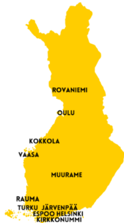
Kuva 1, Leoklubit Suomessa (Suomen leot 2025)

Olen itse mukana leotoiminnassa aktiivisesti, minkä vuoksi minulla oli mahdollisuus saada yhteys leoihin. Päätin lähettää jokaiselle 18–35-vuotiaalle leo ja leo-lionille sähköpostissa ja