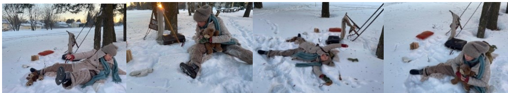
Kuvasarja 4. Otantoja törmäyksestä Kuvat: Elli Jaakonaho 2024

Elän keskellä mitä ihmeellisintä interaktiivista immersiota, jatkuvassa interventiotilassa liikuskelevaa taideteosta. Osin luon sitä itse ja saan kiittää omia valintojani, askelten tietoisuutta, mutta myös sattumuksia seuraamuksineen. Osin kaikki tapahtuu itsestäni ulkopuolisten voimien liikutellessa objekteja vailla tahdonalaista toimintakykyä, minuakin. Demonstroin lopulta itse maahantörmäyksen lumihankeen lavastaen sen kotipihallemme, ja tyttäreni kuvasi asetelman teoskuvaksi katalogia varten (kuvasarja 4).