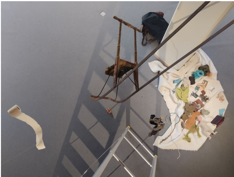
Kuva 7. Lintuperspektiivi ripustuksia purkaessa

Samoin itse leijuvasta potkurista (kuva 7) oli vaikea saada onnistumaan kuvaa. Joissakin taiteellisissa tutkimuksissa dokumentoinnille annetaan runsaasti painoarvoa. Luotan enemmän tilanteiden ainutkertaisuuteen, ja pelkään aina tuon ainutkertaisen häiriintyvän, ja flow-tilan katkeavan, silloin kun olen pakotettu ottamaan esimerkiksi työvaihekuvia keskellä työskentelyäni. Ryhmänäyttelyn kokoamisessa taas tulee vastaan muunlaisia paineita: käytettävissä olevan ajan rajallisuus, yhteiset työvälineet, vain kahdet tikkaat, yhteisöllisyys.