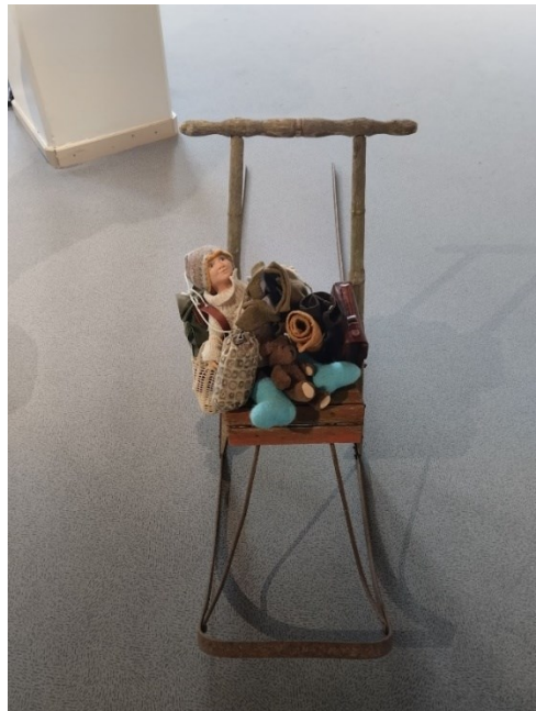
Kuva 2. Näyttelyn päätyttyä kokemuksia rikkaamana, täyteen lastattuna

Tällä tavoin, vähän keinotekoisesti kylläkin, sain luopumisen soviteltua työhöni mukaan. Itse asiassa myöhemmin mietiskellessäni, ymmärsin, kuinka syvällisesti ja monella tasolla luopuminen lopulta kuuluikin osaksi teostani. Tätä kaikkea en katso tarpeelliseksi selittää tässä auki, koska ajattelen näiden ajatusten sisältyvän nimenomaisesti teoksen tematiikkaan ja saavan näin jäädä teoksen kokijan tai kokeneen, tai näitä sanoja nyt lukevan ja teoksen väliseksi vuoropuheluksi. Keskityn päätutkimusteemaani, omilla käsilläni tekemiseen ja sen nostattamiin aistimuksiin ja tuntemuksiin.