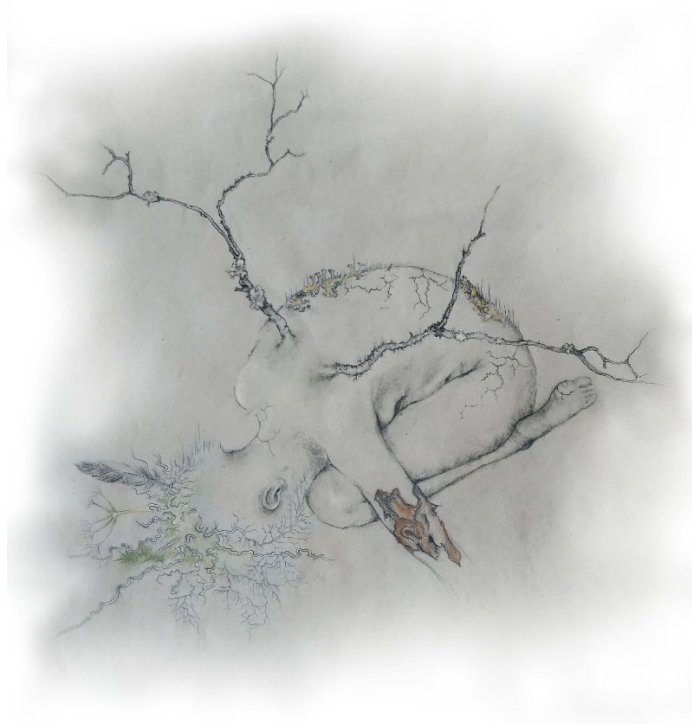
Kuva 1. Evolutio (o)n hajoaminen - Mikrokosmokset makrokosmoksissa, ihmisen kehossa jo monta pientä maailmaa Susanna Rauno, 2022, hiili, kuivapastelli, lyijykynä, tussi