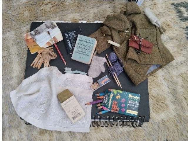
Kuva 6. Hujan hajan

Samoin itse leijuvasta potkurista (kuva 7) oli vaikea saada onnistumaan kuvaa. Joissakin taiteellisissa tutkimuksissa dokumentoinnille annetaan runsaasti painoarvoa. Luotan enemmän tilanteiden ainutkertaisuuteen, ja pelkään aina tuon ainutkertaisen häiriintyvän, ja flow-tilan katkeavan, silloin kun olen pakotettu ottamaan esimerkiksi työvaihekuvia keskellä työskentelyäni. Ryhmänäyttelyn kokoamisessa taas tulee vastaan muunlaisia paineita: käytettävissä olevan ajan rajallisuus, yhteiset työvälineet, vain kahdet tikkaat, yhteisöllisyys.