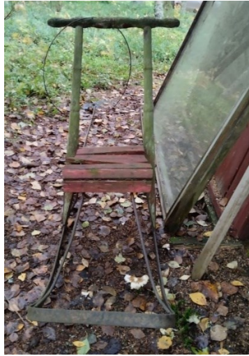
Kuva 1. Mökkiä talvituloille laittaessa kuvioihin mukaan potkutteli sammaloitunut potkuri.