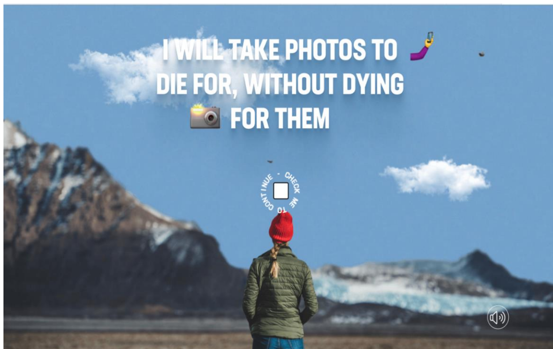
Kuva 2. The Icelandic Pledge. Haettu 23.10.2024 osoitteesta https://pledge.visiticeland.com

Myös Uusi-Seelanti on tuottanut vastuullisuusviestintää luomalla kestävän matkailun periaatteet maahan matkustaville keskittyen erityisesti eettisyyden näkökulmaan. The Tiaki Promise koostuu viidestä eri periaatteesta, joita klikkaamalla saa konkreettisia ohjeistuksia, miten toimia luontoa ja paikallisväestöä kohtaan kestävästi ja kunnioittavasti (kuva 3). Periaatteet on luotu huomioiden yleisimmät matkailijoiden käytöksestä syntyneet lieveilmiöt ja niiden seuraukset.