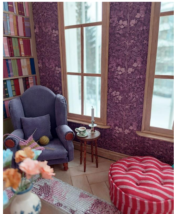
Kuva 12 Ikkunan äärellä oleva nojatuoli on ihanteellinen paikka kaivaa neulepuikot esiin tai uppoutua kirjahyllystä löytyvien romaanien pariin.