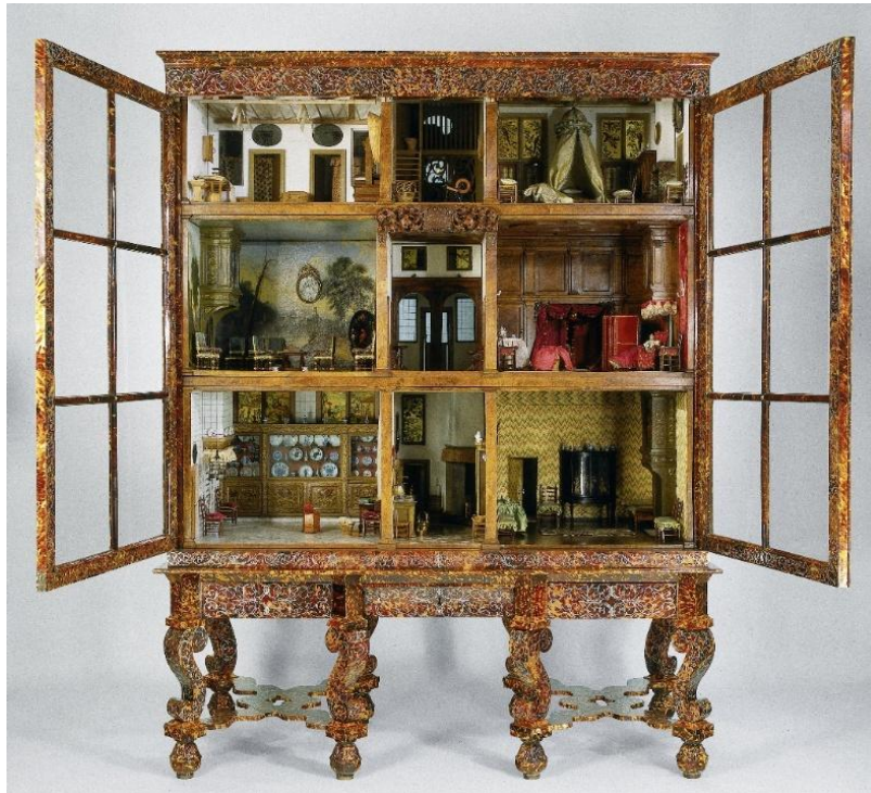
Kuva 1 Alankomaalainen nukkekaappi 1600–1700-lukujen vaihteesta. (Poppenhuis van Petronella Oortman, 2025)

1700-luvulle tultaessa nukketalot olivat vieläkin enimmäkseen rikkaan luokan edustuskalusteita. Ne olivat aikuisten makuun sopivilla, kalliilla ja harvinaisilla materiaaleilla sisustettuja ihastelun kohteita. 42 1700-luvun kuluessa nukkekodit alkoivat kuitenkin yleistyä, mikä mahdollisti niiden saatavuuden yhä laajemmille väestöluokille. Esimerkiksi Alankomaissa nukkekaapit tulivat laajemmin muotiin varallisuuden nousussa ja keskiluokan kasvaessa. Taidokkaiden ja kallisarvoisten miniatyyrien keräilyyn mahdollisti Hollannin kauppayhtiön toiminta Intiassa ja sen tuottamat voitot ja kaupankäynti. 43 Yleistymisensä myötä nukkekotien suosio aikuisten huikentelevina arvoesineinä oli laantumassa 1800-luvun alkupuolella. Nukketaloista tuli lapsille suunnattuja leikkivälineitä, ja laajentuvan tuotannon myötä niiden pyrkimys realismiin jäi taka-alalle. Esineiden valmistuksessa alettiin käyttää yhä käytännöllisempiä materiaaleja ja mittakaavan todenmukaisuuteen kiinnitettiin aiempaa vähemmän huomiota. 44