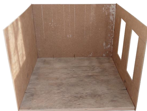
Kuva 4 Vielä tyhjillään oleva miniatyyrin aihio.

Miniatyryriprosessin alkuvaiheet muistuttivat suuresti tilasuunnittelun työskentelytapoja, joita olen omaksunut sisustusmuotoilun opinnoissani. Suhtauduin miniatyryriin kuin olisin suunnittelemassa sisustusta cottagecore-tyylistä unelmieni kotia varten, vain 1:12 mittakaavassa. Rakensin pienoismallia kotona, yksiöni nurkassa. Aloitin miniatyyrin työstämisen kiinteistä elementeistä, kuten lattialaudoista ja koristelijoista, jotta tilaa olisi helpompi hahmottaa. Jo työn alkuvaiheissa, kun sain tyhjään laatikkoon ensimmäisiä pintoja paikalleen, alkoi syntyä illuusio tavallisesta sisustusprojektista tavalliseen tilaan. Pieni laatikko, jossa oli lattia ja kolme seinää (kuva 4), muuttui nopeasti huoneeksi, joka oli täynnä mahdollisuuksia ja kutsui äärelleen jatkamaan tekemistä (kuva 5).