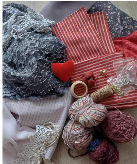
Kuva 8 Kirpputorilta hankittuja kierrätysmateriaaleja.