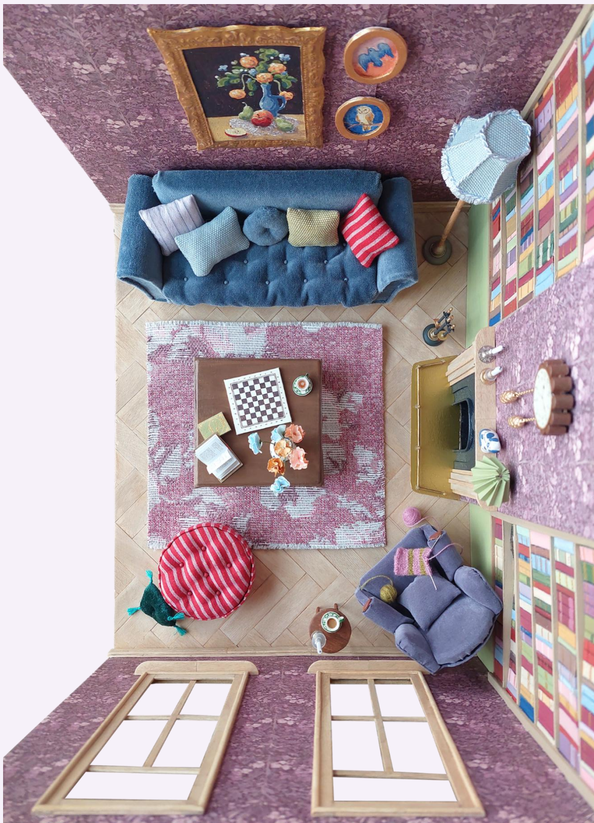
Liite 1 a – Yleiskuva miniatyyristä