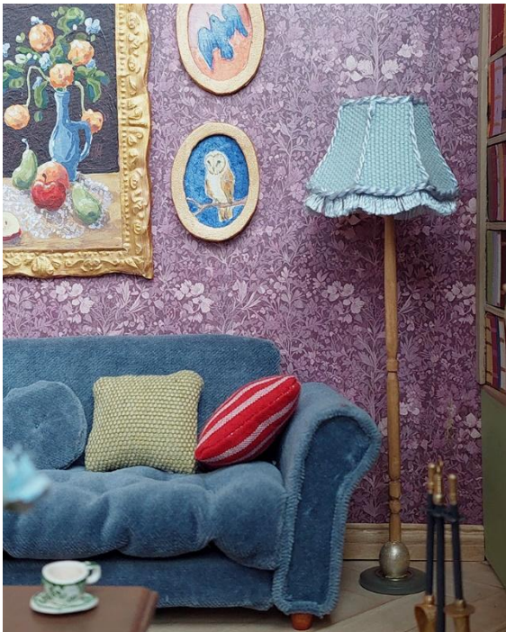
Kuva 11 Kotoisa sohvannurkka kutsuu istahtamaan alas ja rentoutumaan teekupillisen kera.

Vaikka tein miniatyyrin ikään kuin valmiiksi, ajattelen, että se voi vuosien varrella elää ja jatkaa muovautumistaan uusia ideoita saadessani tai makuni muuttuessa. Verratessa miniatyyrin sisustusta kotini sisustukseen niistä voi huomata paljon eroja, mutta myös paljon samaa. Niitä yhdistää mahdollisuus muokata tilaa. Sisustus on keino vaikuttaa oman kotinsa ilmeeseen ja tunnelmaan ja sama pätee miniatyyrisisustuksen rakentamiseen. Vaikka tilan toimivuus ei ole miniatyyreissä samalla tavalla keskiössä kuin se on kodin sisustuksessa, huomasin miniatyyrin realistista ilmettä tavoitellessani, että juuri pienet käytännölliset yksityiskohdat ovat niitä asioita, jotka herättivät miniatyyrin henkiin. (Kuvat 11 & 12)