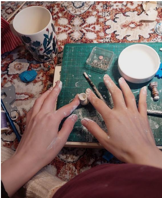
Kuva 7 Savesta valmistin pientä esineistöä kuten kuvassa tekeillä olevan maljakon. (Kuva: Iina Kihlström).

Lähdin aamulla metsästämään lisää materiaaleja kirpparilta. Kolusin kilotavarana myytäviä askartelu- ja käsityötarpeita, sekä muita tilpehöörejä vaikka kuinka kauan. Lopulta kangaspaloja ja paljon muuta löytyi yli kilon edestä. Laareja oli hauska penkoa miettien, mikä soveltuisi mihinkin tarkoitukseen. Työpäiväkirja 14.11.2024