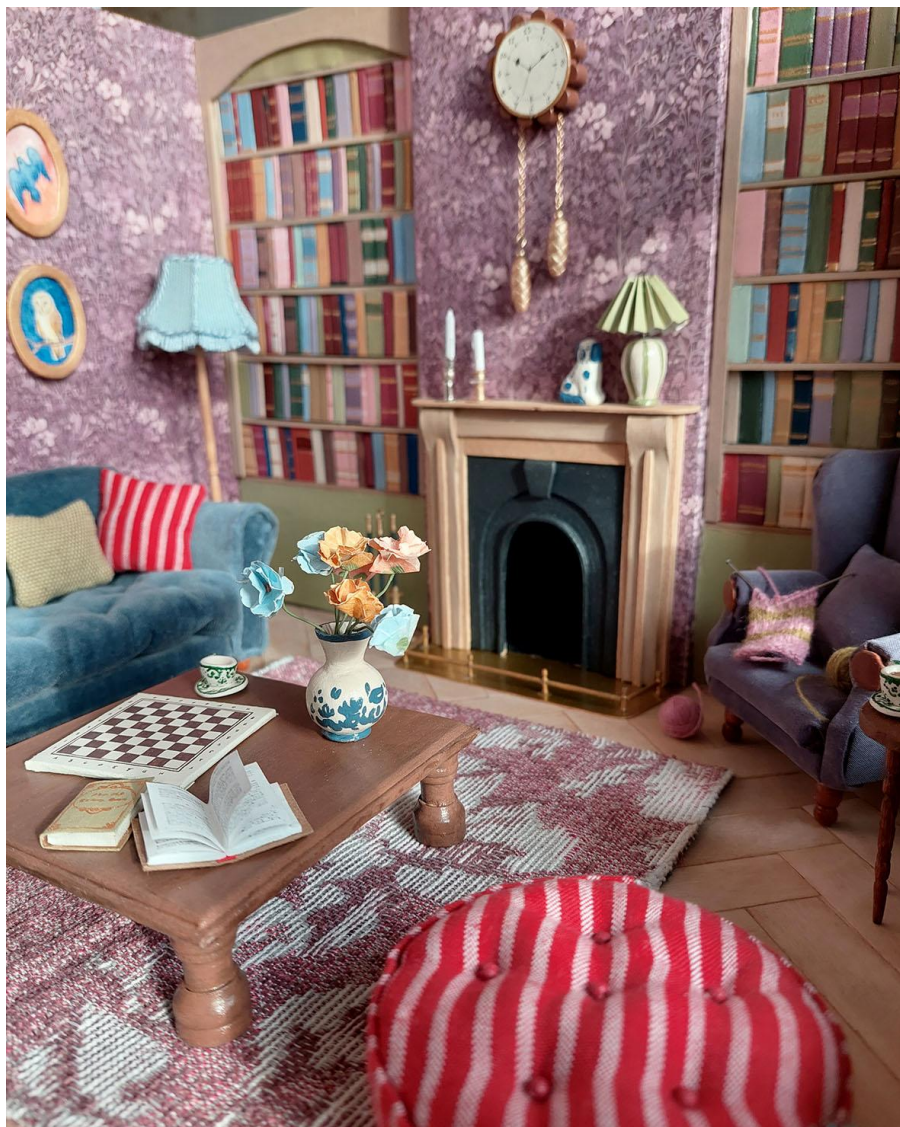
Kuva 13 Valmis miniatyyrihuone muodostaa oman pienen maailmansa ja tempaa mielikuvituksen mukaansa.

pienoismalleja museoissa. Niitä joudutaan katselemaan tietyltä etäisyydeltä, ehkä jopa lasin takaa tai television tai muun näytön välityksellä. Miniatyyrien hento olemus saa lähestymään niitä varoen ja yleensä niitä ei saa eikä edes pysty koskea. Kaikki tämä muuttuu, kun miniatyyri on oma ja omin käsin tehty. Koska tiedän, kuinka eri esineet on valmistettu, ja sen, ovatko ne helposti särkyviä tai korjattavia, käsittelen miniatyyriä tietyllä rentoudella. Voin tarkastella miniatyyriä mieleni mukaan sekä muokata sitä vapaasti. Tämä tarjoaa välittömän ja läheisen perspektiivin miniatyyriin. Miniatyyristä on muodostunut siis oma pieni maailmani. (Kuva 13)