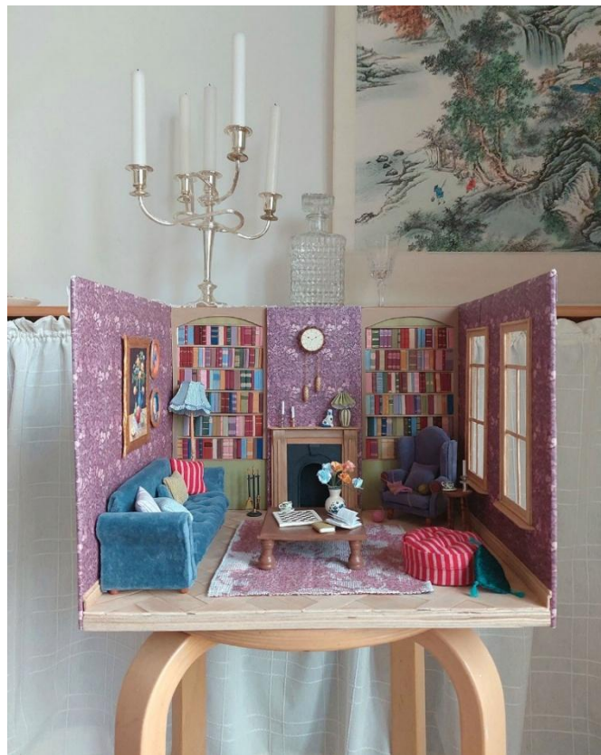
Kuva 10 Valmis miniatyyri kokonaisuudessaan.

Lopulta jäljellä oli enää kokonaisuuden kasaaminen. Päällystin seinät tulostamallani tapetilla ja maalasin pintoja ja esineitä viimeistelläkseni ne. Kokosin kirjahyllyt paikalleen, asettelin kalusteita ja valmistin viimeisiä yksityiskohtia, kuten maalauksia kehyksiin ja kukkia vaasiin. Lopulta työ oli valmis (kuva 10), tai ainakin tarpeeksi valmis tämän tutkielman tarkoituksia varten. Oli haastavaa osata lopettaa miniatyyrin parissa työskentely, sillä olisin aina keksinyt uutta lisättävää tai hienosäädettävää. Miniatyyrin yksityiskohtaisuus lisäsi tunnetta siitä, että parantelua ja viimeistelyä voisi jatkaa loputtomasti. Tiedostin kuitenkin, että tutkimuksen etenemisen kannalta minun oli osattava myös siirtyä eteenpäin ja hyväksyä miniatyyrin sellaisena, kuin siitä rajallisessa ajassa tuli.