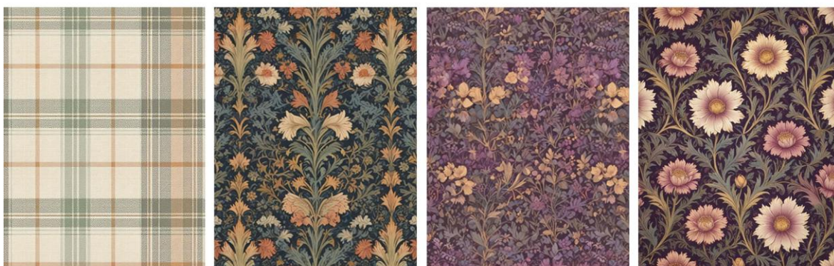
Kuva 6 Freepik -tekoälykuvageneraattorilla luotuja tapettivaihtoehtoja.

Ajan säästämiseksi sain ajatuksen kokeilla tekoälyllä toimivaa Freepik-kuvageneraattoria apuna tapetin luomisessa. Alun perin olisin halunnut suunnitella oman tapetin tilaan, mutta totesin sen olevan liian suuri tehtävä tämän projektin yhteydessä. Kuvageneraattorilla toistuvan tapettikuvion tuottaminen vaati kokeiluja erilaisilla komenoilla. Halusin myös tuottaa useita vaihtoehtoja, kukkakuvioista ruututapetteihin, jotta minulla olisi mahdollisuus testaila, mikä kuvioaihe istuisi parhaiten tavoittelemaani cottagecore-tunnelmaan. (Kuva 6)