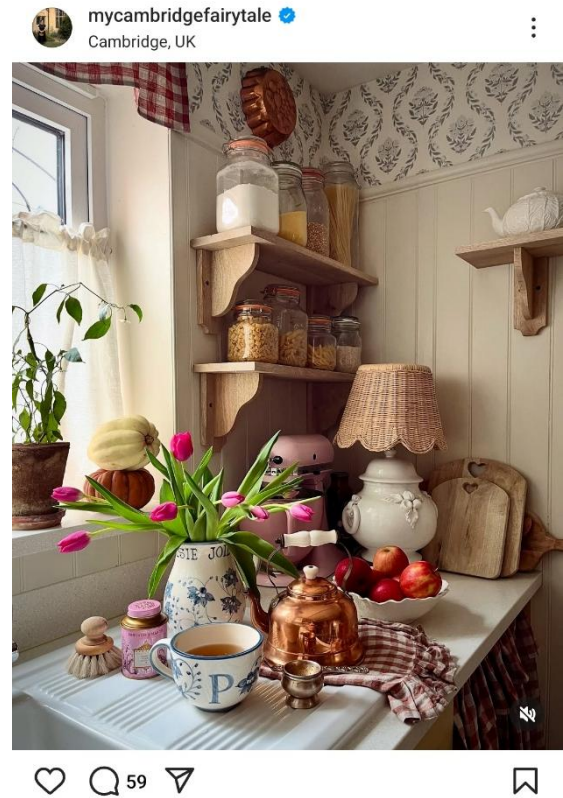
Kuvat 2 & 3 Instagramiin julkaistuja kuvia cottagecore-tyylisistä kodinsisustuksista.