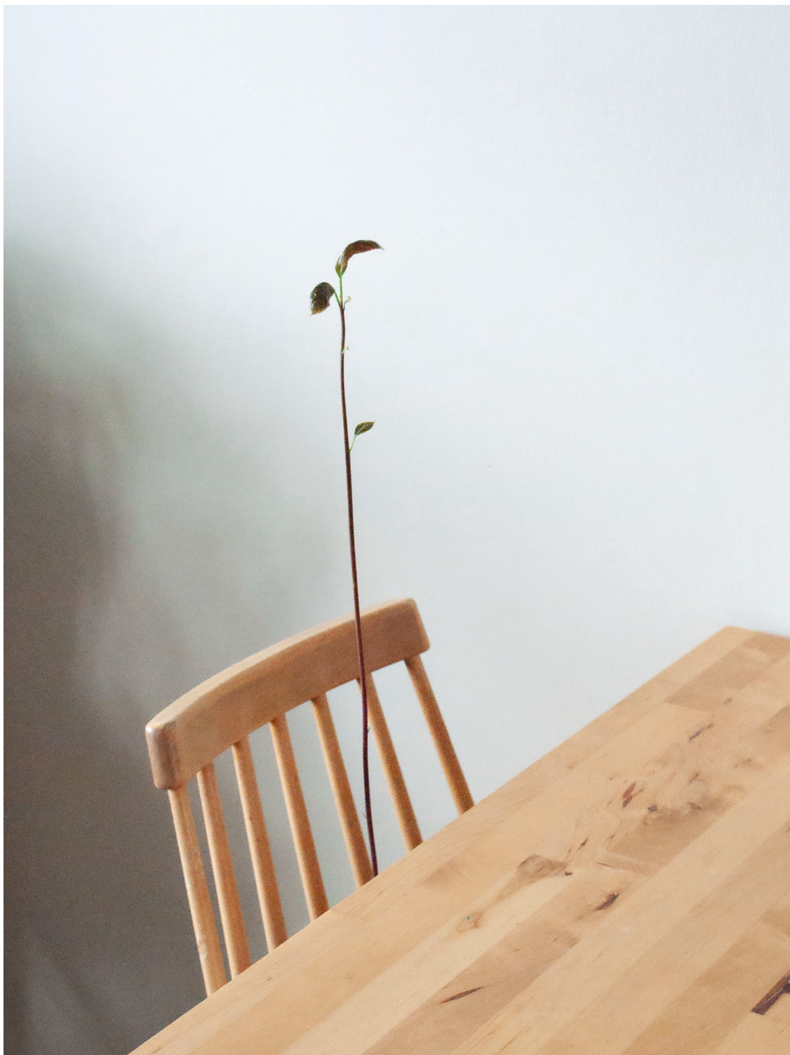
Kuva 3, 2021