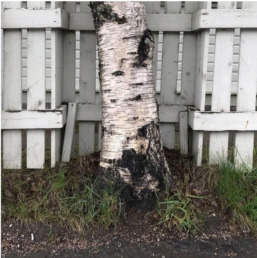
Kuva 9, 2020