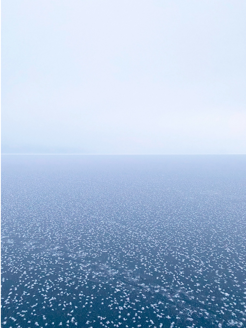
Kuva 10, 2022