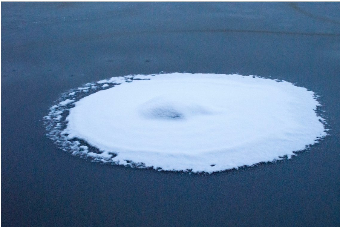
Kuva 14, 2021