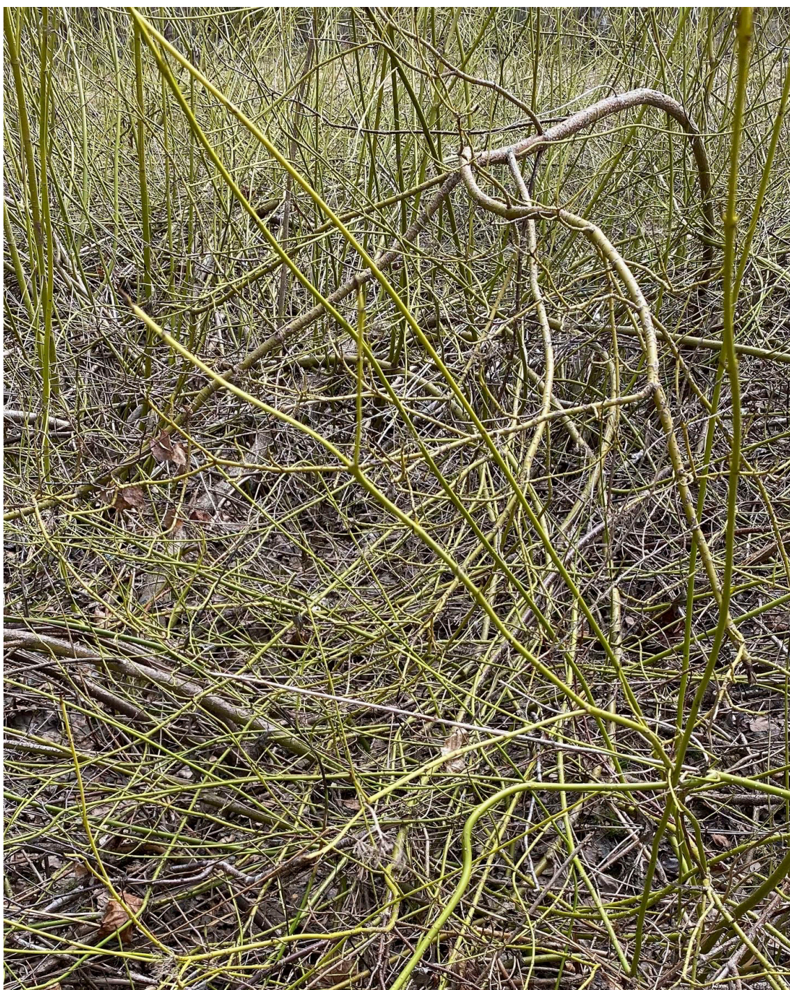
Kuva 5, 2022