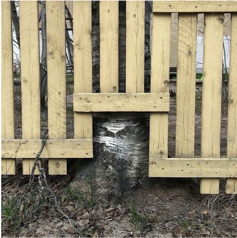
Kuva 8, 2020