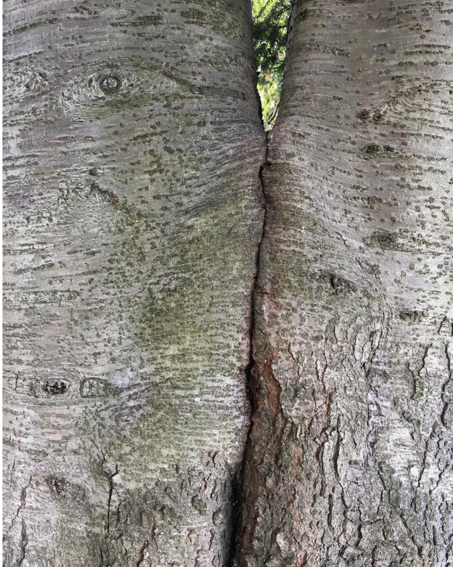
Kuva 12, 2019