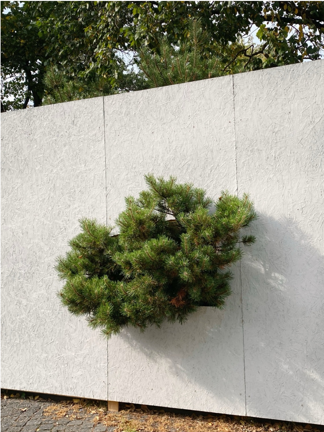
Kuva 4, 2022