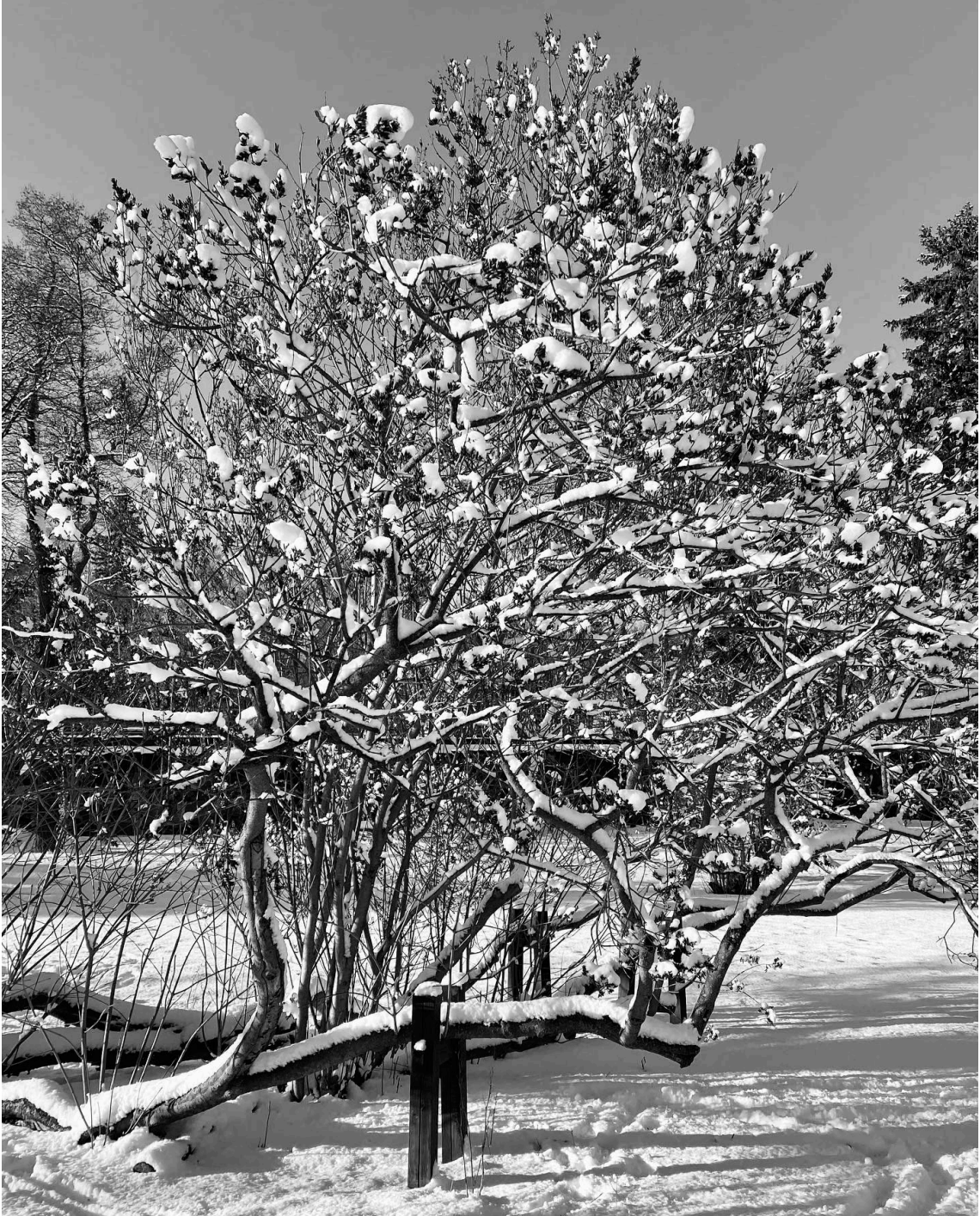
Kuva 6, 2023