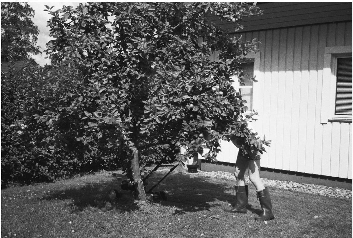
Kuva 1, 2020