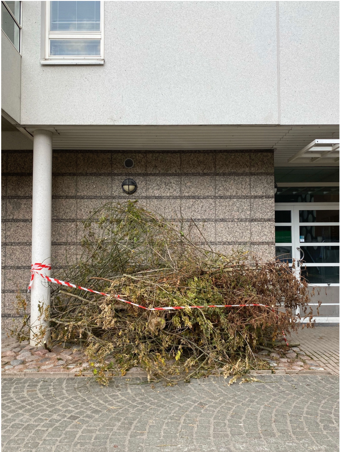
Kuva 13, 2022