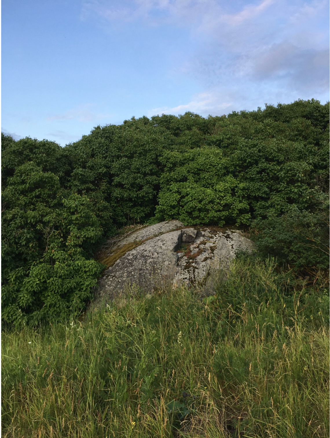
Kuva 11, 2019