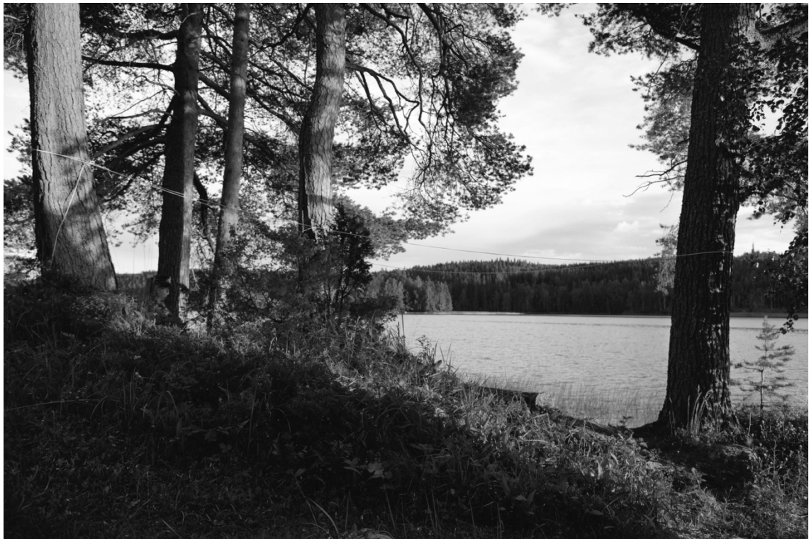
Kuva 2, 2020