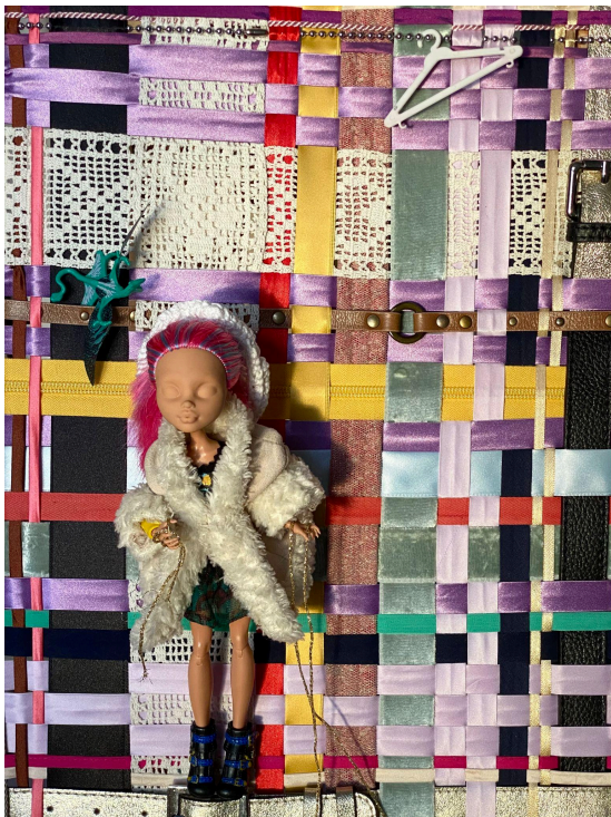
Kuva 3. Lähikuva teoksesta. kokonaisuudessaan.

Kaivellessani laatikoista nukelle vaatteita huomioni kiinnittyi pieneen valkoiseen henkariin. Kiinnitin sen teokseen roikkumaan metallinauhaan. Käteeni tipahti myös vihreä, pieni siivellinen olio. Se muistutti lohikäärmettä, joka ilmestyy minulle usein meditoidessani. Se tuntui kuuluvan teokseen, joten otin sen mukaan. Laitoin nukelle vielä kultaista lankaa käsiin. Avaan Aineiston analysointi -luvun yhteydessä lisää näiden elementtien merkityksestä.