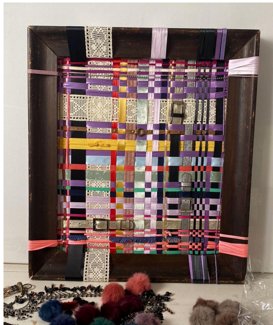
Kuva 1. Tekstiilitaideteos alkuvaiheessa. Kuva 2. Teoksen pinta ennen nukkea.

Teoksessa on käytetty paljon erilaisia materiaaleja kuten eri levyisiä silkki- ja samettinauhoja, puuvillanauhoja, tekonahkaisia vöitä solkineen, käsin virkattua pitsiä ja juhlapukujen ylijääneitä olkaimia. Mukana on myös metallista ketjua ja vetoketjua. Materiaalit on nidottu teoksen taakse. Osa nauhoista on kiedottu kehyspuun ympärille.