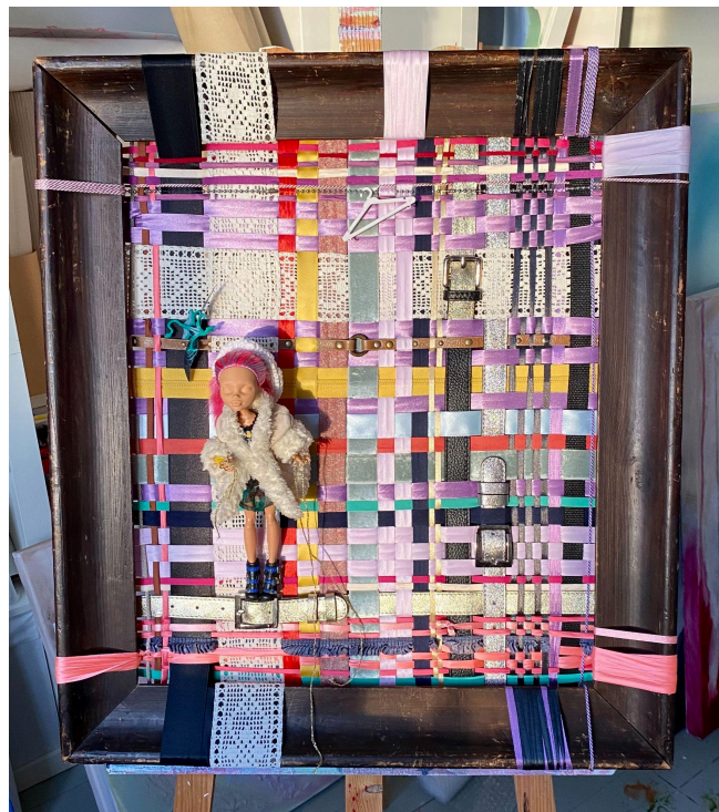
Kuva 4. Tekstiilitaideteos

Kuvassa 3. näkyy tarkemmin, että nukella on pinkki tukka, jossa on liiloja raitoja. Se on kiinnitetty taakse poninhännälle. Nuken päässä on virkattu hattu, joka muodostaa pään ympärille valkoisen kehyksen. Nukelle on puettu musta toppi ja mesh-kankaasta tehty hame. Sen päällä on muhkea villatakki, joka on solmittu vyötäröltä. Jalassa on rouheat,