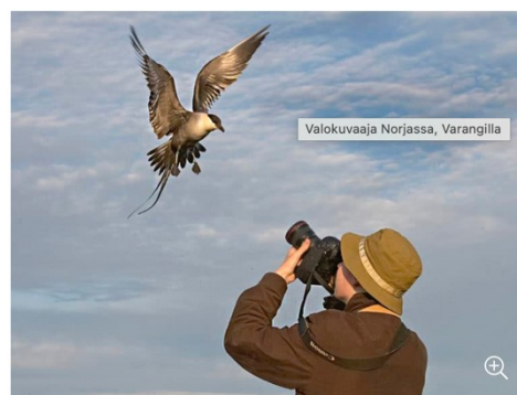
Kuva 2. Kuvankaappaus Finnature matkatoimiston finnature.fi kotisivuilta.

Rakennamme mielellämme myös juuri omiin tarpeisiisi räätälöidyn luontokuvausmatkan. Kerro meille toiveesi ja me hoidamme loput! Ota yhteyttä toimistoomme, jos haluat yksityismatkan, joka on suunniteltu juuri sinulle.