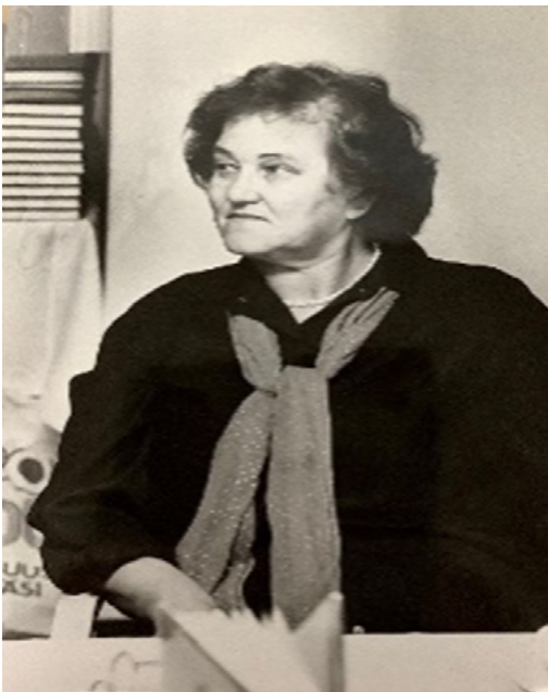
KUVA 10. Kirjailija Ritva Kariniemi