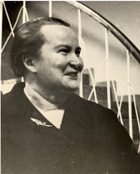
KUVA 5. Kirjailija Rauni Kivilinna

Rauni Kivilinna o. s. Herajärvi (1912–1993) oli yksi 1950–1960-lukujen pohjoisen tuotteliaimpia naiskirjailijoita, jonka tuotanto huomattiin ilmes-