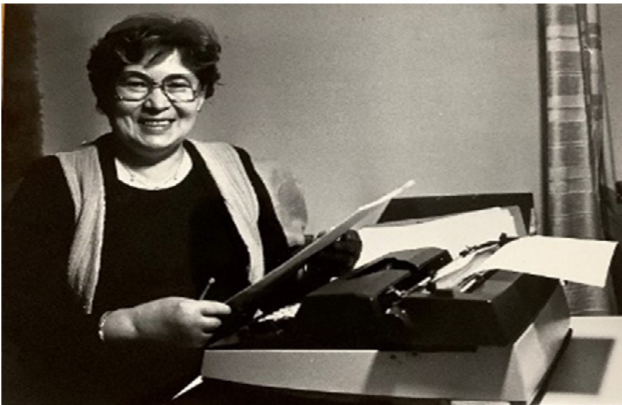
KUVA 7. Kirjailija Anja Tikkanen