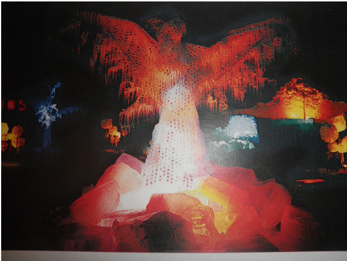
Kuva 1. Talvipuisto Kaukonlammella

Talvipuiston työmaalle oli keskikaupungilta matkaa lähes kymmenen kilometriä, joten paikan päällä käyntiin oli varattava aikaa. Tutustuin kummineuvojana puistotyömaahan tammikuun puolessa välissä. Käynnin syynä oli sekä henkilökohtainen kiinnostus että tarve nähdä olosuhteet ja opiskelijoiden mieliala. Seuraava käyntini olikin kutsuvierastilaisuus tammikuun lopussa. Nämä käyntikerat olivat myös tutkijan henkilökohtaisia interventioita ensimmäisen työmaan havainnointiin. Tuossa vaiheessa en ollut tutustunut vielä opiskelijoihin henkilökohtaisesti. 73