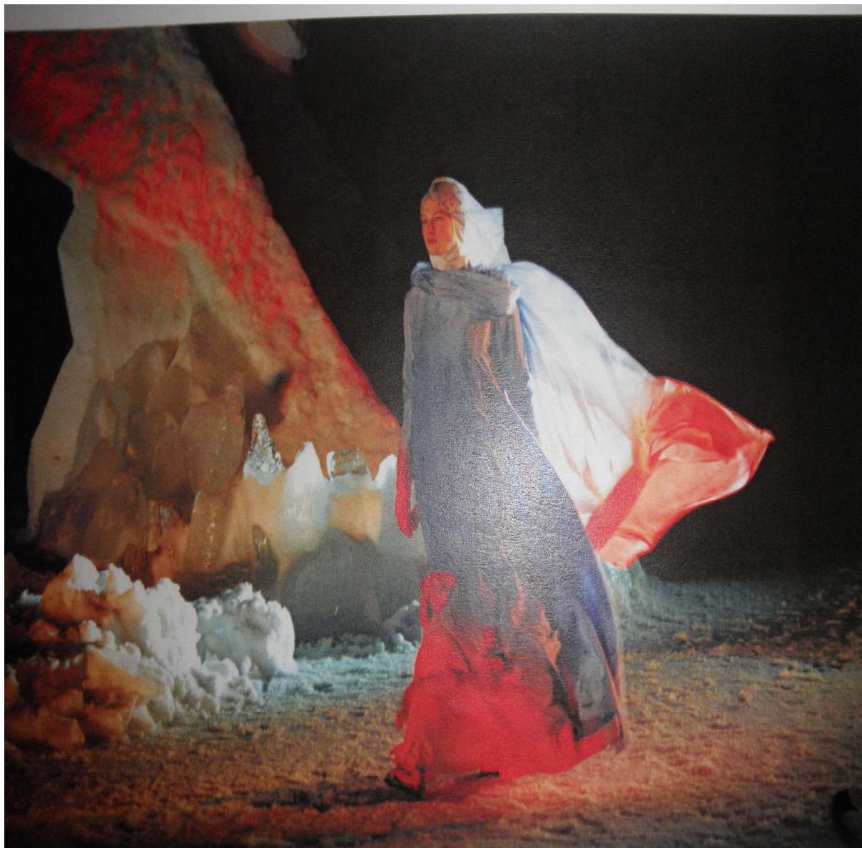
Kuva 2. Kouta-draama