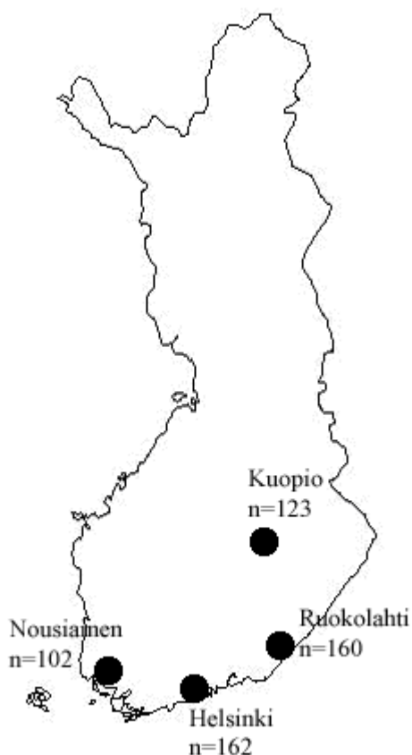
KAAVIO 4. Otopaikkakunnat ja otantamäärät paikkakunnittain marraskuussa 2006.