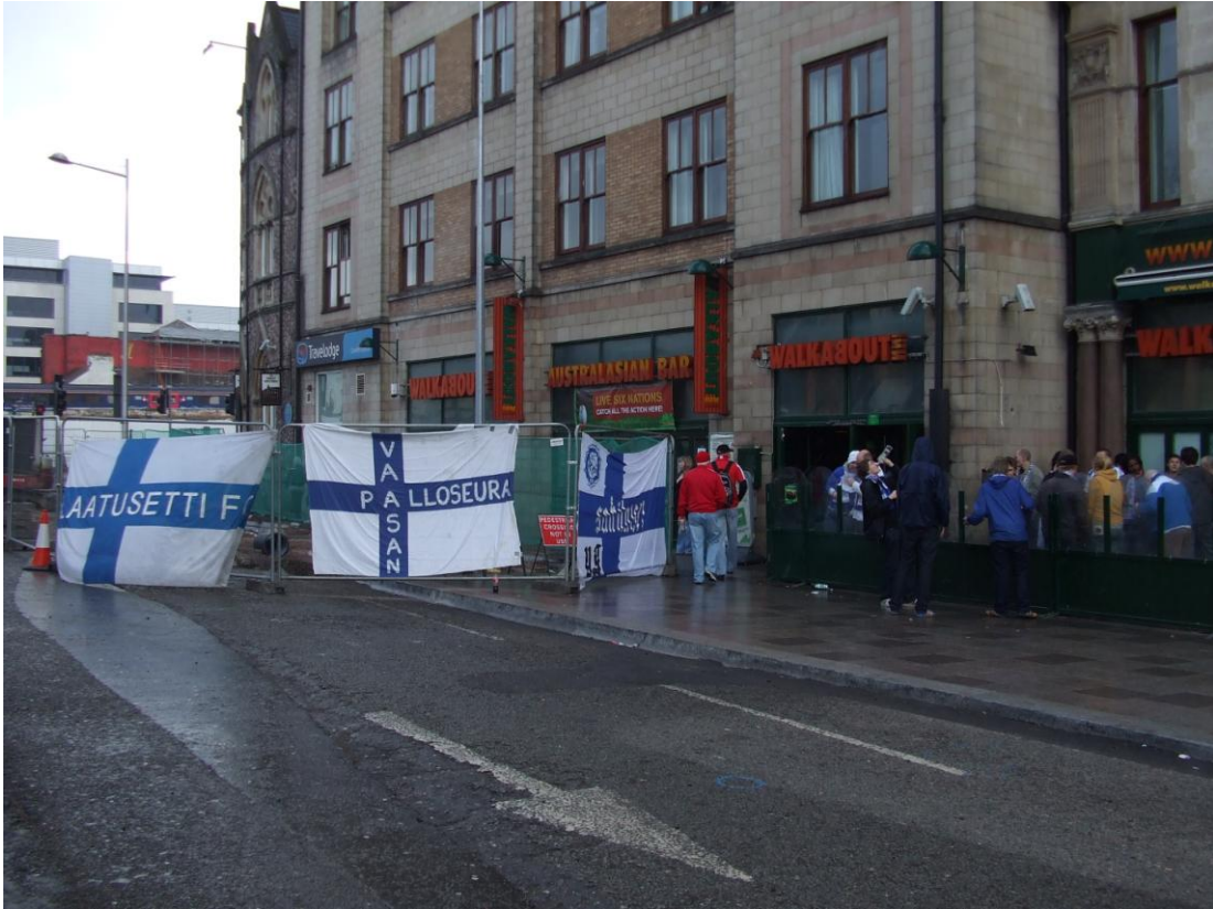
Kuva 1. Maajoukkueen kannattajien lippuja pubin edustalla ottelumatkalla Cardiffissa vuonna 2009

Suomen maajoukkueen kannattajat on suurin yksittäinen suomalainen jalkapallokannattajaryhmittymä. Helposti saavutettaviin vieraspeleihin matkustava kannattajayhteisö on nykyään yleensä yli tuhatpäinen. Näin on viime vuosina ollut muun muassa Saksassa, Walesissa, Hollannissa, sekä Ruotsissa pelattujen vierasotteluiden kohdalla (Tikander 2010). Merkille pantavaa on että esimerkiksi Ruotsissa Tukholman Råsundalla 7.6.2011 pelatulla vuoden 2012 EM-karsintaottelulla ei ollut juurikaan suurempaa urheilullista tai tuloksellista merkitystä. 2012 EM-lopputurnauskarsinta oli jo aiemmin epäonnistunut Suomen A-maajoukkueelta siinä määrin, että mahdollisuudet lopputurnauspaikkaan olivat lähinnä teoreettiset. Ruotsiin matkasi silti noin 1500 maajoukkueen kannattajaa. Näin ollen voidaan ajatella, että paikalle matkustaneiden kannattajien motiivina ei voinut olla ainakaan mahdollinen menestys kyseisissä lopputurnauskarsinnoissa. Syynä saattoikin olla vain Tukholman helppo saavutettavuus, tai Ruotsin maine rakkaana urheilukilpakumppanina Suomelle. Suomalaisten kannattajien määrä oli kuitenkin annetuista lähtöasetelmista katsottuna merkittävä ja poistaa perustelut väittämältä, jonka mukaan kannattajayhteisöä pääosin määrittelevä tekijä olisi pelkästään jalkapallomaajoukkueen urheilullinen menestys.