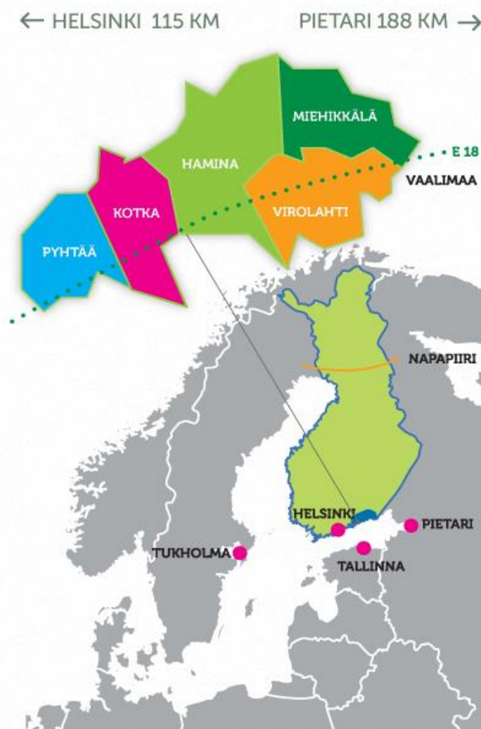
Kuva 1. Kotkan-Haminan seutu.

Kotkan-Haminan seutu sijaitsee Etelä-Kymenlaaksossa ja se koostuu Kotkan ja Haminan kaupungeista sekä Pyhtään, Virolahden ja Miehikkälän kunnista. Asukkaita seudulla on noin 88 000. (Kaakko135°.)