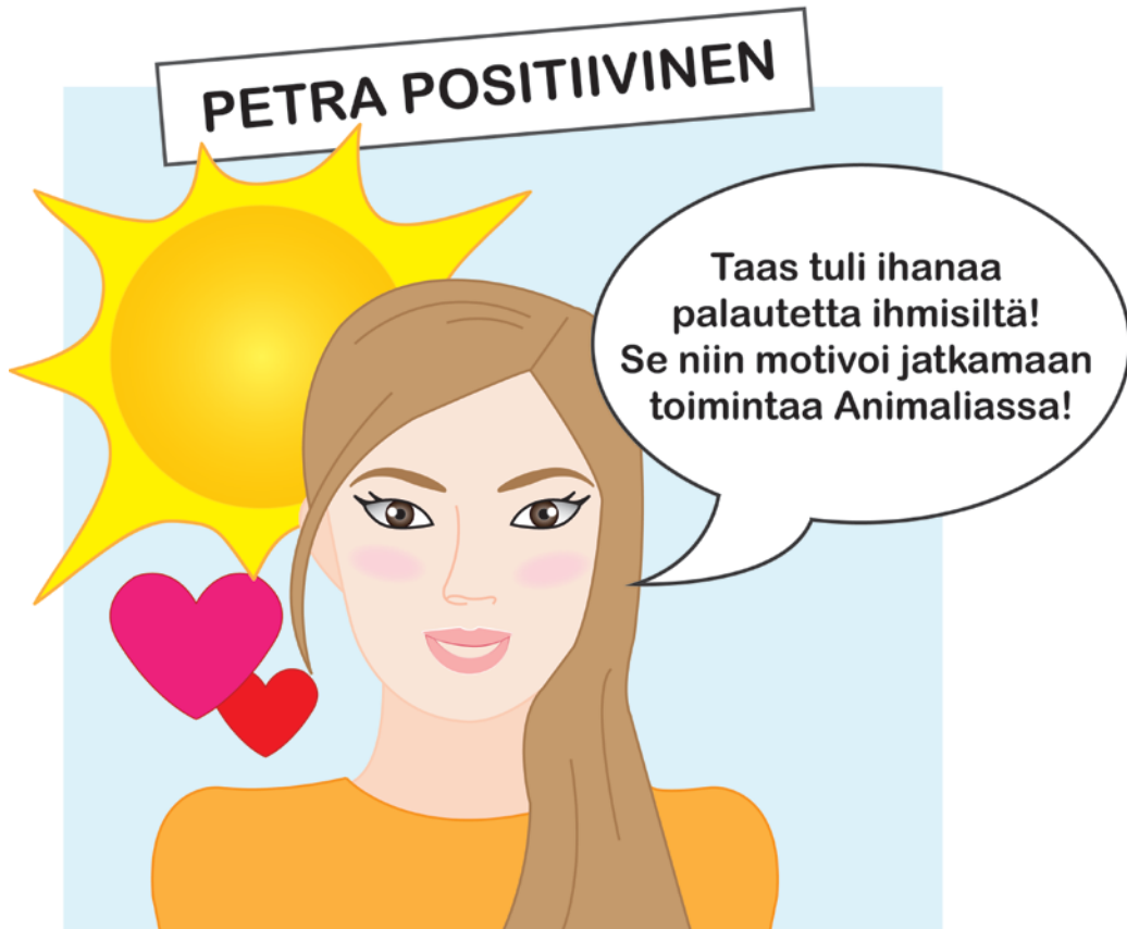
Kuva 3. Positiivisen viestinviejän persoonakuva

toimesta ja toimivat yleisesti muiden kannustajina sekä hyvän mielen levittäjinä. He voivat olla myös tukena ja inspiraationa henkilöille, jotka kokevat esimerkiksi ihmisten negatiivisen palautteen kovin raskaana.