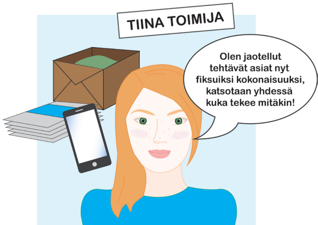
Kuva 4. Toimintaa vetävän persoonakuva