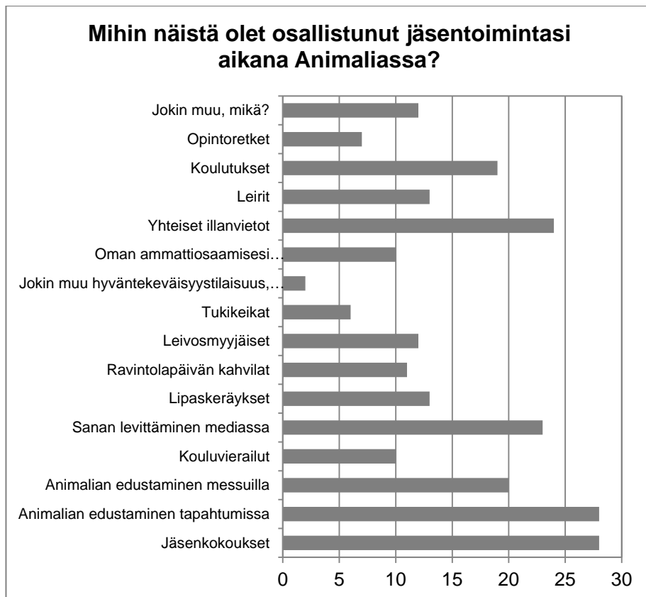
Kuvio 2. Animalian aktiivien osallistuminen eri toimiin

Eniten aktiivit olivat vastauksien mukaan osallistuneet jäsenkokouksiin ja edustaneet Animaliaa erilaisissa tapahtumissa. Myös yhteiset illanvietot muiden aktiivien kanssa, sanan levittäminen mediassa, Animalian edustaminen messuilla ja erilaiset Animalian järjestämät koulutukset olivat myös keränneet eniten osanottoa. Vähiten aktiivit olivat osallistuneet tukikeikoille ja opintoretkille.