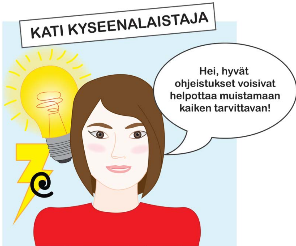
Kuva 5. Kyseenalaistajan ja uuden ideoijan persoonakuva