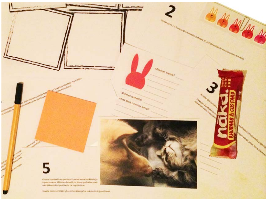
Kuva 1. Luotaimet

antaa myös tämän menetelmän myötä mahdollisuus jakaa ideoita toiminnan kehittämiseksi sekä kuvata millaista se ihanteellisimmillaan heidän mielestä olisi. Konkreettisesti nämä tehtävät olivat sarjakuvan piirtäminen, avoimiin kysymyksiin vastaamista, tarrojen liimaamista, ideointia post-it-lapuille, postikortin kuvitteellinen lähettäminen ja kuvakollaasin tekeminen.