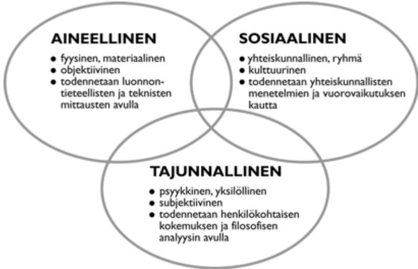
Kuvio 1. Ihmisen kolme perusolottuvuutta.

saadaan tarkastelun kohteeksi myös yhteiskunnalliset rakenteet ja laitokset, juridiset sopimukset ja säännöt sekä ihmisten välinen neuvotteleva vuorovaikutus. Näiden olemassaolo ei nouse Rauhalan kolmikannassa yhtä selvästi esiin kuin tässä.