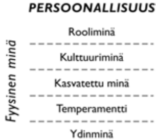
Kuvio 2. Ihmisen persoonallisuus ja minuuden eri ulottuvuudet.

Fyysinen minä. Olemme kaikki eripituisia ja erikokoisia. Meillä on ihmeellinen anatominen ja fysiologinen kokonaisuus, joka kulkee mukamme kaikkialle minne menemme. Fyysinen minämme käsittää kaiken aineellisen, jota voimme käsin koskettaa ja erilaisilla luonnontieteellisillä laitteilla mitata ja tutkia. Kehomme on osa luomakuntaa ja toimii samojen periaatteiden mukaan kuin luonto ja aineellinen universumi. Fyysinen minämme näkyy selvästi ulospäin, kun taas persoonallisuutemme muut ulottuvuudet toimivat syvemmillä sisäisyydessämme. Fyysiseen minään kuuluu myös yksilön suhde omaan aineelliseen kehoonsa, hänen niin sanottu kehonkuvansa eli suhde omaan kehollisuuteensa.