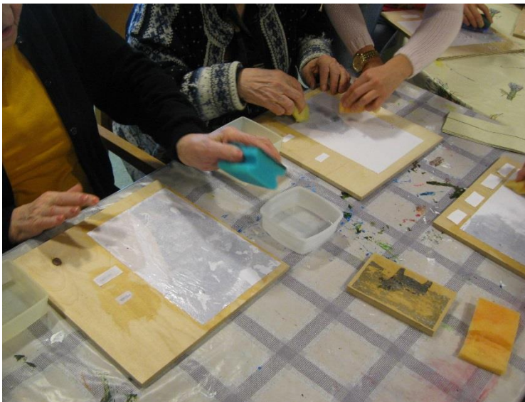
Kuva 2. Paperin irrottamista kuudennella työpajakerralla.

Kuudes työpaja käytettiin paperin irrottamiseen, jolloin vain muste jäi kiinni puuhun. Jokainen sai oman puulevynsä työstettäväksi. Kostutetun pesusienen kanssa paperi lähti pikku hiljaa pois. Oli hienoa, kun kuva omasta esineestä ilmestyi paperin alta. Työvaihe kesti kauan, joten viimeistelimme ohjaajien kanssa työt pajan loputtua. Hinkkauksen ja kuivumisen jälkeen lakkasimme vielä kuvat, jolloin musta väri syveni ja teokset tulivat viimeistellyn näköisiksi.