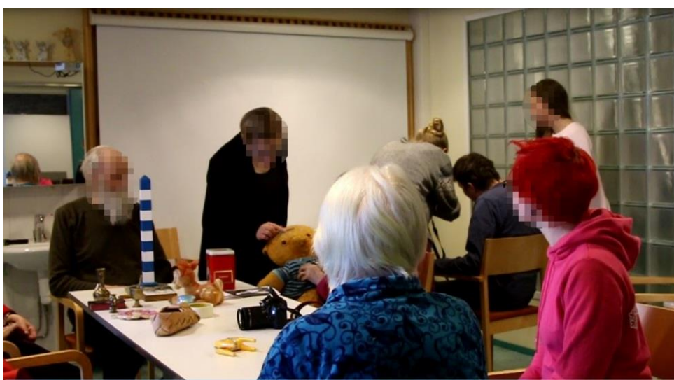
Kuva 3: Valokuvauskerran toimintaa (pysäytys videomateriaalista).

Työpajojen aikana kuvataidekasvatuksen opiskelijat ottivat keskimäärin enemmän vastuuta alkuohjeistuksen kanssa. Taiteellisen toiminnan aikana kaikki opiskelijat auttoivat osallistujia ja osallistuivat työpajan kulkuun suunnilleen tasapuolisesti. Jokainen ohjeisti työpajan alun vähintään kerran. Työpajojen aikana sosiaalityön ja kuvataidekasvatuksen opiskelijat toimivat yhteistyössä spontaanisti, eikä erilaisia ammatillisia rooleja pohdittu niiden aikana. Toiminta eteni omalla painollaan ja olimme joustavia tilanteiden vaatimalla tavalla. Alla olevassa tilannekuvassa pöydän ääressä ikääntyneiden kanssa ovat sosiaalityön opiskelijat ja taaempana kuvataidekasvatuksen opiskelijat auttavat yhtä osallistujaa valokuvauksessa.