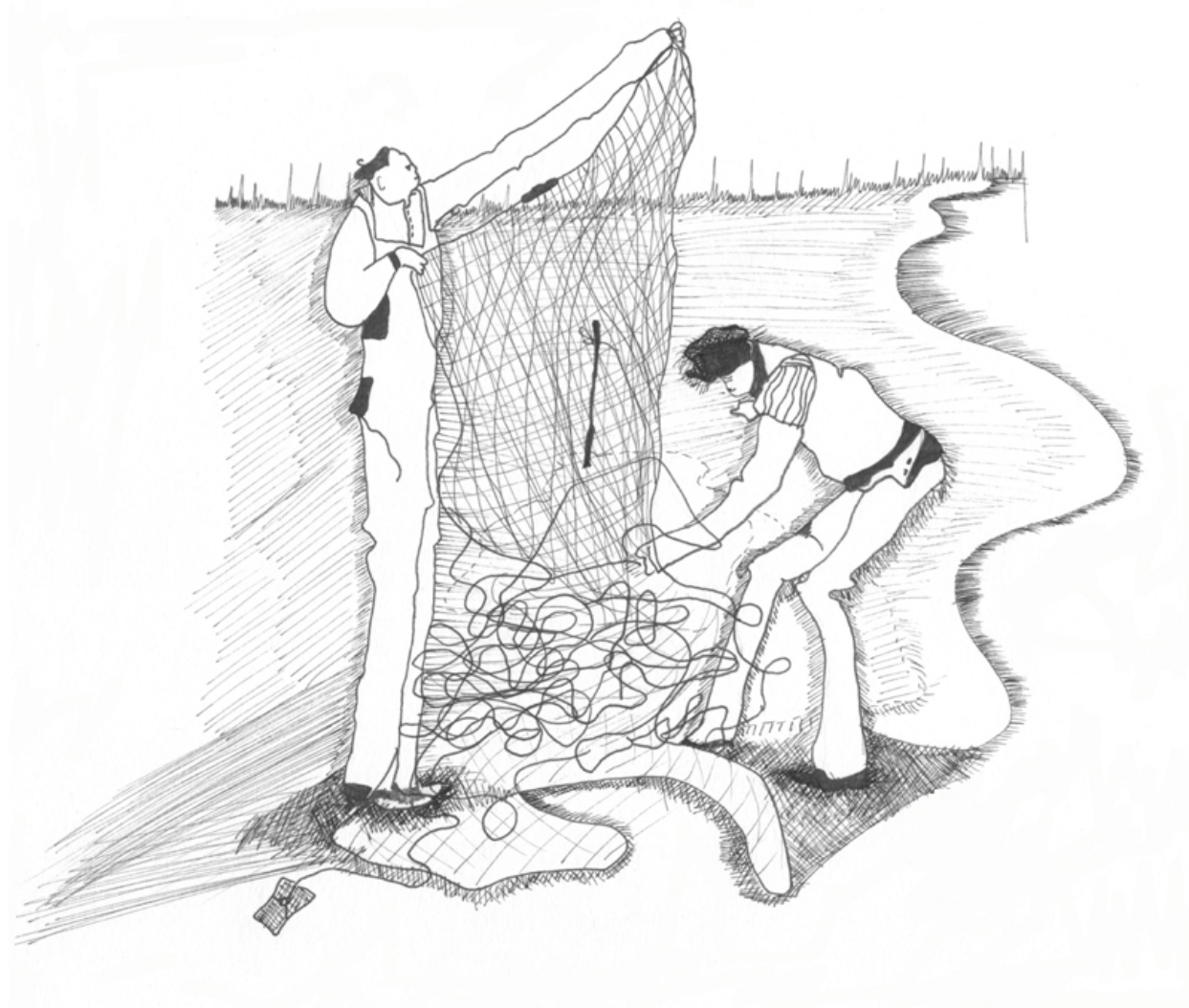
Kuva 1 Kalastusverkon selvittäminen

Seuraavassa esittelen kaksi esimerkkiä siitä, miten sama kuva ilmeni erilaisena eri kertojille. Kumpikin kuva valittiin kolmesti kuvaamaan työssä vastaan tulleita ilmiöitä ja kokemuksia. Kuva 1 esittää kalastusverkon selvittämistä, ja Kuvassa 2 hahmo kantaa saapasta. Aina kuvan jälkeen esitän ensin kuvaa käsittelevät sitaatit aikajärjestyksessä, minkä jälkeen esitän analyysin kuvan ilmenemisestä puhujille.