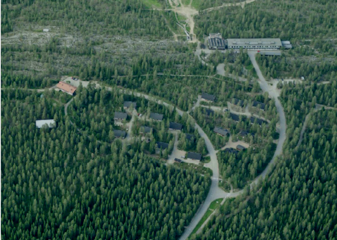
Kuvio 1. Ounasvaaran lakialue. (Rovaniemen kaupunki, Kaavaselostus, 2014, kansilehti.)

Ounasvaara 2 kehittämissuunnitelma valmistui vuonna 2006. Tässä suunnitelmassa visioitiin Ounasvaaran olevan vuonna 2020 turvallinen ja monipuolinen rovaniemeläisten virkistyspaikka, suosittu matkailukohde ja talvilajien huippu-urheilun keskus. Kehittämisen tavoitteena oli kävijöiden määrän lisääminen, maiseman ja luonnon turvaaminen ja saavutettavuuden parantaminen. Myös kesän vetovoimaisuuden lisääminen, laadun kohottaminen, yhteistyön lisääminen ja paikallisen kulttuurin ja identiteetin huomioiminen suunnittelussa olivat pitkän tähtäimen kehittämisen tavoitteita. (Ounasvaara 2 kehittämissuunnitelma, 2006, s. 5–6.)