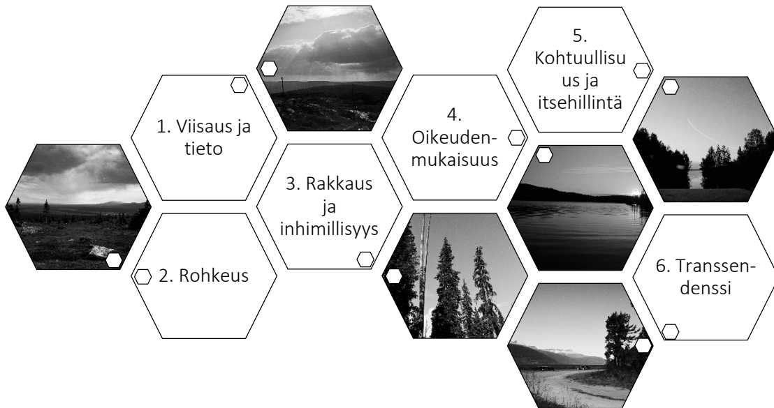
Kuvio 1. Positiivisen psykologian hyveet (Seligman 2008, 171-192).

transsendenssin jokseenkin abstraktit hyveet ovat, kuten jo mainittu, jaoteltu 24:een luontevahvuuteen, jotka koetaan selkeästi havaittavissa olevina luonteenpiirteinä, jotka näyttäytyvät erilaisissa tilanteissa ja olosuhteissa ja ovat eräällä tapaa pysyviä ja jokaiselle ominaisia. (Peterson & Seligman 2004; Uusitalo-Malmivaara 2014, 65.)