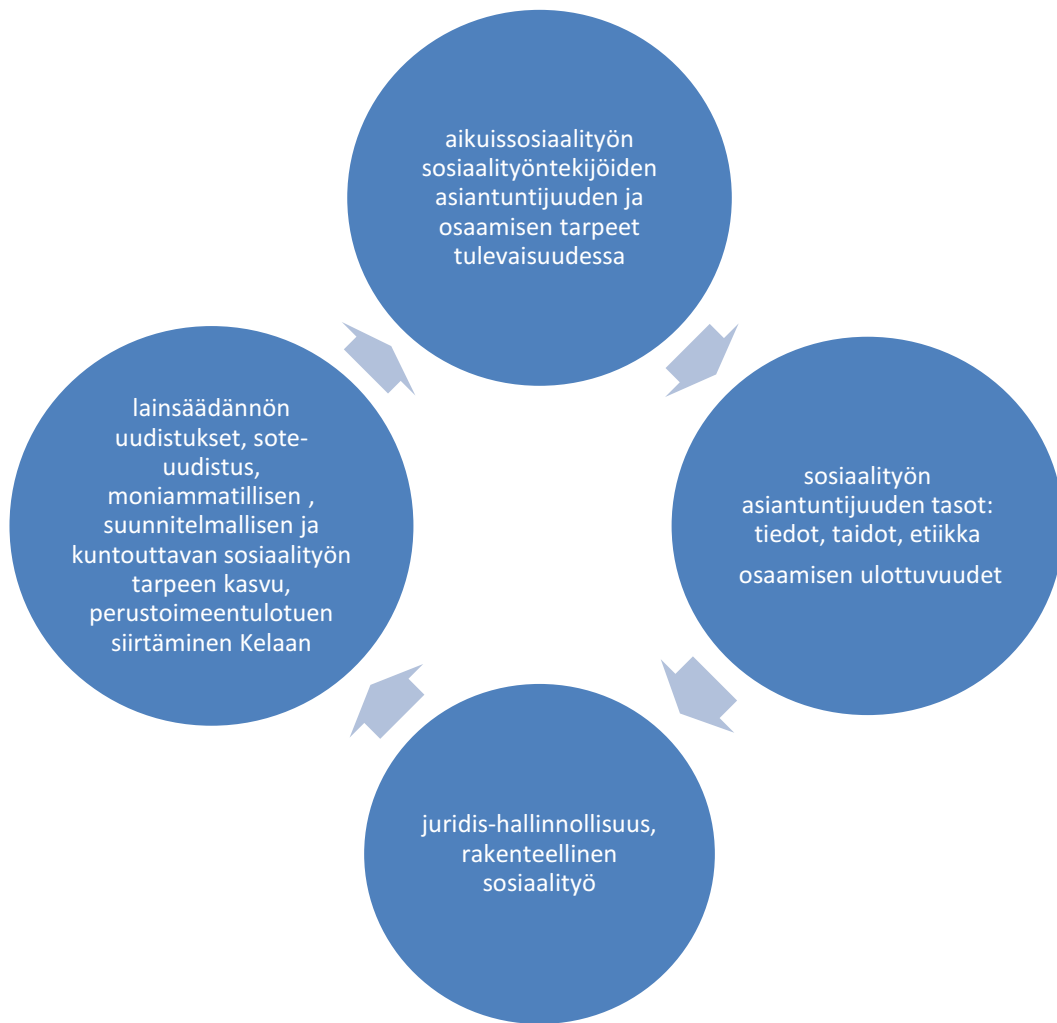
Kuvio 1 Aikuissosiaalityön osaaminen ja asiantuntijuus kontekstissaan.

Asiantuntijuuden rinnalla käytetään myös osaamisen käsitettä. Yleisesti ajatellaan, että asiantuntijuus synnyttää osaamista ja päinvastoin, jota alla olevassa kuviossa on kuvattu hyvin pelkistetyksi. Kuten edellä olevassa kuviossa todettiin, asiantuntijuuteen ja osaamisen liittyvät hyvin monenlaiset seikat, mutta pelkistetyssä kuviossa nähdään erityisesti asiantuntijuuden ja osaamisen välillä tapahtuva vuorovaikutussuhde, jotka vaikuttavat toinen toisiinsa. Tästä syystä nuoli kulkee kuviossa 2 molempiin suuntiin.