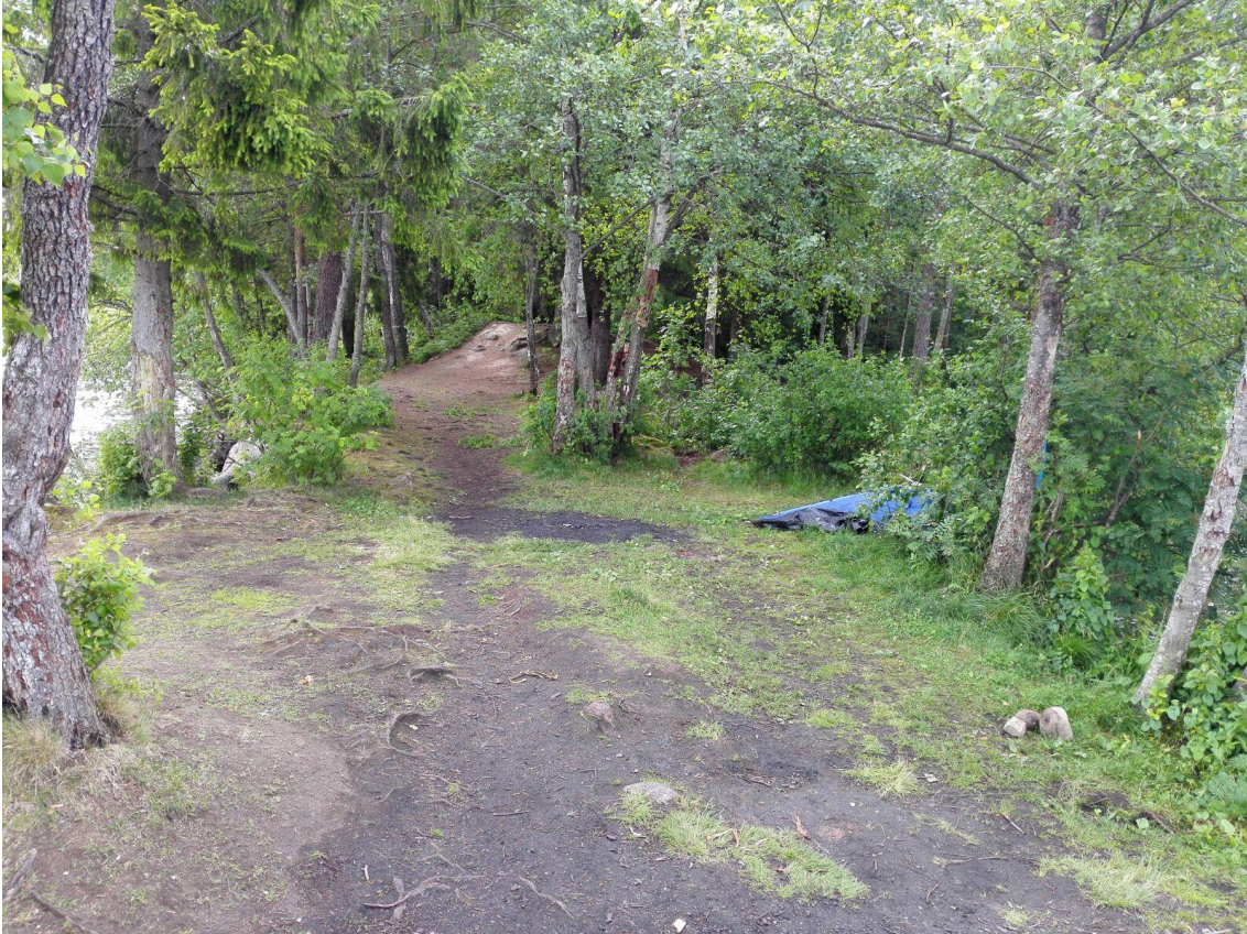
Kuva 3. Bodominjärven murhapaikka 6.7.2017. Matkailijat ovat jättäneet jälkeensä teltan sekä useita pieniä nuotioita.

myös mahdollisuuksiin pelkomatkailulle. Murhaleikillä viitataan Bodom-elokuvassa tapahtuvaan murhaleikkiin, jossa nuorten yöpyminen Bodominjärvellä murhan tutkimisen tai uudelleen näyttelemisen sijaan kääntyy murhaleikiksi ja selviytymistariksi.