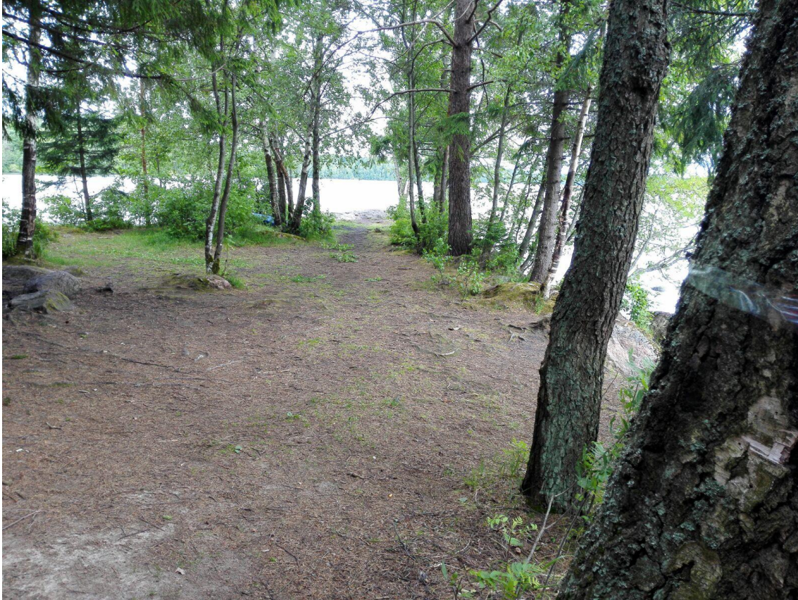
Kuva 1. Bodominjärven murhapaikka 6.7.2017. Etualalla sijaitti nuorten telttä.