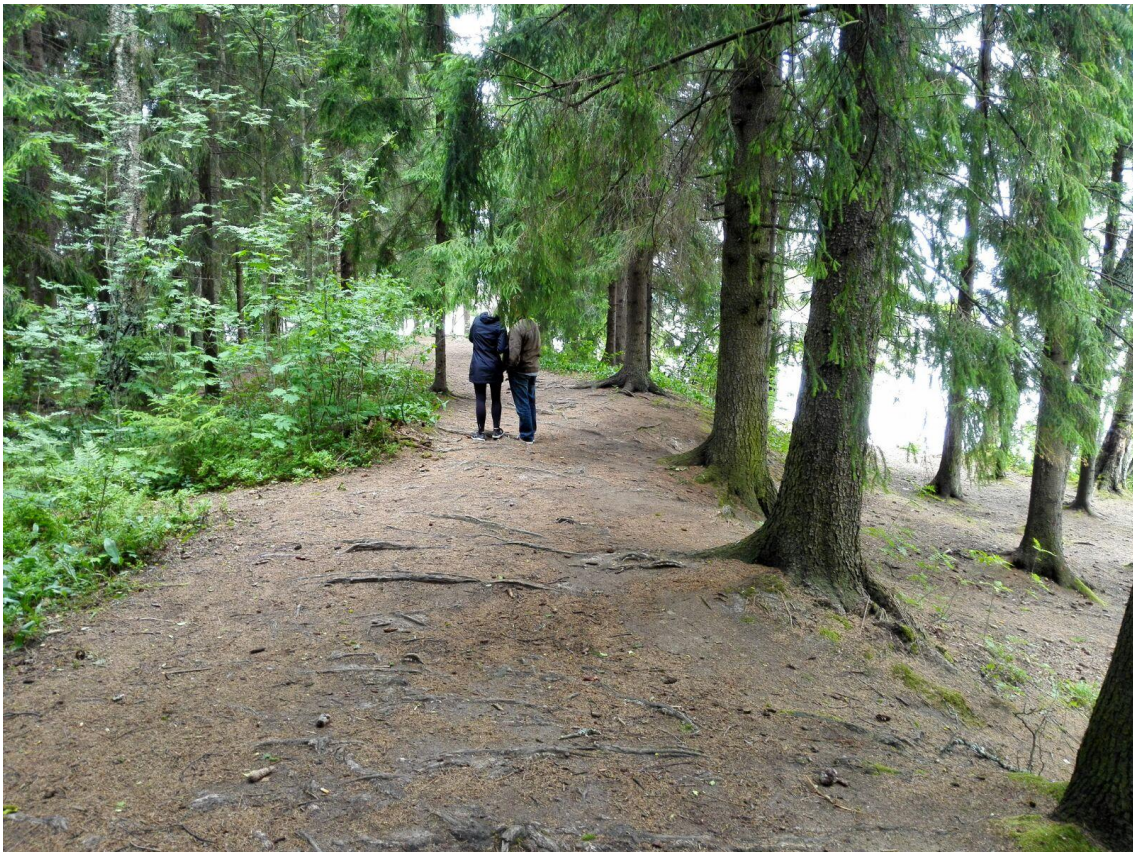
Kuva 2. Reitti Bodominjärven murhapaikalle 6.7.2017

Bodomia kuvataan tässä arvostelussa jo pahana paikkana. Jo adjektiivin paha merkitys tuo synkän mielikuvan Bodomille, joka yhdistetään Bodominjärveen pahana. Paha on hyvän vastakohta. Paha paikka on hyvän paikan vastakohta. Englanniksi sana paha kuvastaa alueen mielikuvaa paremmin kuin suomeksi käännettynä. Suomeksi pahalla voi olla useita erimerkityksiä, mutta englanniksi sana evil kuvaa jo hyvin synkkää paikkaa. Kielikuvat ovat henkisiä kuvia, jotka ovat kokemuksen tuotteita, asenteita, muistoja ja välittömiä tuntemuksia. Ne tulkitsevat informaatiota ja ohjaavat käyttäytymistä ja tarjoaa vakaan järjestyksen suhteista välillä objektit ja konseptit. Paikan tuntu koetaan narratiivien kautta erilaisten tarinoiden muodossa (McCabe & Marson, 2006, s.101).