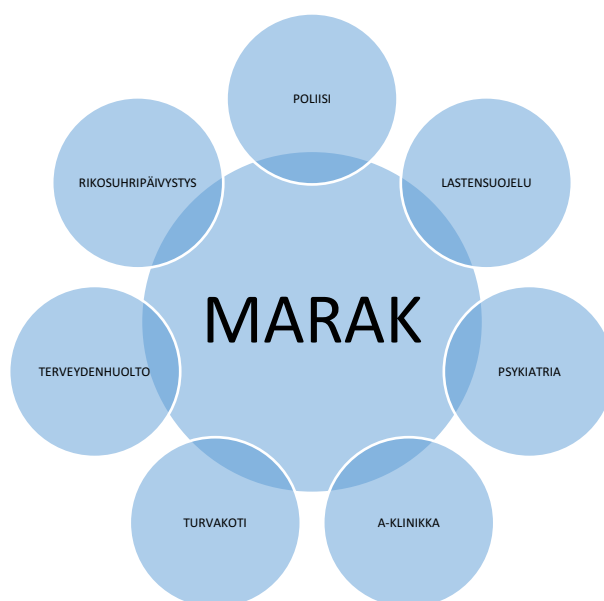
Kuva 2 Esimerkki MARAKin kokoonpanosta, josta löytyvät kaikki oleelliset väkivallan auttamisen tahot yhdestä paikasta

Eri alan ammattilaiset tuovat työskentelyyn erilaisia näkökulmia. Esimerkiksi opettajat voivat tuoda työryhmälle lasten arjesta paljon tärkeää tietoa, sillä lapset viettävät suuren osan arjestaan koulussa. Moniammatillisessa työssä on tärkeää ammattilaisten tietämys sukupuolistuneen väkivallan luonteesta ja dynamiikasta. (Nikupeteri ym. 2017a, 305–306.)