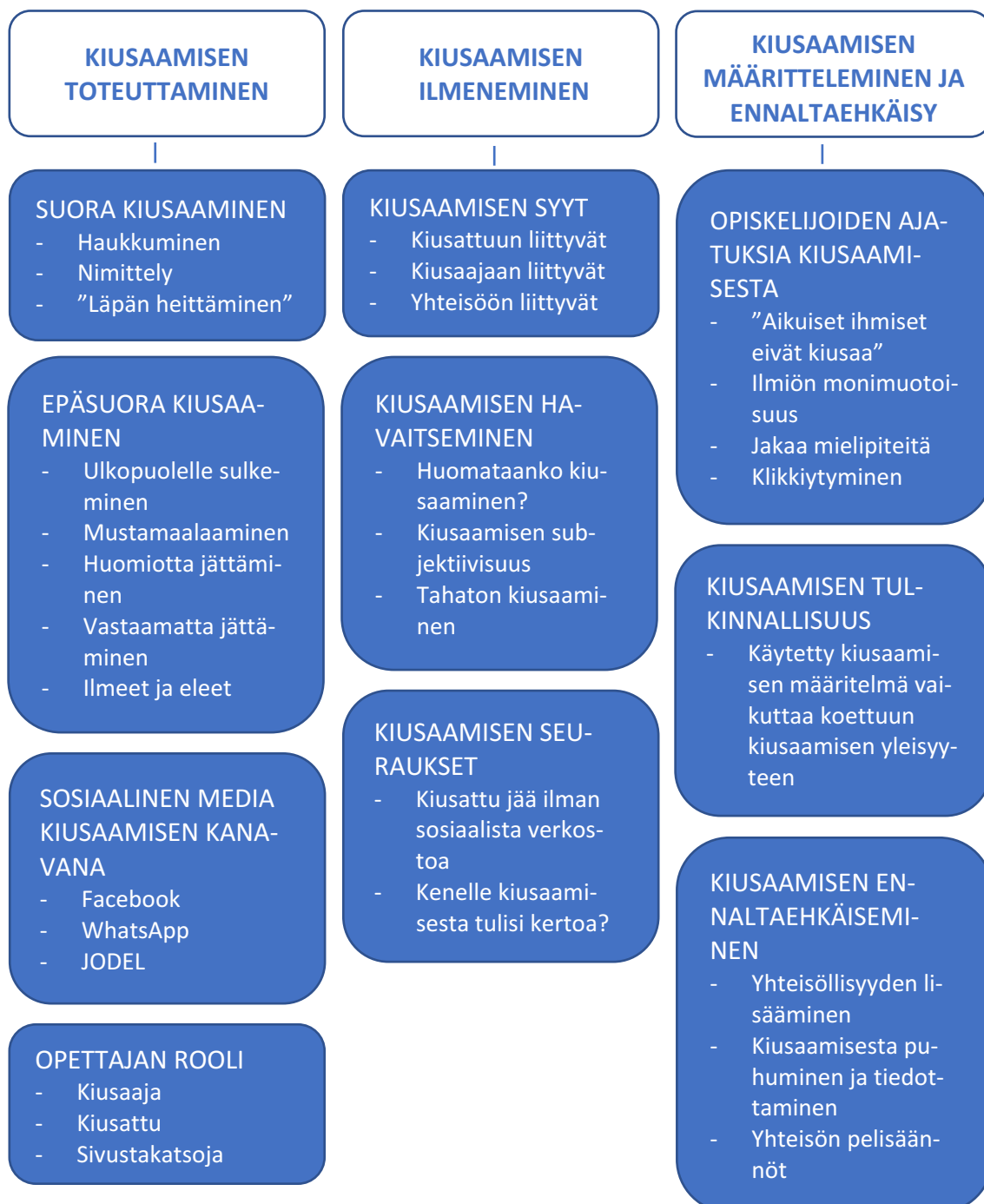
Kuvio 2. Kiusaaminen Lapin yliopiston opiskelijayhteisössä