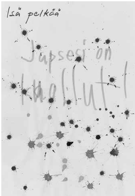
PIIROS ”Lapsesi on kuollut!”

Häilyvässä tietävässä toimijuudessa on läsnä lapsen tieto hyvässä kiinni olevasta pahasta. Erään lapsen pelkoja kuvaavassa piirroksessa paperia peittävät eriväriset roiskeet. Paperissa on teksti ”Lapsesi on kuollut!”. Piirros kuvaa lasten moniulotteisia perhesuhteitaan