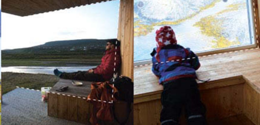
Kuva 1. Asuttamassa moderneja laavuja: Alkuperäiset valokuvat: Outi Rantala, Miia Mäkinen.

Dialogin toinen vaihe koostui huomioiden ja kokemusten tuomisesta tieteellisten käsitteiden ja viitekehysten piiriin. Muodostimme dialogin ensimmäisessä vaiheessa tekemiemme huomioiden pohjalta kolme väitettä, jotka kuvaavat laavujen ominaisuuksien vaikutusta ihmisen luontoyhteyteen ja sen vahvistamiseen. Nämä olivat: