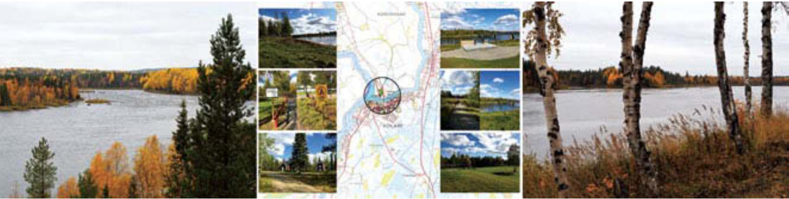
Kuva 5. Kuvia Väylänvarrelta ja ennalta valittujen paikkojen esitietoja.

Norberg-Schulzin (1985) mukaan asuttaminen liittyy paikan ominaisuuksiin ja merkitsee eräänlaista ystävystymistä luonnollisten paikkojen kanssa. Väylänvarrella meidän tutkijoiden asuttamisen voidaan ajatella alkaneen jo Kolarin kunnan valikoiduttua kohteeksemme ja tavatessamme kunnan edustajat. Opiskelijoilla asuttaminen vuorostaan käynnistyi heidän valittuaan kurssin, saadessaan kurssin ohjeistuksen ja