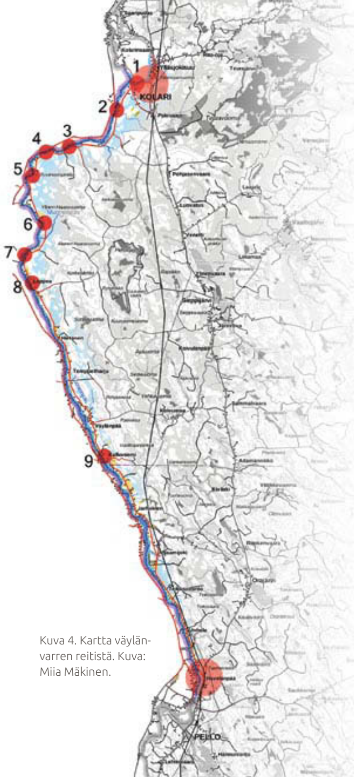
Kuva 4. Kartta väylänvarren reitistä.

Koska Väylänvarren reitillä on Pellosta Kolariin matkaa noin 70 km, tarvitsimme viikon mittaisella kurssillemme selkeät paikat joiden pohjalta opiskelijat pääsisivät suhteellisen nopeasti kiinnittymään ympäristöön ja aihepiiriin teemoihin. Kunnan edustajien kanssa pystyimme valitsemaan etukäteen reitin varrelta yhdeksän eri paikkaa (Kuva 4), joiden yhteydessä useimmissa oli jo valmiiksi pysähtymis-