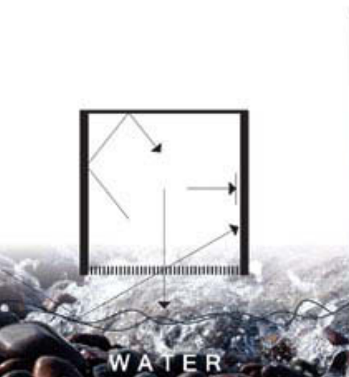
Kuva 3. Tilakonseptit hahmottuvat.