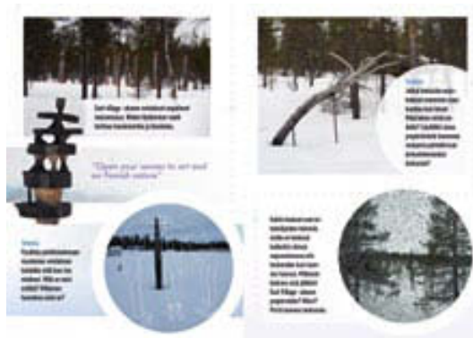
East Village -alueen taidepolun karttaluonnosaukeama.

tulkintaan virittävät materiaalit. Jokaisella polulla on oma teemansa, joka sopii kyseisen reitin teosten luonteeseen ja erilaisten matkailijoiden tarpeisiin.