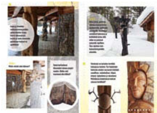
West Village -alueen taidepolun karttaluonnosaukeama.

Taidekarttojen tavoite on luoda uusia mahdollisuuksia taideteosten hyödyntämiseen Kakslaut-tasen kaltaisessa matkailuympäristössä. Karttojen tärkein tehtävä on helpottaa tutustumista veistoskokoelmaan ja toimia apuna nykytaiteen vastaanottamisessa. Taidekartta antaa teoksille niiden ansaitsemaa huomiota. Alueen taide tekee Kakslauttasesta persoonallisen ja mieleenpainuvan matkailukohteen. Suunnitellut taidekartat mahdollistavat itseohjautuvan tutustumisen alueen taiteeseen, jolloin tähän toimintaan ei tarvita erikseen järjestää oppaita ja ajanvarauksia. Taidekarttojen avulla voi suunnistaa kokoelman parissa niin yksin kuin yhdessä. Asiakas voi itse päättää veistoksiin tutustumisesta oman aikataulunsa ja kiinnostuksensa mukaan, mikä madaltaa taiteen kohtaamisen