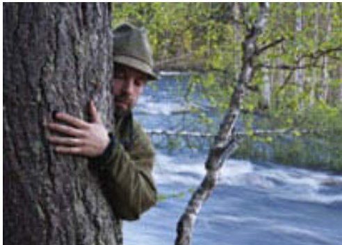
(Teoksesta Puunhalaaja)