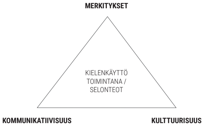
Kuva 1. Diskurssianalyysin kolmio.

voidaan jäsentää ulottuvuusparien avulla. Yksi näistä ulottuvuuspareista on kriittinen ja analyttinen diskurssianalyysi. Ulottuvuusparien avulla voidaan täsmentää diskurssianalyttisen tutkimuksen kolmiota ja sen kärkien välisiä suhteita. (Jokinen, Juhila & Suoninen, 1999, s. 54–55.)