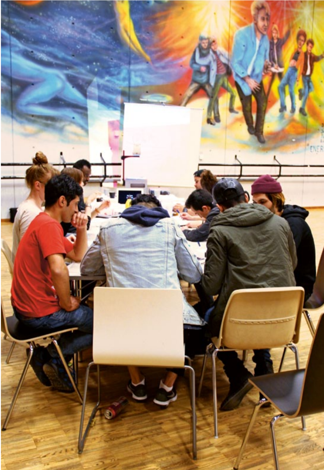
Ensimmäisen tapaamiskerran työskentelyä nuorisokeskus Mondella.