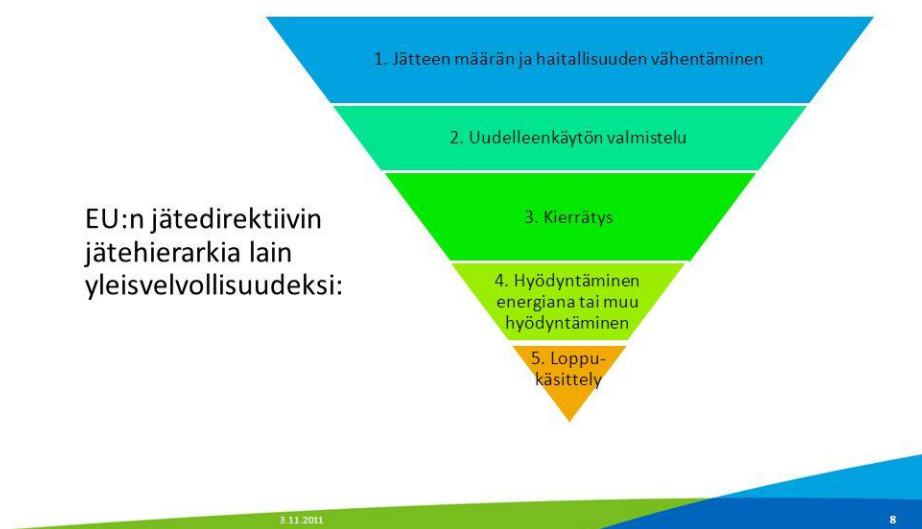
Kuva 1. EU:n jätehierarkia eli etusijajärjestys (Ympäristöministeriö 2011)

Yhdyskuntajätteen osalta kiinnitän huomiota kohtiin 3 ja 4. Kotitalouksien on vaikeaa ehkäistä jätteiden syntyä kokonaan tai käyttää niitä uudestaan samoihin tarkoituksiin. Vuonna 2015 noin puolet yhdyskuntajätteistä käsiteltiin Suomessa kohdan 4 tavoin polttamalla energiaksi (SVT 2017). Jätehierarkia ja kiertotalouden tavoitteet vaativat kuitenkin suurempaa panostusta kierrättämiseen, eli kohtaan 3. Yhdyskuntajätteiden kierrätyksen suhteen kiertotalouden mahdollisuudet ovat kotitalouksien varassa. Ne tekevät itsenäisesti päätökset, jotka johtavat jätteiden syntyyn ja siihen millä tavalla niitä käsitellään. Näin kansalaisesta on tehty yhdyskuntajätehuollon keskeinen toimija.