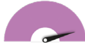
HAUN VAATIVUUS Vaatii asiantuntijatyötä