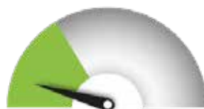
HAUN VAATIVUUS Nopea ja helppo