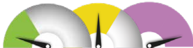
SOPIVIN TRL-TASO 1–9, mutta pääpaino investoinneissa, TRL 6–9