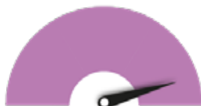
HAUN VAATIVUUS Vaatii asiantuntijatyötä