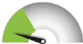
HAUN VAATIVUUS Nopea ja helppo

Haun vaativuus on luonnollisesti suhteellista. Nopealla ja helpolla haulla tarkoitetaan sellaista rahoitusta, jonka yritys saa tietyt vaatimukset täyttämällä ja joka myönnetään nopeasti. Keskitasolla tarkoitetaan hakuja, joissa täytyy kirjoittaa yksityiskohtaisempia hakemuksia ja perustella rahoitustarvetta tarkemmin. Haut, jotka vaativat asiantuntijatyötä, ovat erittäin kilpailtuja, hakuprosessi on hidas ja siihen uppoaa resursseja.