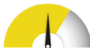
SOPIVIN TRL-TASO Pääpaino: tasot 4–6