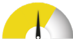
HAUN VAATIVUUS Jonkin verran työtä