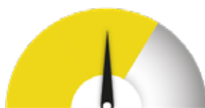
HAUN VAATIVUUS Jonkin verran työtä