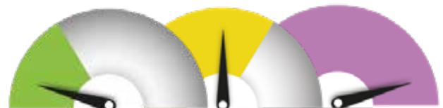
SOPIVIN TRL-TASO 1–9, mutta pääpaino investoinneissa, TRL 6–9