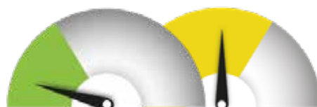
SOPIVIN TRL-TASO Tasot 1–5(6)