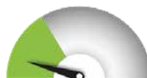
SOPIVIN TRL-TASO Tasot 1–3