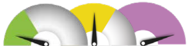
SOPIVIN TRL-TASO 1-9