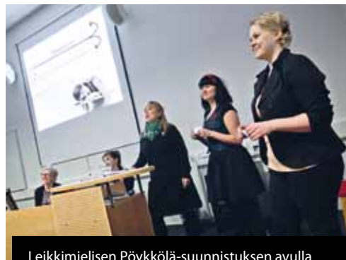
Leikkimielisen Pöykkölä-suunnistuksen avulla tutustuttiin eri koulutusohjelmien tiloihin.