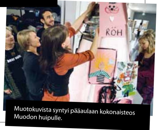
Muotokuvista syntyi pääaulaan kokonaisteos Muodon huipulle.