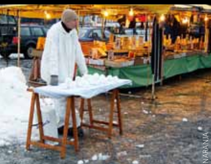
Show Business , lumipallokauppaa eri kaupunkien toreilla. Tämä kuva on Kuopiosta.