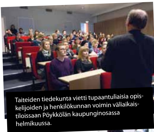
Taiteiden tiedekunta vietti tupaantuliaisia opiskelijoiden ja henkilökunnan voimin väliaikais-tiloissaan Pöykkölän kaupunginosassa helmikuussa.