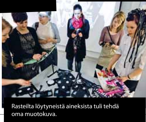
Rasteilta löytyneistä aineksista tuli tehdä oma muotokuva.