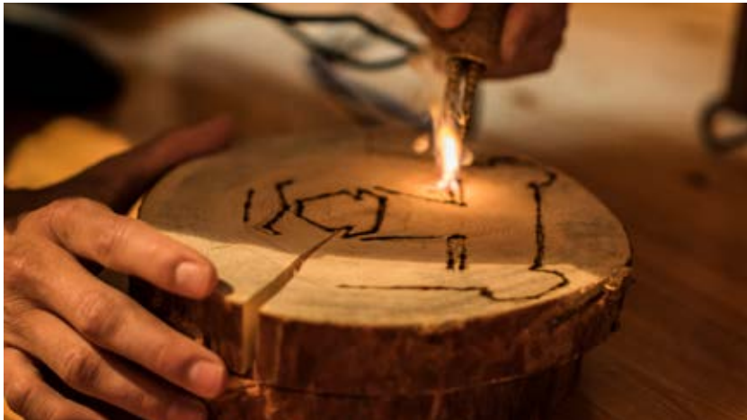
Kuva 2. Työpajassa osallistujat pääsivät suunnittelemaan puukiekkoihin tervehdyksiä. Tekijä Jussi Tervo. Kuva: Osku Tuominen, 2018.