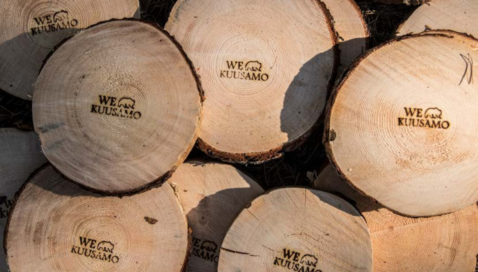
Kuva 1. Valmiit puukiekot vietiin Suomen suosituimman vaellusreitit, Karhunkierroksen tuli- ja taukopaikoille. Kuva: Jonna Kalliomäki, 2018.