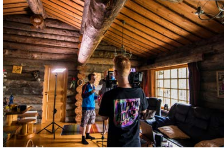
Kuva 4. Kappaleen musiikkivideon kuvaukset.

vahvistivat objektiivisen paikan kartoituksen luoman mielikuvan todeksi. Paikan tutkimuksen myötä Kuusamo ei ollut vain kaupunki pohjoisessa Itä-Suomessa, vaan sosioviisuaalisen kulttuurin merkitykset loivat paikalla identiteetin ja projektille sitä eteenpäin liikuttavan alustan.