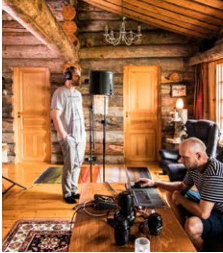
Kuva 3. Kuusamon Karhustoorit -kappaleen äänitys. Kuva: Jonna Kalliomäki, 2018.